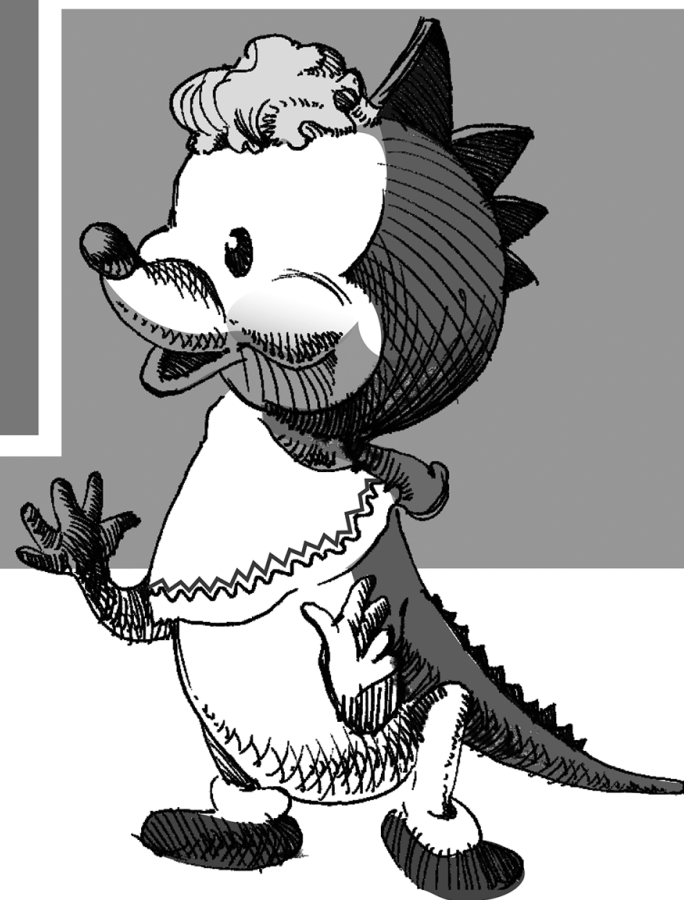
Рисунок главного дизайнера ТГУ Романа Гринёва

ТГУ // ТОЛЬЯТТИНСКИЙ ГОСУДАРСТВЕННЫЙ УНИВЕРСИТЕТ