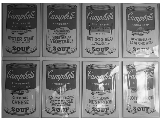
Энди Уорхол. «Банки с супом Кэмпбелл»

творчестве рисунки из газет. Модель из комикса «Тилли Тойлер» стала вдохновением для серии работ с изображением чувственных блондинок. Одна из самых известных картин – «Безнадёжность». В ней использовались несколько ярких цветов, чёрные линии и имитация типографических точек, с помощью которых художник добавлял тени и глубину.