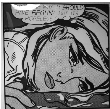
Рой Лихтенштейн. «Безнадёжность» Американский художник Рой Лихтенштейн видоизменял в своём