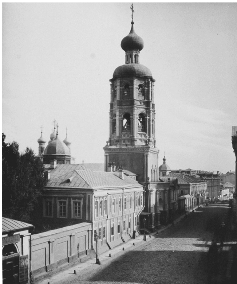
Все фотографии календаря выглядят примерно вот таким образом

Недавно мне подарили календарь с фотографиями Москвы начала XX века. Чем-то они меня заделали. Была в них какая-то пугающая тайна. Долго я не мог сообразить, что же меня встревожило.