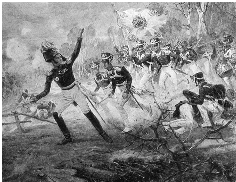
Подвиг Раевского под Салтановкой. Худ. Н. Самокиш. 1812 г.