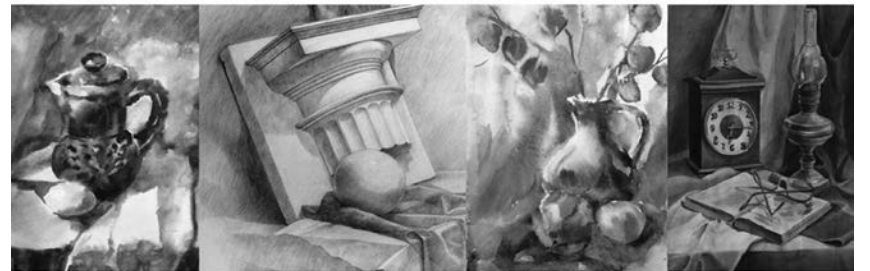
РИСУНОК · ЖИВОПИСЬ · КОМПОЗИЦИЯ · ГРАФИКА