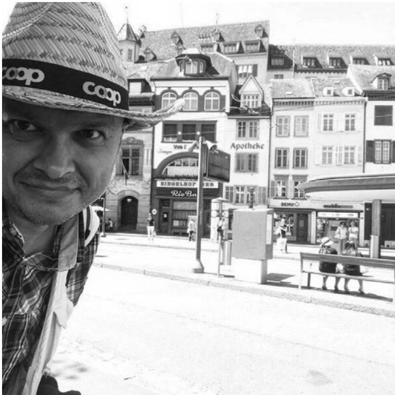
Швейцария. Базель. 1 августа, праздник объединения швейцарских кантонов. День основания Швейцарской Конфедерации. Я выиграл соломенную шляпу

— Всё это ради себя. Исключительно. Вот такой я эгоист. Когда мне задают этот вопрос, а задаёт его каждый первый, я отвечаю, что всё это ради того, чтобы, кроме табличек из Excel, было что вспомнить в 80-90 лет, когда буду лежать на смертном одре. Я с детства хотел стать путешественником и, как, наверное, многие мальчишки, бредил далёкими странами, нехожеными тропами. С течением лет всё это как-то поза-