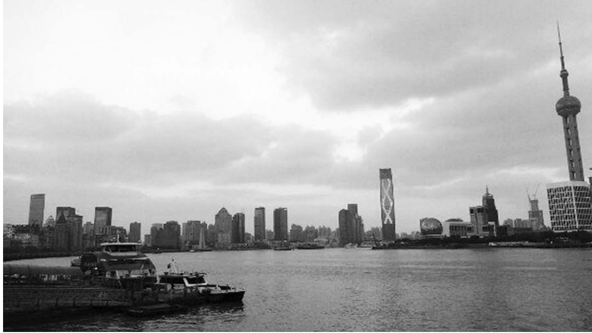
Í àááðááæ àÿ Ø áí ðàÿ

— В основном люди в той или иной мере знают английский. Во всех прочих случаях объясняемся на пальцах с использованием элементов пантомимы. Совет: перед поездкой поиграйте в крокодила.