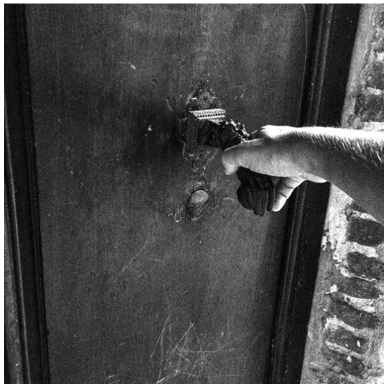
Крепость в городке Кань-Сюр-Мер, Франция

При разработке маршрута особое внимание уделяю погоде, точнее, погодным сезонным явлениям. Думаю, что никто не хотел бы попасть под палящее солнце и пятидесятиградусную жару или ежедневные проливные дожди. В Азии никому не посоветую очутиться в сезон дождей, хотя и в