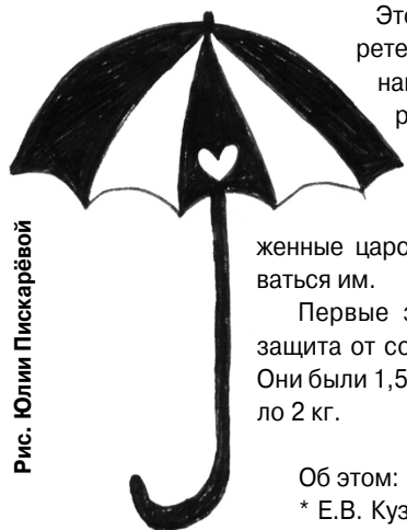
Рис. Юлии Пискаревой

Для чего предназначались первые зонты и что они символизировали?