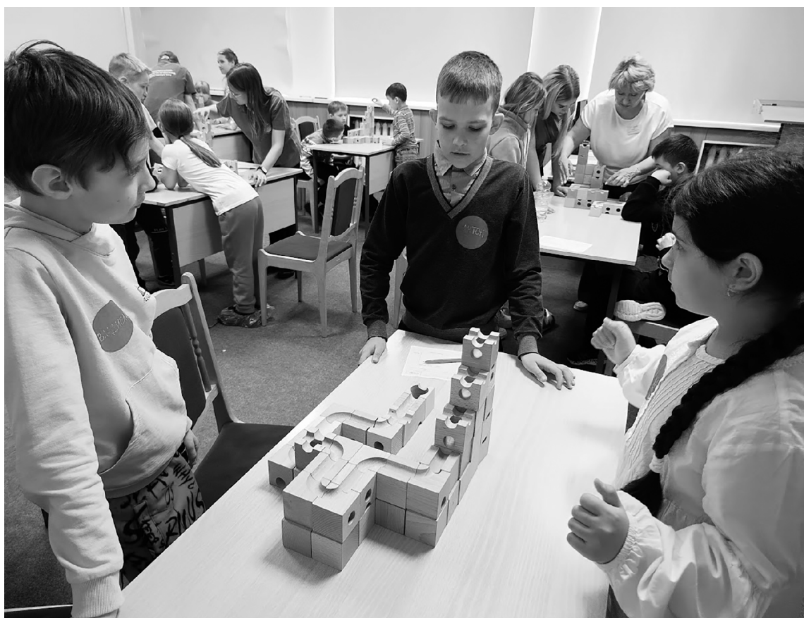
■ Конструирование CUBORO не только развивает у детей логику и мышление, но и формирует умение работать в команде, слышать и понимать друг друга

Л огическое мышление и инженерный подход требовалось проявить участникам Первого регионального чемпионата по CUBORO. Соревнования прошли 25 марта в Тольяттинском госуниверситете (ТГУ). Они определили лучшие команды школьников в этом новом интеллектуальном соревновании.