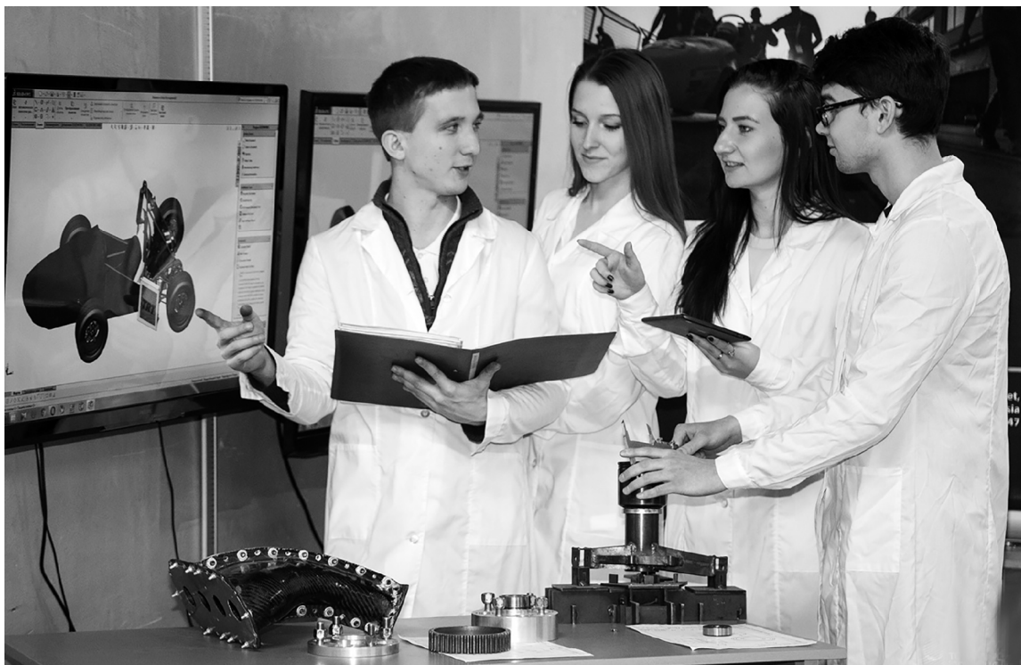
■ В 2024 году в Тольяттинском госуниверситете появятся 11 новых образовательных программ по инженерным и педагогическим направлениям подготовки

В рамках программы «Химическая технология тонкого органического синтеза и лекарственных препаратов» будут готовить специалистов, разрабатывающих технологический процесс, занимаю-