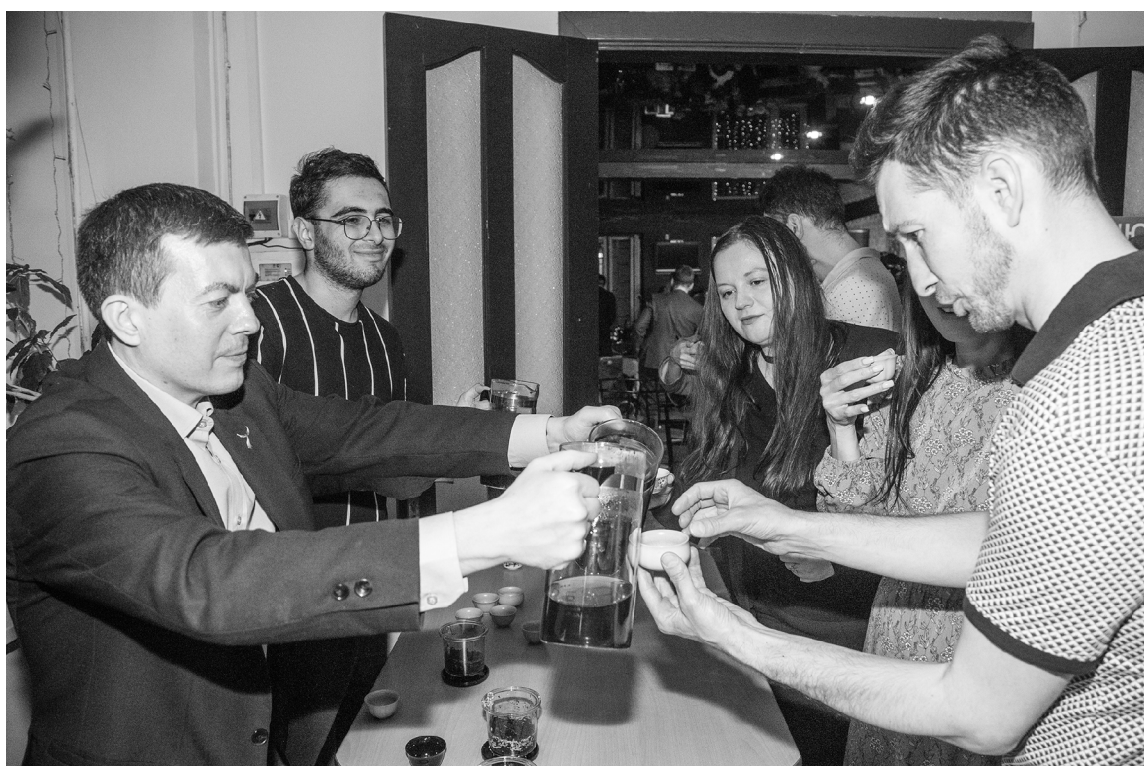
■ Кто научил студентов и преподавателей ТГУ пить чай?