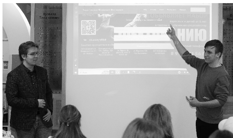
■ Благодаря проекту «Обучение служением» студенты ТГУ научились решать социальные задачи, одновременно оттачивая свои профессиональные навыки

Для Тольяттинской федерации фехтования команда