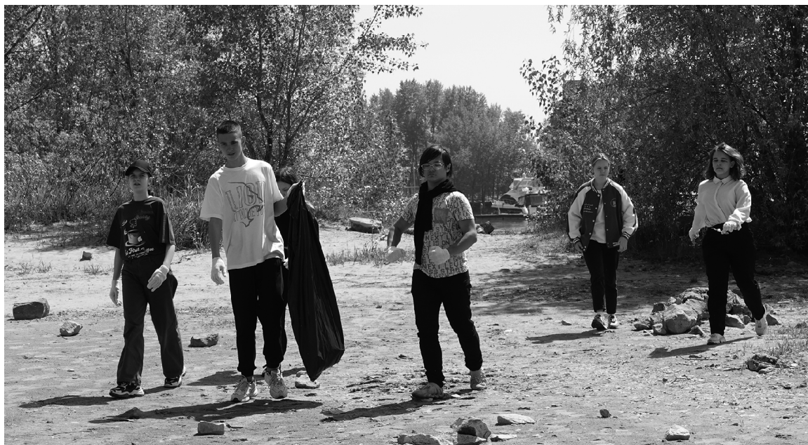
■ В экологических акциях активное участие принимают школьники Тольятти

отдел экологического просвещения в Тольятти. Наши специалисты каждую неделю проводят экоуроки в детских садах и школах города, встречаются со студентами колледжей и вузов. Каждая беседа подкрепляется практическими мастер-классами, чтобы ребята могли хорошо усвоить тему грамотного обращения с отходами и бережного отношения к природе, а по завершении встреч мы вручаем детям экосувениры — деревянные значки, книги, открытки.