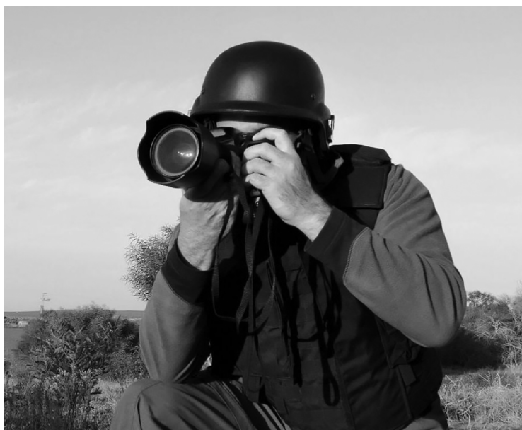
■ Специфике работы военных журналистов посвящен новый образовательный курс ТГУ

Общероссийская общественная организация по развитию казачества «Союз Казаков-Воинов России и Зарубежья» вышла с предложением на базе ТГУ создать «Школу военных корреспондентов». Совместно с кафедрой «Журналистика и социология» и военно-учебным центром ТГУ была разработана программа курса под конкретные образовательные задачи. ТГУ стал четвёртой площадкой в стране, которая в сжатые сроки готовит военных корреспондентов. В современных условиях эта специальность особенно востребована, потому что военные действия ведутся не только на полях сражений,