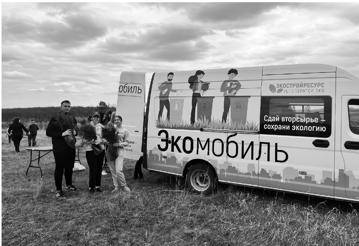
■ Проект «ЭкоМобиль» действует в Тольятти с 2016 года

Т ольяттинцы в последние годы стали проявлять больше интереса к проблемам экологии региона и всё чаще участвуют в различных экологических акциях. И это идёт в противовес тренду, озвученному Всероссийским центром изучения общественного мнения: в 2023 году зафиксировано снижение уровня вовлечённости россиян в экологические практики. Представители ПАО «КуйбышевАзот», группы компаний «ЭкоВоз» и регионального оператора Самарской области по обращению с ТКО «ЭкоСтройРесурс» рассказали о реализуемых в Тольятти экологических проектах и оценили экологическую активность горожан.