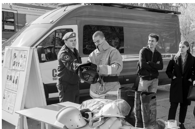
■ 100% выпускников института инженерной и экологической безопасности ТГУ находят работу по специальности

Сотни выпускников, авторитетные эксперты, сотрудничество в области техносферной безопасности с ведущими промышленными предприятиями Самарской области и России, десятки профессиональных сессий по пожарной безопасности, экологии и охране окружающей среды, конкурсы научно-исследовательских проектов для студентов и школьников — таков послужной список института инженерной и экологической безопасности Тольяттинского государственного университета (ТГУ). В этом году институту исполнился год. Преподаватели и студенты научились «жить» в новом статусе, эффективно выстроили образовательный процесс и внесли в него много нового.