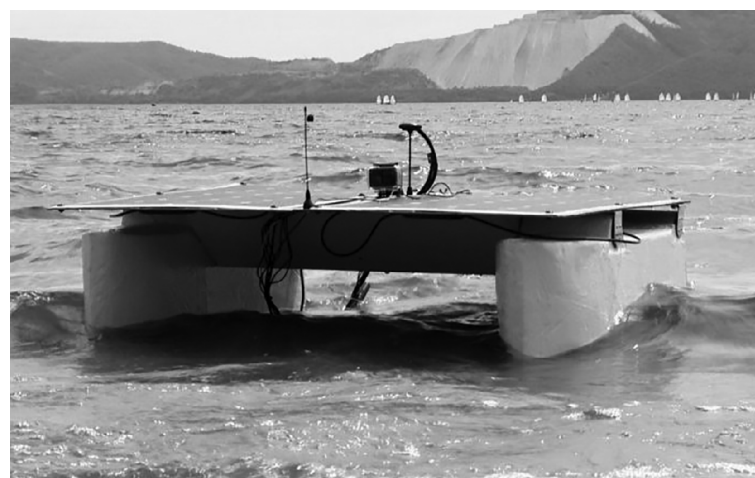
■ Прототип дрона-эколога, созданного на основе разработки ТГУ, отправился в Южную Америку

■ По информации пресс-службы Тольяттинского государственного университета, администрации г.о. Тольятти, технопарка «Жигулёвская долина»