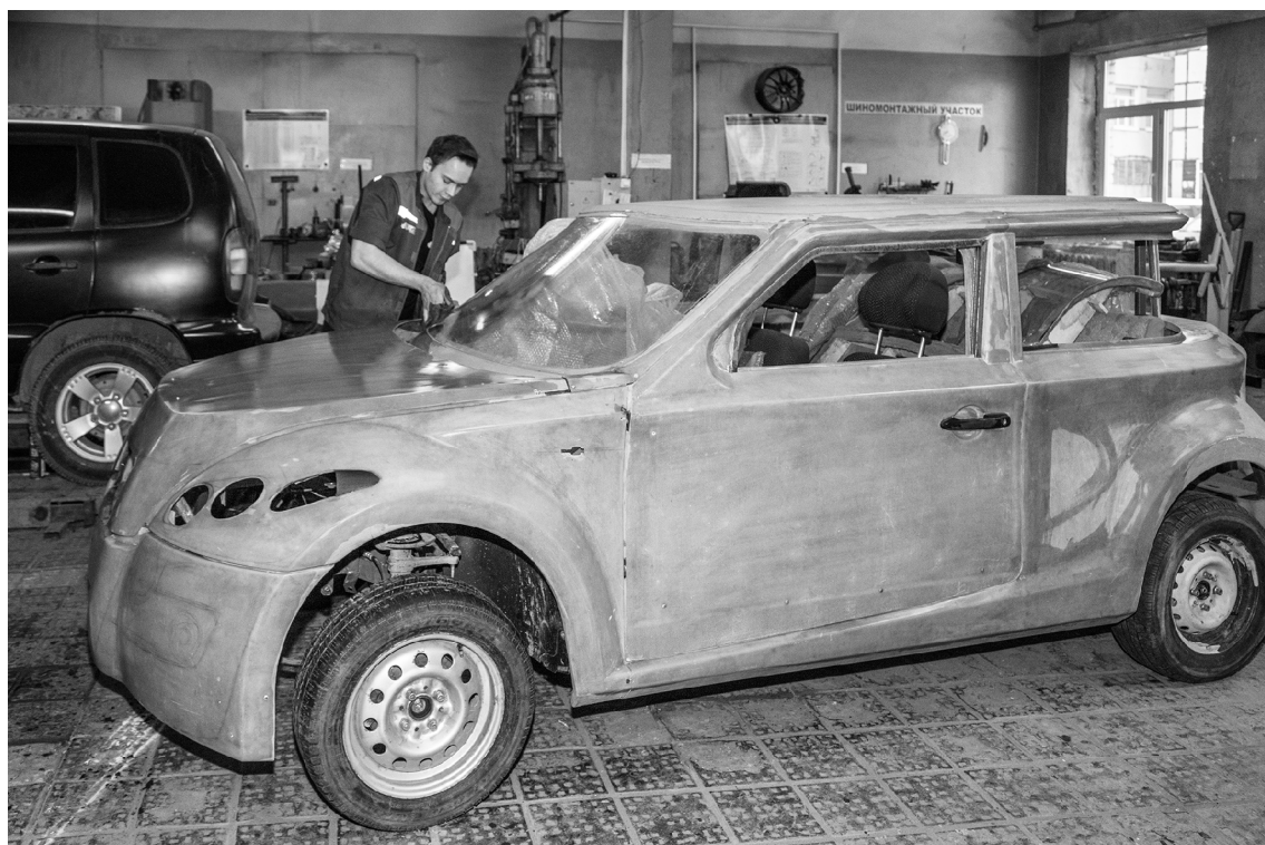
■ Подарок от «Супер-Авто Холдинга» получит электрическое сердце

В рамках проектной деятельности студенты опорного Тольяттинского государственного университета (ТГУ) займутся разработкой малотоннажного коммерческого электротранспорта. Специально для нового проекта компания «Супер-Авто Холдинг» — партнёр ТГУ — подарила вузу каркасный автомобиль с пластиковой облицовкой.