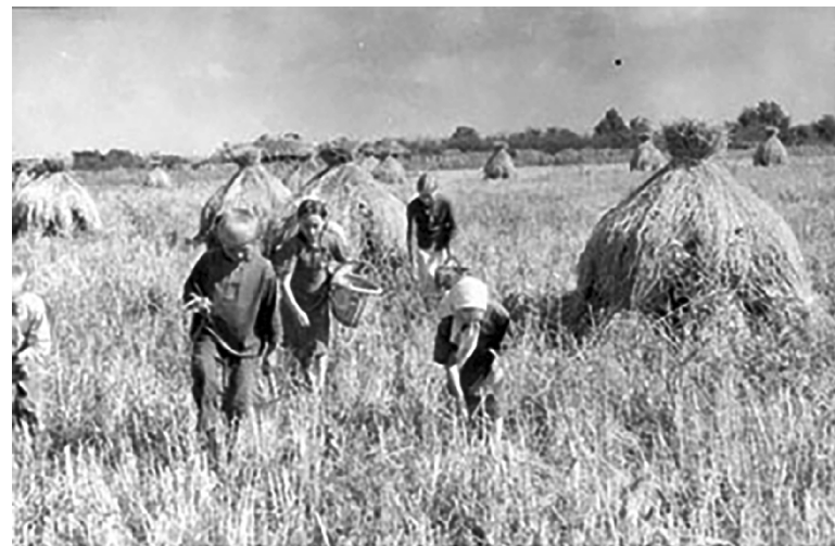
■ Фото времён Великой Отечественной войны

9 мая 1945 года, День Победы. Признаться, этот день не запомнился. Конечно, ко-