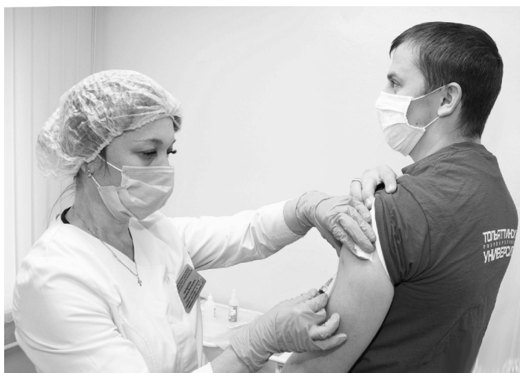
■ Вакцинация — страховка от вируса

«Сам не болей, и других не заражай» – так коротко можно сформулировать посыл прививочной кампании против гриппа, которая традиционно проходит осенью. Для сотрудников опорного Тольяттинского госуниверситета (ТГУ) эта тема актуальна, поскольку они находятся в группе риска.