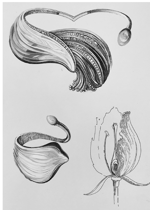
■ Эскиз «Ледяной тюльпан»