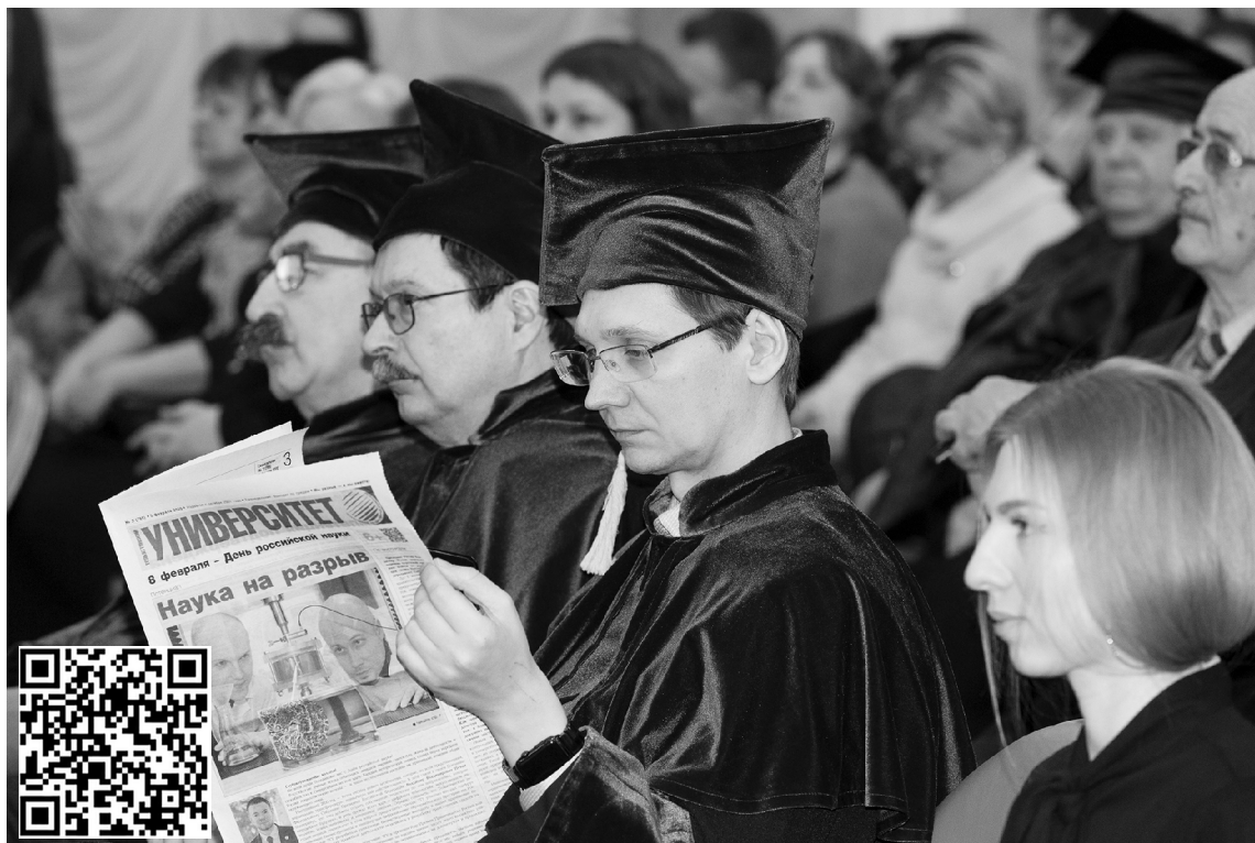
■ 2019 год отмечен ростом грантовой активности учёных ТГУ