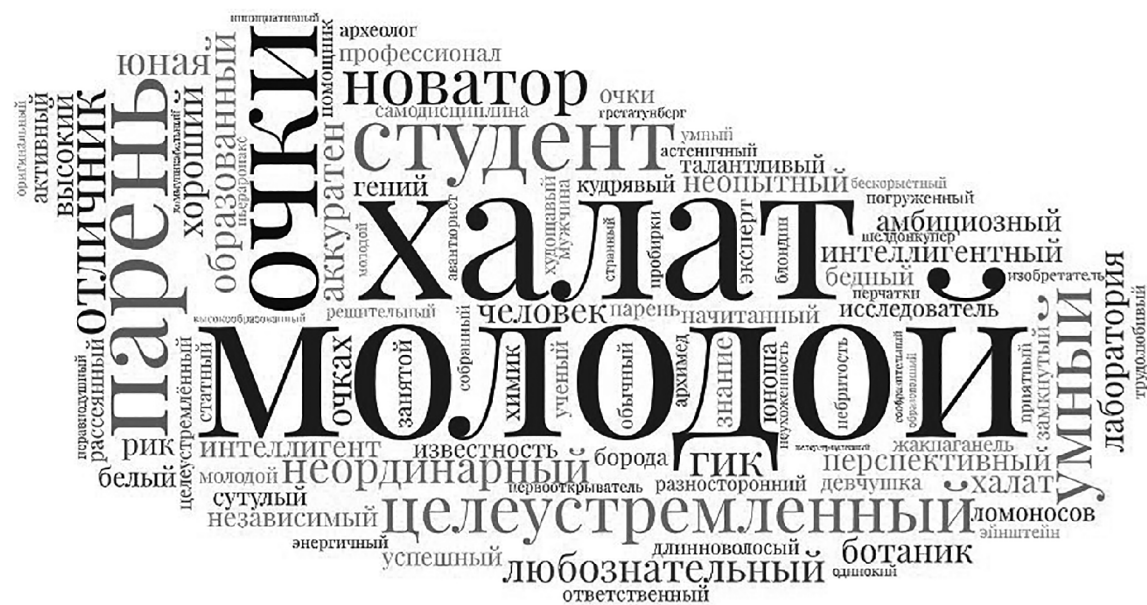
■ Слова, ассоциирующиеся у тольяттинцев с молодым учёным