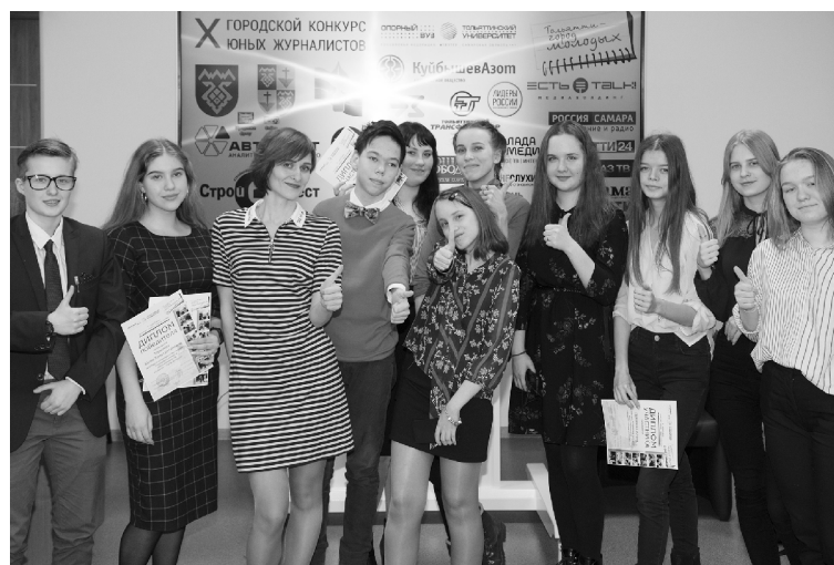
■ Команда победителей — молодые «акулы пера» 2019 года

веке или простом горожанине любого возраста);