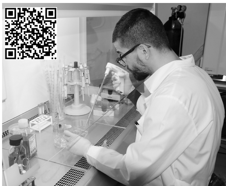
■ «Сердце», созданное учёными ТГУ, укрепило позиции вуза на рынке исследований для фармацевтических компаний

В Центре медицинской химии ТГУ получены собственные клеточные линии стволовых клеток человека, что даёт возможность в неограниченном количестве выращивать необходимые для исследований образцы клеток различных органов. Появление нового инструментария позволяет тольяттинским учёным проводить на полученных в лаборатории клетках сердца, мозга, печени, почек испытания противоопухолевых препаратов. Внимание прежде всего будет уделяться исследованиям на клетках сердца, поскольку одним из наиболее частых побочных эффектов этих препаратов является негативное воздействие на ткани сердца, или кардиотоксичность.