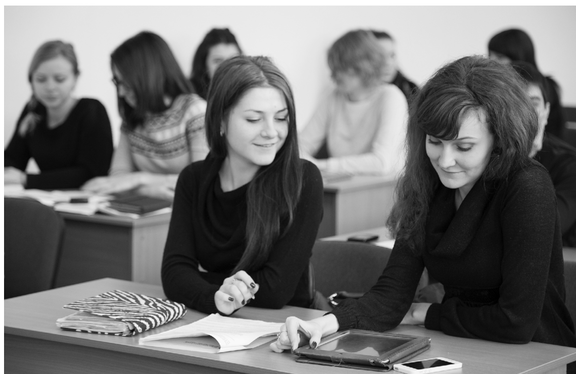
■ Приёмная кампания ТГУ-2020 полностью прошла в режиме онлайн