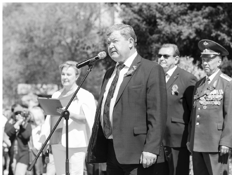
■ Депутат Госдумы РФ Владимир Бокк считает недопустимым переписывание истории

Важность сохранения истории отметила и первый заместитель председателя Самарской губернской думы Екатерина Кузьмичёва , отметив, что День Победы — это главный праздник для нашей страны. По её мнению, время вносит свои коррективы, но оно не должно вносить их в историю. Именно сохранению знаний о подвиге советского народа должна послужить памятная акция «Диктант Победы», состоявшаяся