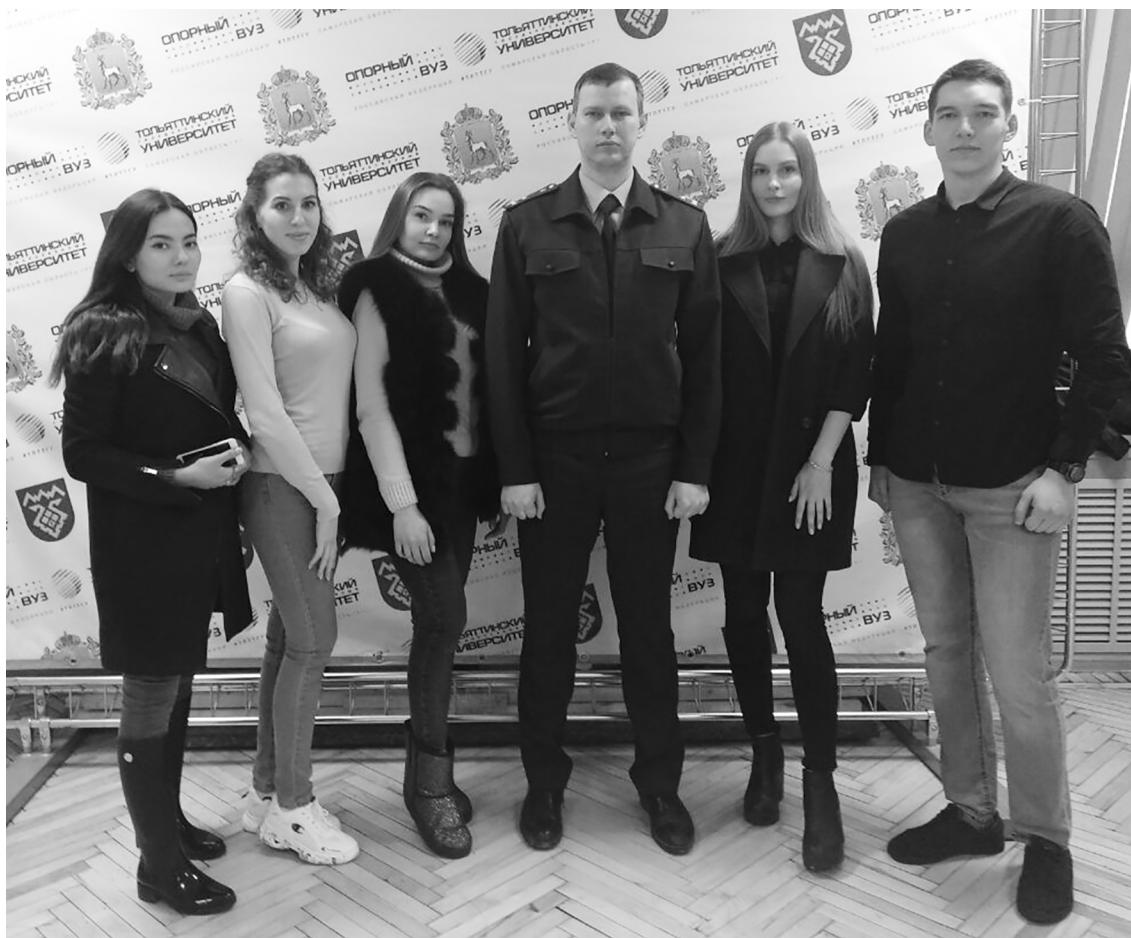
■ Студенты ТГУ на деле узнали специфику будущей профессии

Группа студентов института права Тольяттинского государственного университета (ТГУ) включилась в работу просветительского проекта «Помощник прокурора». По словам участников, это позволило им «проникнуться» спецификой деятельности сотрудников прокуратуры, наладить взаимодействие с будущими коллегами и убедиться, что выбор профессии был верным. Причём студенты ТГУ изучают работу прокуратуры не в кабинетах – они участвуют в различных рейдах, которые проводит прокуратура Тольятти, и выявляют конкретные нарушения законодательства.