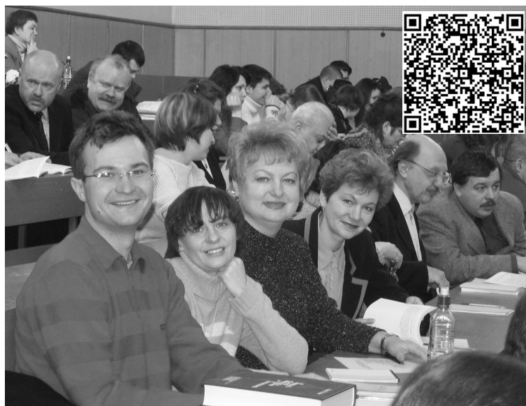
■ С коллегами «по цеху» – преподавателями кафедры журналистики (2002 год)