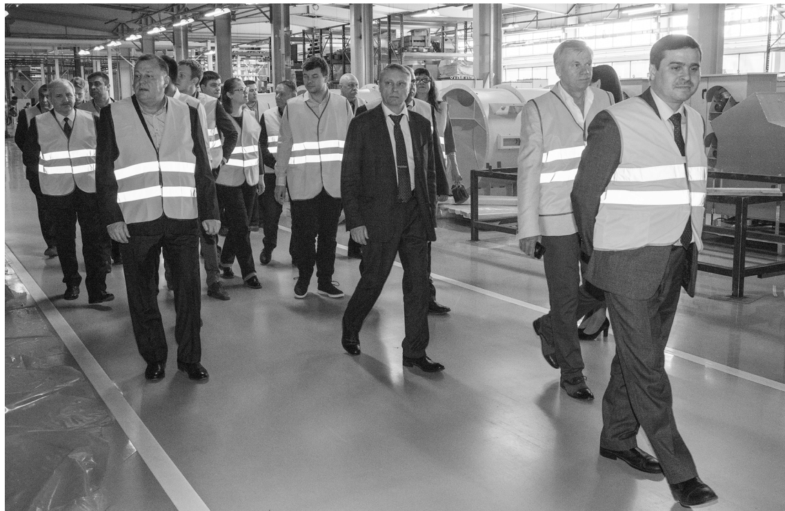
■ Представители НТС «Автомобилестроение» знакомятся с современным оборудованием «ЛАДА-ФЛЕКТ»

Второе заседание научно-технического совета (НТС) «Автомобилестроение» технологической платформы «Лёгкие и надёжные конструкции» состоялось в конце апреля на площадке тольяттинского ЗАО «ЛАДА-ФЛЕКТ». По мнению участников совещания, современные предприятия в своём развитии должны делать акцент на новые IT-технологии.