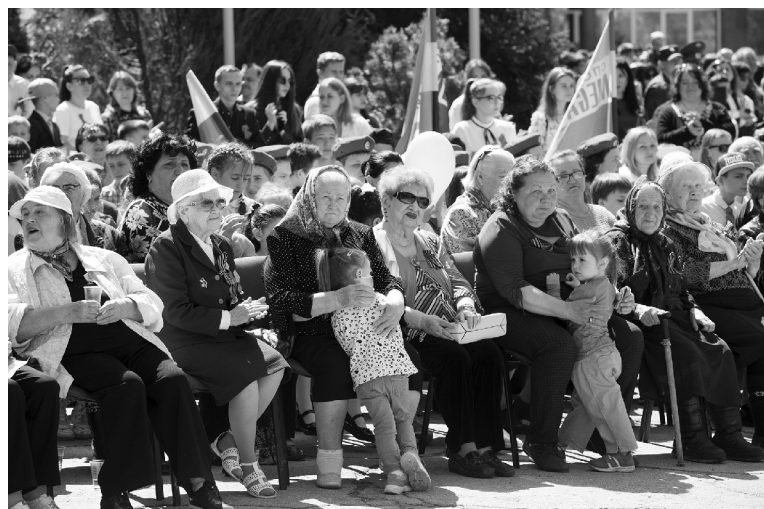
■ Ветераны ВОВ и труженики тыла — в ряду почётных гостей Парада Победы в ТГУ