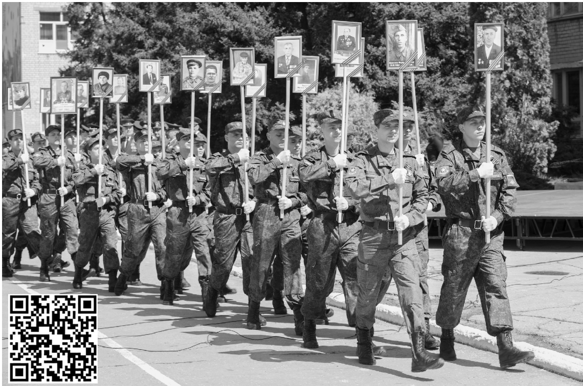
■ «Бессмертный полк» на площади перед главным корпусом ТГУ

Студенты института военного обучения ТГУ 9 мая приняли участие в общегородском торжественном мероприятии, посвященном празднованию 74-ой годовщины Победы советского народа в Великой Отечественной войне, на Площади Свободы.