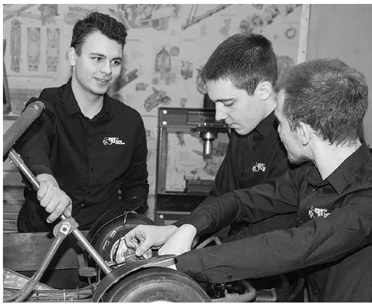
■ Процесс зарядки аккумулятора занимает 15 минут, а полученной энергии хватает на 6-7 заездов

В опорном Тольяттинском государственном университете (ТГУ) разработали уникальный электрокарт с «умным» аккумулятором. Как утверждают разработчики, аккумулятор может заряжаться даже в условиях отрицательных температур, а срок его службы сравним с ресурсом остальных компонентов гоночной машины.