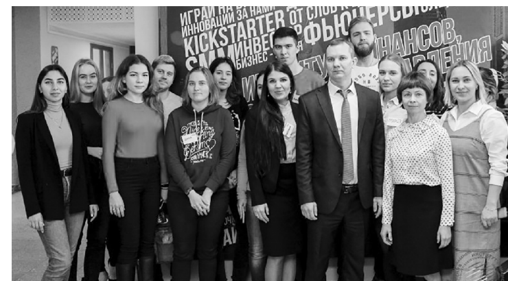
■ Первый набор Банковской школы ВТБ

Преподаватели кафедры рассказали школьникам об основных направлениях проектной деятельности (Студенческое экскурсионное бюро, Знатоки родного края, Инновационное образовательное пространство «Исторический музей»), о приоритетных направлениях работы студенческого научного общества кафедры. Кроме того, 60 одарённых воспитанников школы № 21 были приняты в научное сообщество «Школа юного историка и археолога».