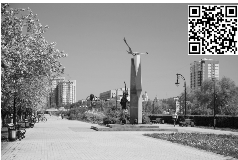
■ Аллея 32-го квартала вновь оживёт

Два проекта Тольяттинского государственного университета (ТГУ) стали победителями XVI Всероссийского конкурса молодёжных авторских проектов и проектов в сфере образования, направленных на социально-экономическое развитие российских территорий, «Моя страна – моя Россия». Всего на конкурс было подано 34 тысячи заявок со всей страны. Проекты ТГУ – единственные среди всех участников – взяли призовые места сразу в двух номинациях. Причём оба проекта уже реализуются.