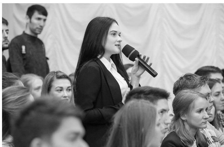
■ Молодые тольяттинцы поинтересовались у главы города, как решить квартирный вопрос и где найти работу