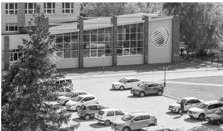
■ В 2001 году в городе появился Тольяттинский государственный университет

Вернувшись в родной город, работал на Павловском автобусном заводе, разработал ряд новых перспективных моделей. В 1967 году его проект ПАЗ 665Т был отмечен призом и Большой серебряной медалью Международного автосалона в Ницце (Франция). Двумя годами позже ПАЗ-Турист-люкс награждён большим кубком, дипломом Президента Франции и занесён в Большую Советскую энциклопедию как образец совершенства в дизайне.