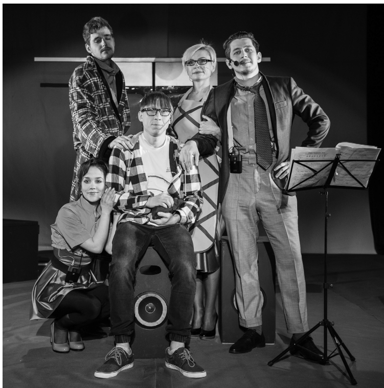
■ Слышать друг друга учат герои новой постановки театра «Дилижанс»