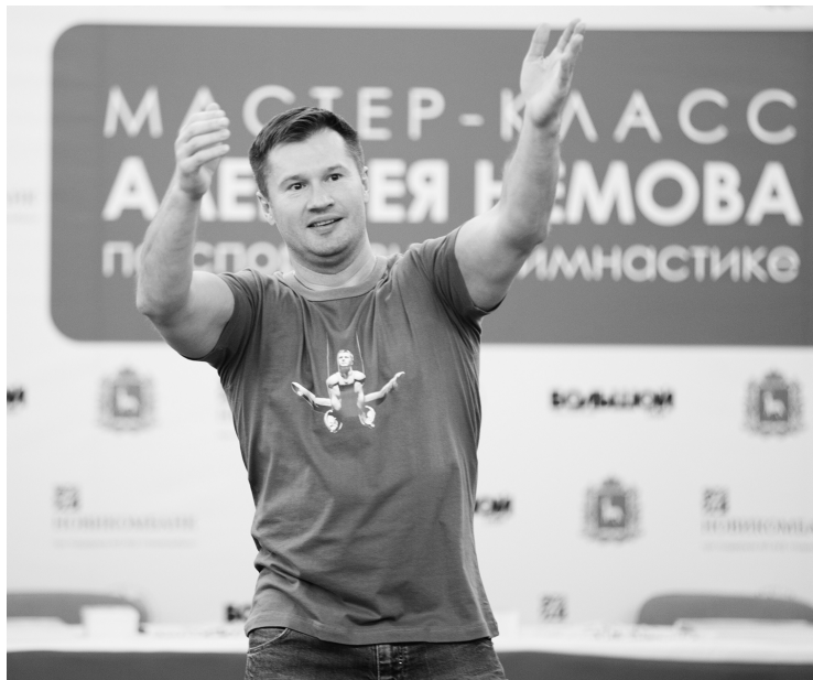
■ Почётный гражданин Тольятти Алексей Немов