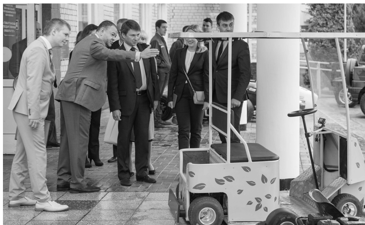
■ Эксперты Роскачества отметили неформальный подход к системе управления ТГУ

ния, в рамках федеральной инновационной площадки реализуется проект «Цифровая транс-