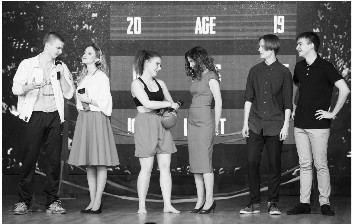
■ В погоне за мечтой...

Г ала-концерт фестиваля «Студенческая весна – 2019» состоялся в Тольяттинском государственном университете (ТГУ) 12 апреля. В этот день в актовом зале университета собрались самые талантливые студенты, чтобы показать всем, какая же она на самом деле – «настоящая Студенческая весна».