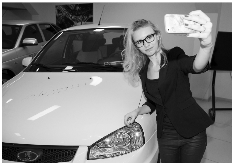
■ Автомобиль с автографом Президента России — в центре внимания

С остоявшийся 21 марта в Тольяттинском государственном университете (ТГУ) День АВТОВАЗа — яркий драйвовый праздник, насыщенный эмоциями и мегапозитивом, — ещё долго будет вспоминаться его участникам. Но кому-то особенно повезло — активные студенты, отличившиеся по итогам дня, получили возможность посетить музей АВТОВАЗа и пройти квест на знание устройства автомобиля и истории автозавода. Затягивать с экскурсией не стали, и уже 11 апреля студенческий десант ТГУ отправился за новыми впечатлениями.