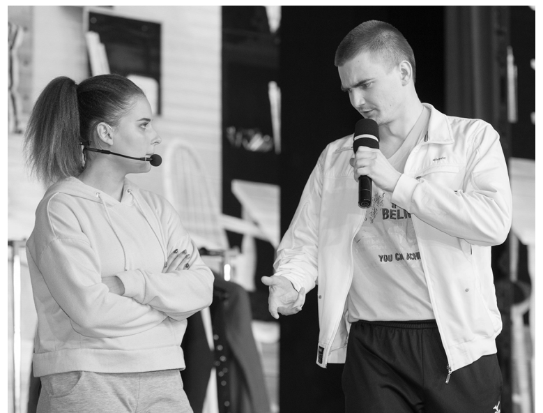
■ ...главное — не потерять себя

— Эти истории сложились у меня в голове на основе моего жизненного опыта и наблюдений за людьми. Получился очень необычный концерт, вмещающий в себя сразу несколько мыслей, которые мы хотели донести до зрителя. Здесь и существование рядом друг с другом двух противоположных характеров, и интерпретация известной фразы «Хочешь рассмешить Бога — расскажи ему о своих планах» в линии со старшей сестрой. Я думаю, каждый зритель смог выделить что-то важ-