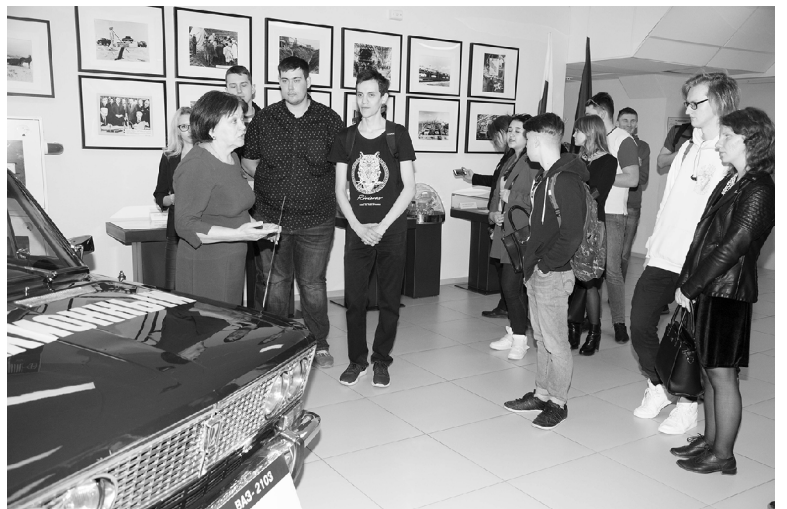
■ Первое знакомство с будущим работодателем состоялось в музее АВТОВАЗа