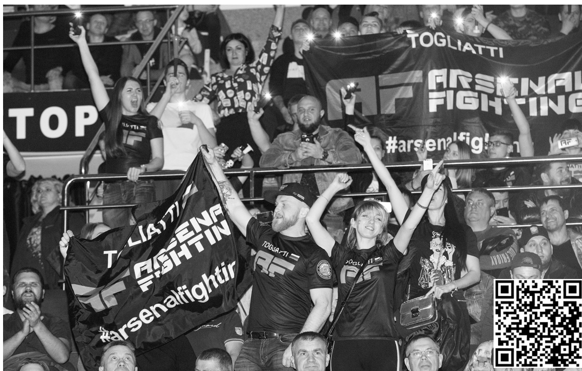
■ Тольяттинские бойцы оправдали надежды болельщиков

– Спорт – это такая вещь, где кто-то выигрывает, кто-то проигрывает. Вот этот вид спорта существует из-за