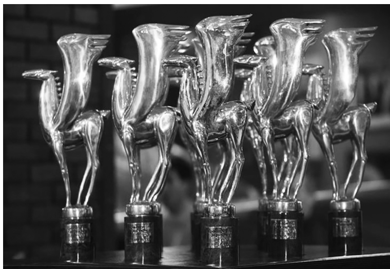
■ «Золотой Пегас» помогает АВТОВАЗу

В номинации «Малый класс» победителей традиционно определяло «народное жюри» – читатели журнала, которые проставляли баллы исходя из трёх критериев: техника, дизайн и практичность. Седан LADA Vesta Cross стал лидером, набрав более 28 тысяч голосов из 35 тысяч проголосовавших.