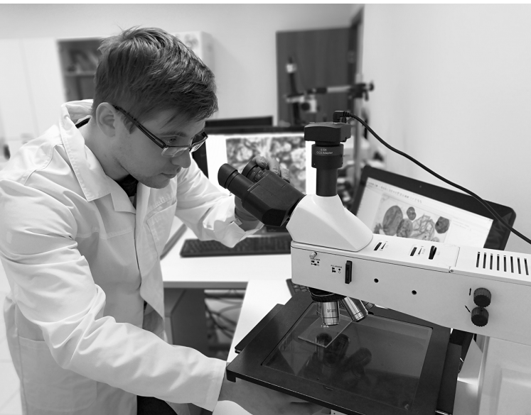
■ НИИПТ ТГУ получил аккредитацию Ростехнадзора на 5 лет

Лаборатории Научно-исследовательского института прогрессивных технологий опорного Тольяттинского государственного университета (ТГУ) прошли повторную аккредитацию в системе Ростехнадзора. Эксперты Федеральной службы по экологическому, технологическому и атомному надзору выдали соответствующее свидетельство.