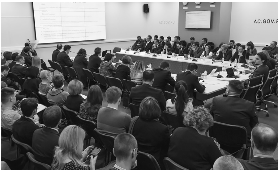
■ Российские университеты активно включаются в нацпроект «Цифровая экономика РФ»

К июлю 2019 года Аналитический центр при Правительстве РФ должен сформировать концепцию модели «Цифрового университета». Её разработка и тиражирование на систему высшего образования укладывается в план мероприятий федерального проекта «Кадры для цифровой экономики» национальной программы «Цифровая экономика РФ». На минувшей неделе Аналитический центр заслушивал лучшие практики цифровой трансформации университетов шести вузов, чей опыт в этом направлении развития представляет наибольший интерес. В том числе опыт самостоятельной цифровой трансформации Тольяттинского госуниверситета.