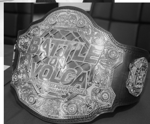
■ Пояс победителя турнира «Битва на Волге»

— Я находился на сборах три с половиной месяца. Сначала тренировался в Да-