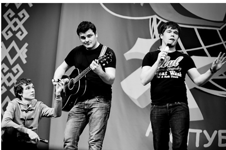
■ Студвесна и КВН – творческий полёт студентов

— Вы обучались на кафедре истории. Сейчас же вы в должности исполнительного директора Молодёжной лиги КВН Тольятти. Как образование помогает в нынешней профессии?