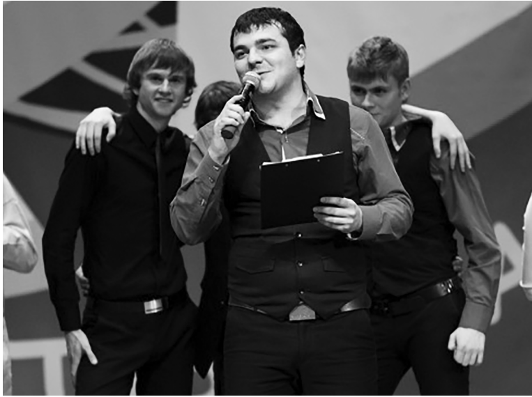
■ Молодёжная лига КВН Тольятти возрождается

— История — это самый широкий профиль. Историк способен быть специалистом во всех областях. Поэтому мне моё образование сильно помогает. Я не самый осведомлённый историк, но порой университетские знания всплывают в самый нужный момент. Преимущество хорошего историка в том, что он научился видеть причинно-следственную связь в событиях. Я вообще за то, чтобы в школе и университете обязательным предметом была «Логика». У очень многих людей хромает ассоциативный ряд, причём и у технарей, и у гуманитариев. Историки же пользуются этими знаниями сразу после получения диплома.