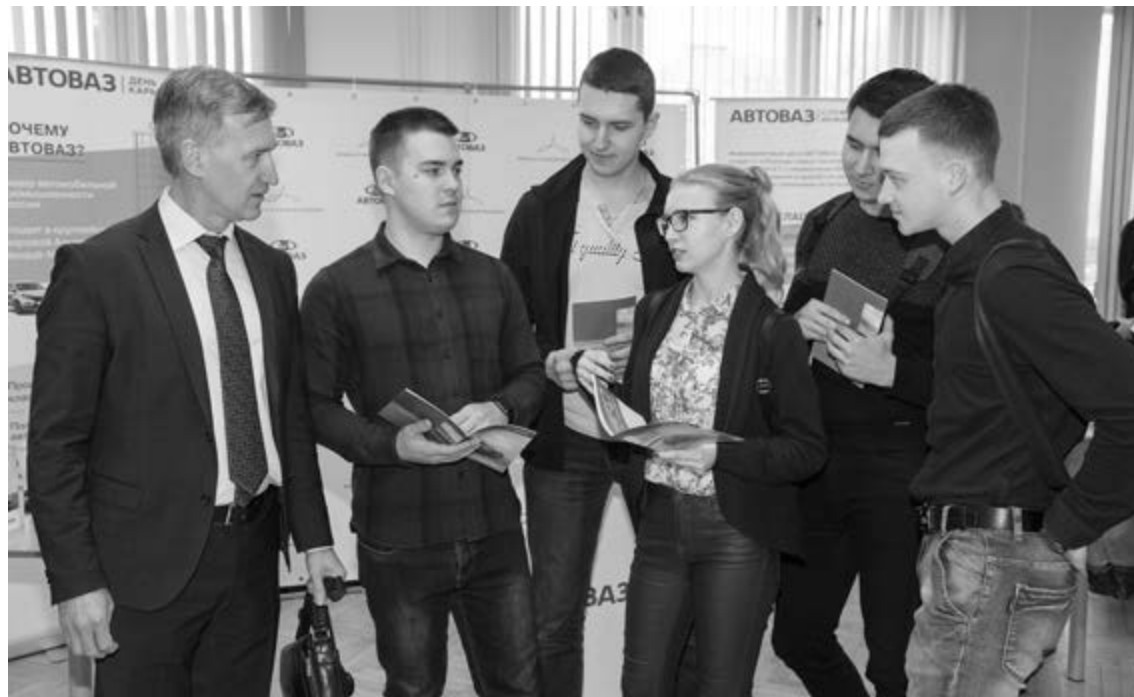
■ «День АВТОВАЗа» в ТГУ помог студентам по-новому взглянуть на автогиганта и задуматься о предприятии как о возможном месте работы

— Нам нужны специалисты самых разных категорий, но если говорить про инжиниринг, то это прежде всего