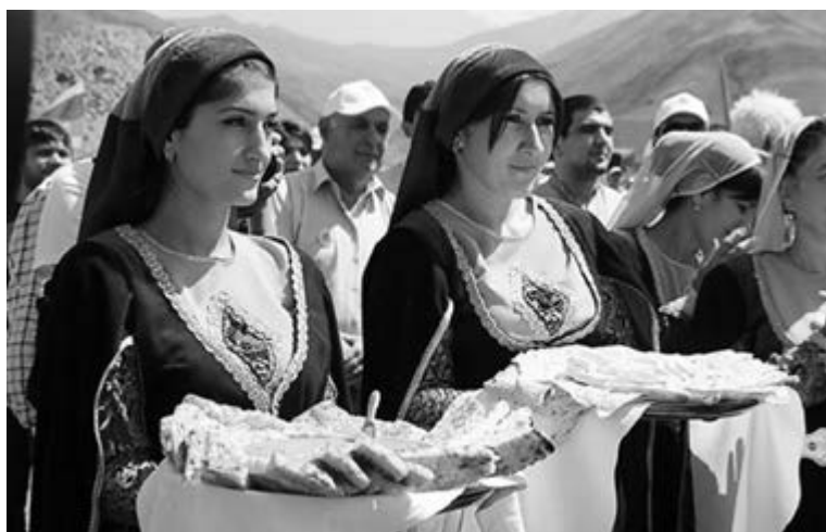
■ Гостеприимство и богатый стол — главная особенность азербайджанского дома