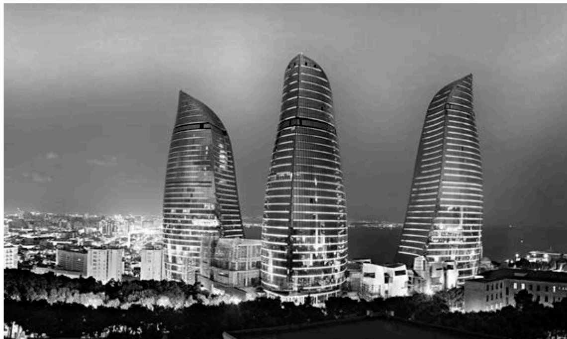
■ «Пылающие башни» Баку запоминаются надолго

— У нас много праздничных традиций. Например, во время Новруза всегда готовят много еды и угощают всех гостей. Новрузу предшествуют 4 вторника: «вторник на воде», «вторник на огне», «вторник на земле» и последний вторник (или «вторник воздуха»). В каждый из этих дней азербайджанцы собираются, разводят большой костёр и прыгают через него. Считается, что так в огне