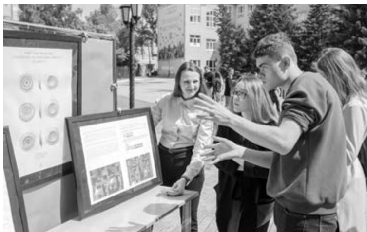
■ Студенческие проекты «вышли» в город

В Тольяттинском государственном университете (ТГУ) прошли первые в весеннем семестре занятия по проектной деятельности студентов с участием приглашённых к сотрудничеству работодателей. 114 проектов студентов 1-го и 2-го курсов направлены на решение корпоративных и общегородских вопросов, улучшение жизни горожан и помощь нуждающимся. А сами ребята учатся работать с кейсами, укладываться в дедлайны и завязывать деловые связи с бизнес-сообществом.