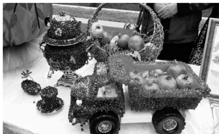
■ В честь граната в Азербайджане проводят праздники