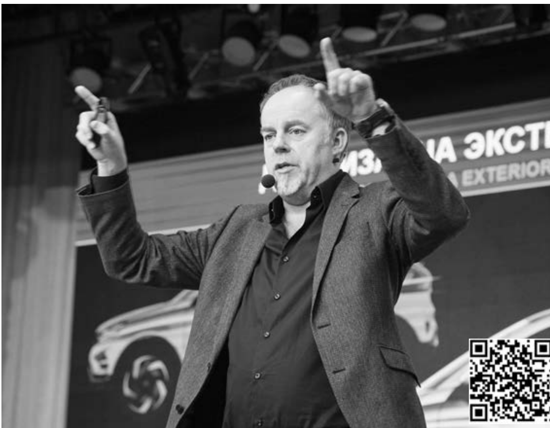
■ Стив Маттин: «LADA стала возможностью бросить вызов...»

Ш еф-дизайнер LADA Стив Маттин считает, что российские автомобили должны олицетворять российский колорит. Об этом он сказал на своей лекции в рамках профориентационного мероприятия для абитуриентов и студентов «День АВТОВАЗа», которое состоялось 21 марта в опорном Тольяттинском государственном университете (ТГУ).