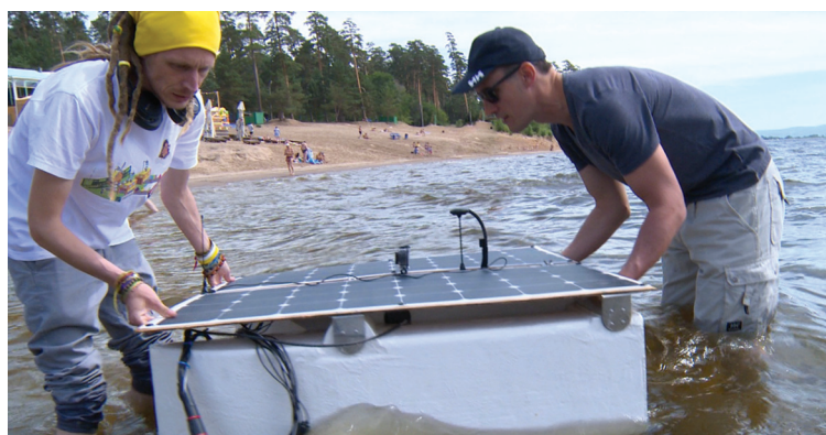
■ Разработка студентов ТГУ и компании «АИРАЛАБ Рус» готова к исследованиям