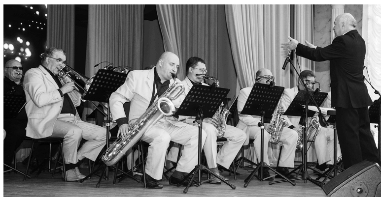
■ Джазовый оркестр Тольяттинской филармонии создавал праздничное настроение