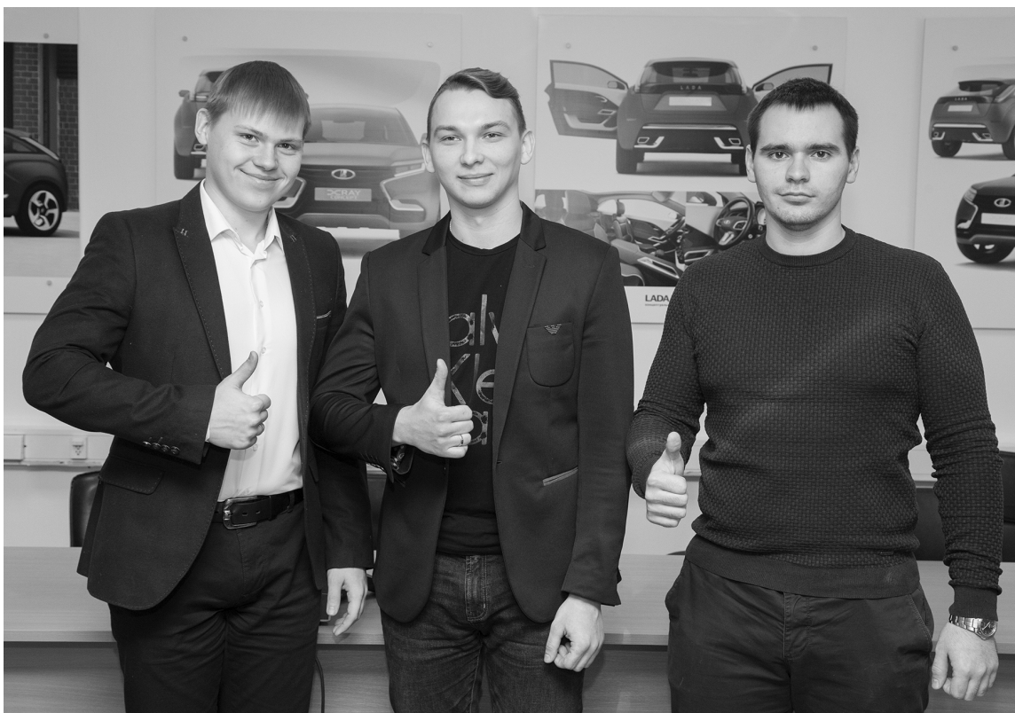
■ С ТГУ я всё смогу!

Уверенность в завтрашнем дне дорогого стоит. Тольяттинский государственный университет (ТГУ) гарантирует своим студентам светлое профессиональное будущее. Это стало возможным благодаря договорённости ТГУ с АВТОВАЗом. Программа целевого обучения специалистов для службы исполнительного вице-президента по инжинирингу направлена на усиление кадрового потенциала автопредприятия, а также на повышение уровня подготовки специалистов автомобильного профиля и престижа специальностей автопрома.