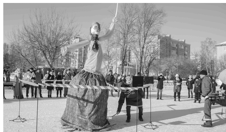
■ Чучело, гори! Сессия, прощай!

Татьянин день в университете вновь получился ярким, шумным, запоминающимся, подарившим всем заряд от-