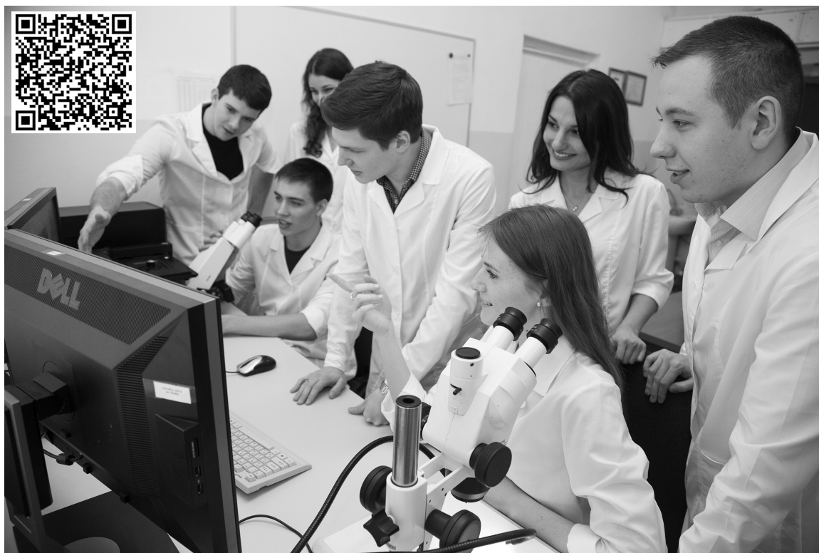
■ ТГУ финансирует проекты студентов

35 тысяч рублей могут получить студенты опорного Тольяттинского государственного университета (ТГУ) на доработку своих научных проектов. Приём конкурсных заявок стартует 4 февраля.