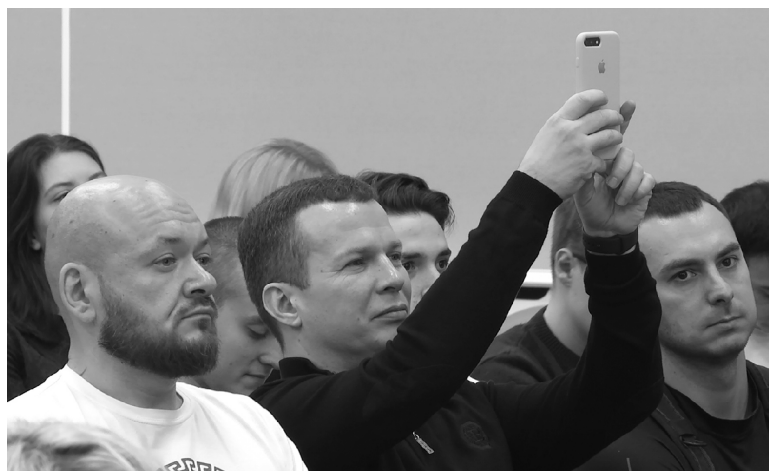
■ Тольяттинские спортсмены делятся со своими подписчиками в соцсетях лучшими моментами

Принять участие в дискуссии смогли все желающие, пришедшие в актовый зал ТГУ. И по ходу общения спикерам поступали не только вопросы, но и благодарности за возможность пообщаться лично. В завершение дискуссии каждый желающий смог сделать фото на память.