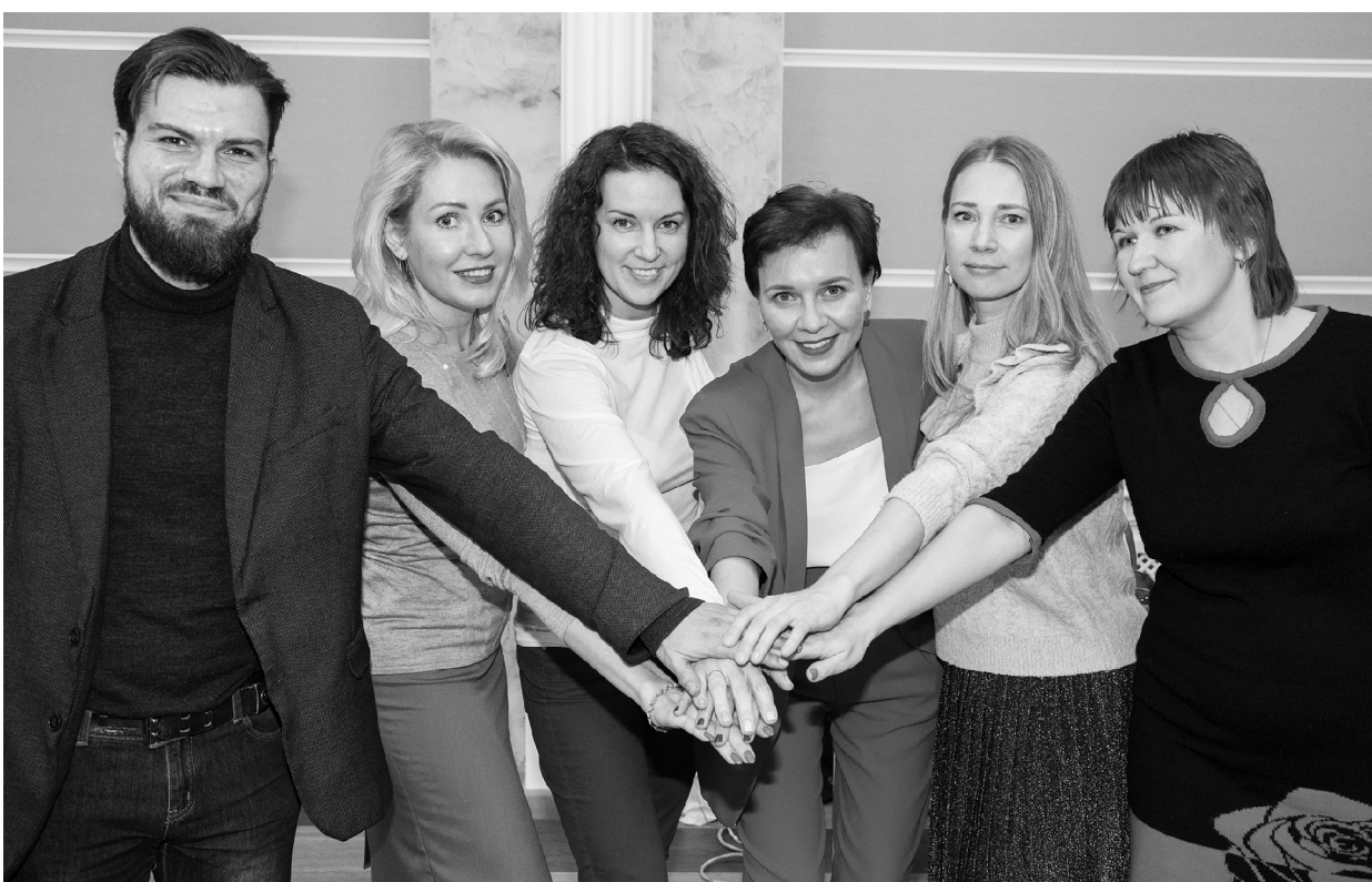
■ Первый выпуск кафедры журналистики ТГУ 2004 года

2 ноября кафедра журналистики опорного Тольяттинского госуниверситета отметила 20-летие.