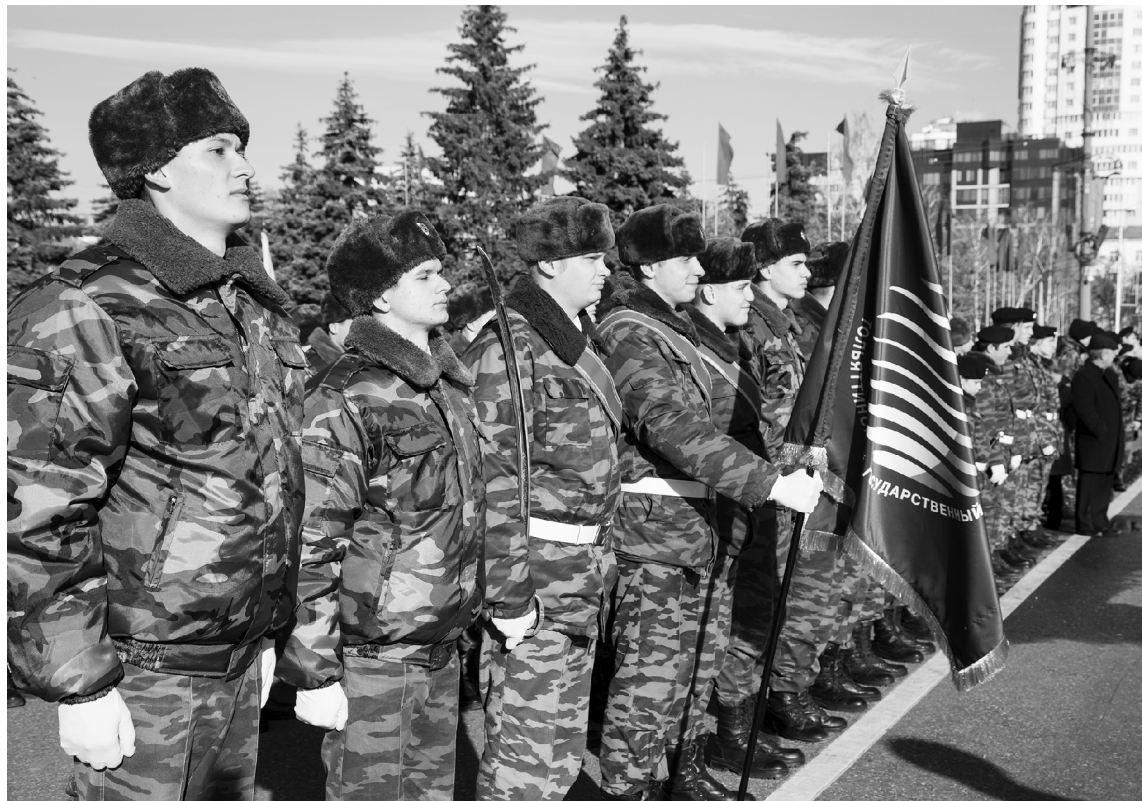
■ Приглашение на Парад Памяти – важный показатель доверия к опорному ТГУ

Парад Памяти 2019 года начнётся с легендарного голо-