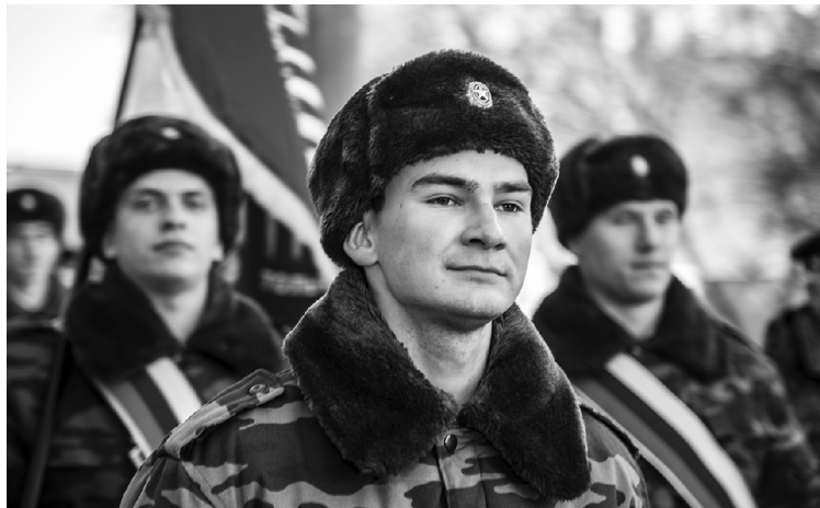
■ Попад на Парад однажды, курсанты стремятся вновь пережить яркие эмоции

Среди гостей Парада – представители разных регионов Российской Федерации, ближнего и дальнего зарубежья, Герои Советского Союза и Российской Федерации со всей страны, извест-