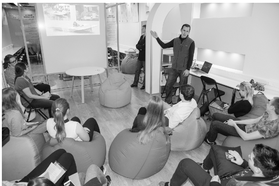
■ На Startup Weekend TLT молодые предприниматели узнали о том, какие стартапы обречены на успех

Девять студентов опорного Тольяттинского государственного университета (ТГУ) стали финалистами регионального этапа конкурса «УМНИК». Они представят свои проекты экспертному жюри в декабре 2019 года – на финальном отборочном мероприятии по программе «УМНИК» в Самарской области, которое состоится в технопарке «Жигулёвская долина».