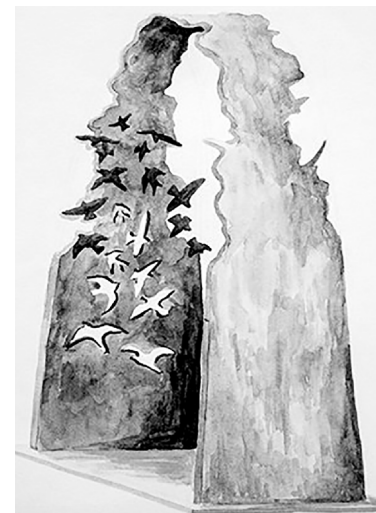
■ Памятный знак погибшим 31 октября 2007 года

и памятный знак погибшим при взрыве автобуса в Тольятти 31 октября 2007 года. Сбор благотворительных средств на создание мемориала продолжается. Построенный на собранные всем миром средства мемориальный комплекс станет центром притяжения жителей Тольятти вне зависимости от их возраста, конфессии, национальной принадлежности и мировоззрения.