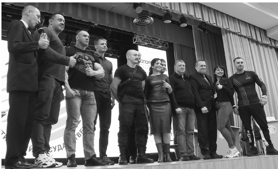
■ О своей активности в соцсетях рассказали именитые российские спортсмены

Р оли публичности и социальных сетей в развитии массового спорта был посвящён круглый стол, организованный в опорном Тольяттинском государственном университете (ТГУ) в День народного единства 4 ноября. Традиционно именно так — дискуссией звёзд мирового спорта, лидеров спортивных школ и федераций, при участии властей и жителей города — завершается Спартакиада боевых искусств «Непобедимая держава».