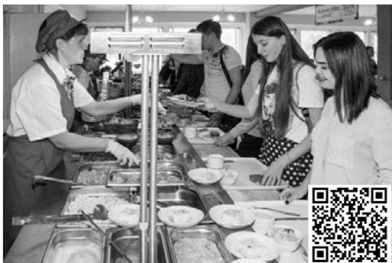
■ Новая столовая — новые настроения

В ТГУ торговая сеть «Городская столовая 51» будет работать под брендом кафе «В обед» — такая вывеска уже появилась на двухэтажном здании столовой ТГУ на улице Белорусской. Внутренние помещения заметно преобразились после ремонта: линии раздачи блюд остались лишь