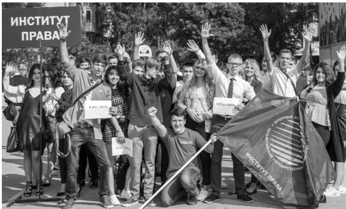
■ Из «школяров» — в студенты опорного вуза

3 сентября 2018 года на площади перед главным корпусом опорного Тольяттинского государственного университета (ТГУ) состоялась традиционная торжественная церемония в честь Дня знаний и начала нового учебного года. Хорошей традицией стало поздравление университета не только от имени первых лиц города и региона, но и от градообразующих предприятий, которые, в том числе, помогают в обеспечении практикоориентированного обучения студентов. Так, к началу учебного года в лабораториях института химии и инженерной экологии ТГУ появится новое оборудование, подаренное ПАО «Тольяттиазот».