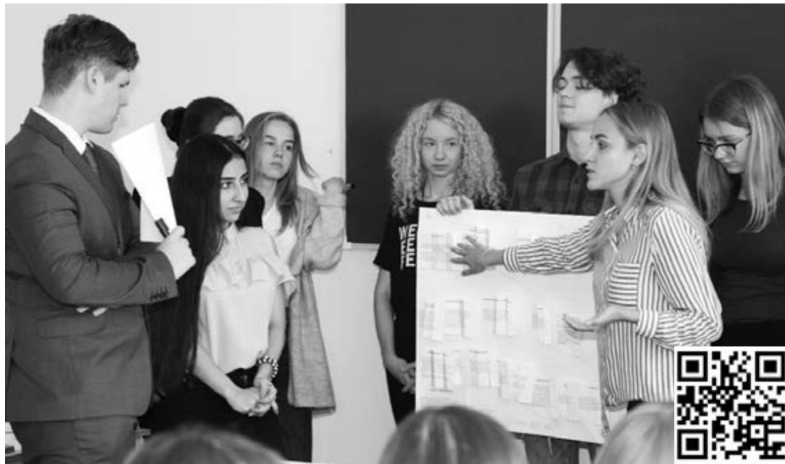
■ Первокурсники ТГУ — генераторы идей

Эту фразу 4 сентября услышали почти 1000 студентов-первокурсников Тольяттинского государственного университета, обучающихся по очной форме на бакалавриате и специалитете. Для них она означает старт полноценного погружения в проектную деятельность.