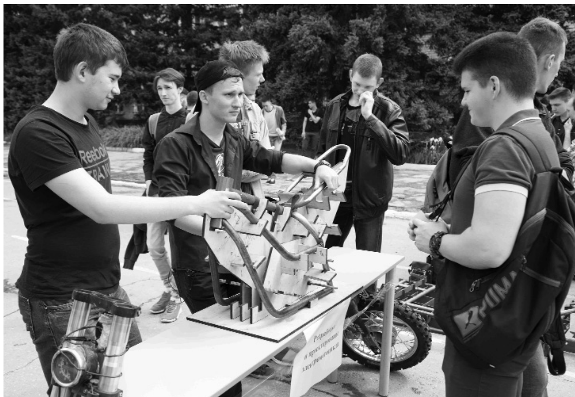
■ На «Ярмарке проектов» перспективность идей оценивали сами студенты

Для оценки проектов своих соперников студенты перевоплотились в «продавцов» и «покупателей» идей. Вместо