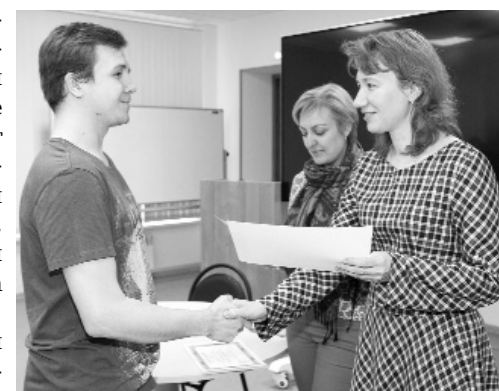
■ «Студенческие дни науки» определили 48 победителей