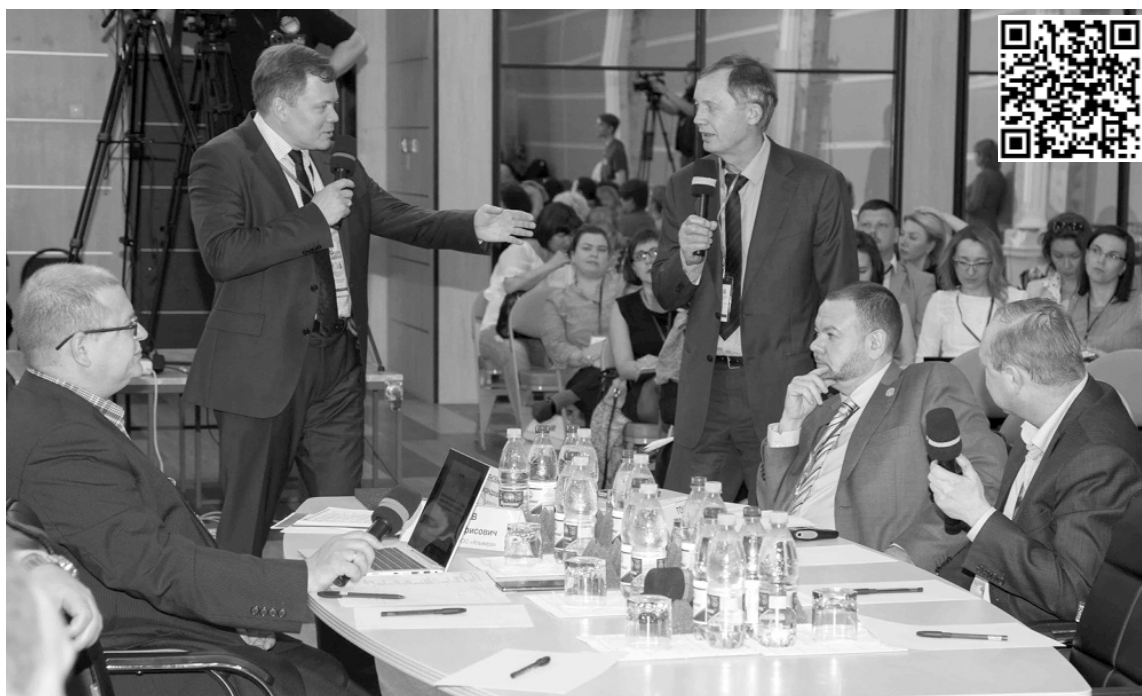
■ Эксперты сетевого совещания в ТГУ уверены: опорные вузы должны стать основной движущей силой в инновационном и технологическом развитии своих регионов

В сероссийское совещание «Опорные университеты как точки пересечения вертикальных и горизонтальных связей внутринациональной системы развития регионов» проходило 4-5 июня в Тольяттинском государственном университете (ТГУ). Выстраивать диалог между вузами, властью и бизнесом — такова, по мнению участников совещания, одна из основных задач, стоящих сегодня перед высшей школой. В этих условиях опорные вузы должны не конкурировать, а искать пути взаимодействия, интегрировать компетенции для выполнения заказов со стороны своих партнёров.