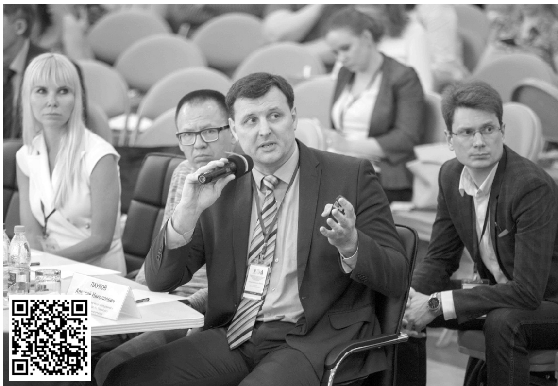
■ Амбициозность и инновационность Программ развития опорных университетов — ключевые критерии при оценке эффективности их деятельности

Общая схема трансформации ТГУ — это комплекс четырёх взаимосвязанных инициатив, обеспечивающих для каждого уровня свою инфраструктуру, кадровое обеспечение и систему управления. И на каждом уровне реализуются проектная деятельность и подготовка кадров. Причём система в целом обеспечивает отбор