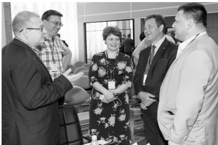
■ Конструктивный диалог между представителями опорных вузов России начался уже на площадке ТГУ

Программа развития ТГУ как опорного вуза изначально разрабатывалась с учётом «Стратегии социально-экономического развития Самарской области на период до 2030 года». Затем Программа развития вуза стала основой для Программы трансформации ТГУ в Центр инновационного и технологического развития Самарской области, разработка которой велась в рамках реализации федерального приоритетного проекта «Вузы как центры пространства создания инноваций».