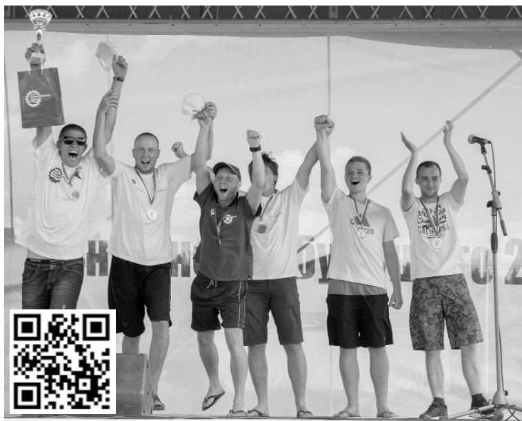
■ Инженеры будущего встретятся в Ульяновской области

Т ольяттинский госуниверситет стал официальным партнёром VII Международного молодёжного промышленного форума «Инженеры будущего — 2018», который пройдёт с 10 по 21 июля в Ульяновской области. Кроме того, молодёжный медиахолдинг ТГУ «Есть talk» выступит главным информационным партнёром на площадке проведения мероприятия, обеспечивая его медиасопровождение.