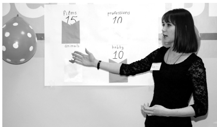
■ В антикафе учат английский в неформальной обстановке

«Грин-холл» к моему приходу преобразился: стулья и парты, органично расположенные по углам, превратились в игровые станции. «Заведение», разумеется, несолидного размаха, но по-студенчески уютное. Причём гостям сразу же показали, где при желании можно попить чаю. Как же студенческое кафе