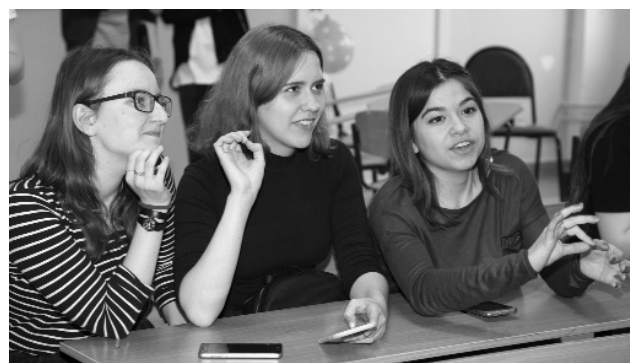
■ Знаешь ответ? Главное — произношение...

может обходиться без плюшек, печенья и сладостей?! Открытие ENGLISH TIME прошло без официальных церемоний и длинных речей. Ведущие разделили гостей на две команды.