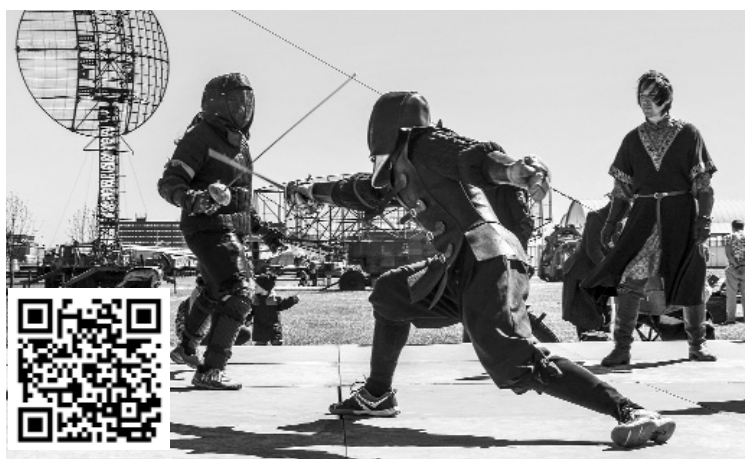
■ Успех в поединке зависит от знаний

— Требования к снаряжению жёсткие. Мы не покупаем кустарщину. Оружие и защита должны быть изготовлен-