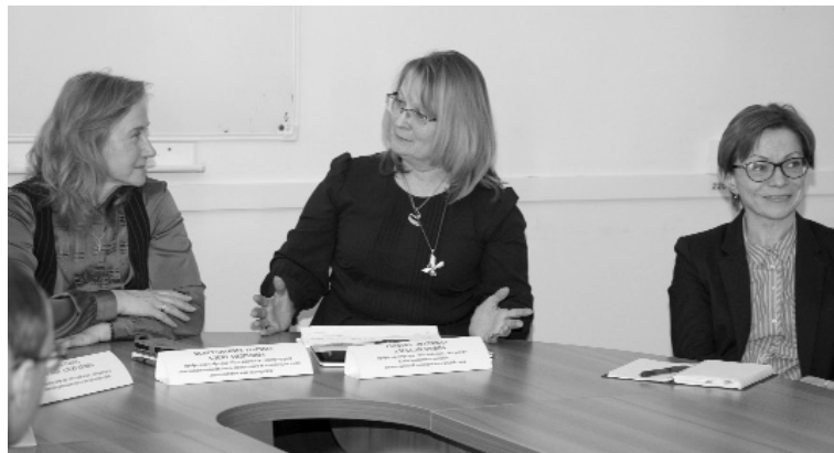
■ Споры экспертов: манипуляция или воздействие?

В ходе дискуссии все участники и эксперты круглого стола сошлись во мнении, что в ходе манипуляции на человека воздействуют скрыто и против его воли. А вот под воздействием следует понимать использование определённых приёмов, вызывающих необходимую реакцию. Однако это не означает, что воздействие будет направлено против воли человека.