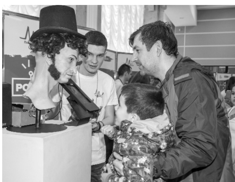
■ Поэзия от электронного Пушкина

В рамках выставки работали несколько мастер-классов для школьников: по 3D-моделированию и сборке простых роботов из специального робо-