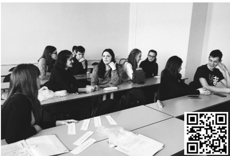
■ Лайфхак от участников проекта «Учу сам — учу других»: выучить английский язык проще всего с соседом по парте

С сентября 2017 года все первокурсники Тольяттинского государственного университета — 1097 человек — погружены в проектную деятельность. На данный момент самые успешные и перспективные проектные работы, которые реализуются студентами с первого семестра, — в стадии «боевой готовности». Ребята корректируют их, чтобы представить свои работы жюри по окончании семестра на «Ярмарке проектов», а в дальнейшем, возможно, и успешно продать свою идею или создать собственный бизнес.