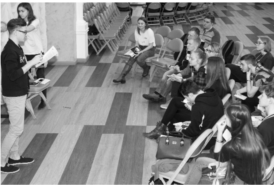
Лидеров студенческого самоуправления научили управлять коллективом

В Тольяттинском государственном университете (ТГУ) 5 апреля состоялись первые занятия «Школы старост ТГУ». Старосты групп всех институтов опорного вуза прошли интенсивную образовательную программу. Организаторами мероприятия выступили Тольяттинский госуниверситет, Профком студентов и аспирантов ТГУ, а также Совет старост ТГУ.