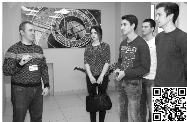
■ Студентам ТГУ рассказали, как в Сбербанке снимают нервное напряжение