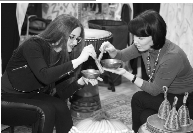
■ Звуки лечат и успокаивают душу

Между ритмом движения и ритмом внутренних органов также существует определённая связь. Используя музыку как ритмический раздражитель, можно достигнуть гармонизации ритмических процессов организма в большей компактности и экономичности энергетических затрат.