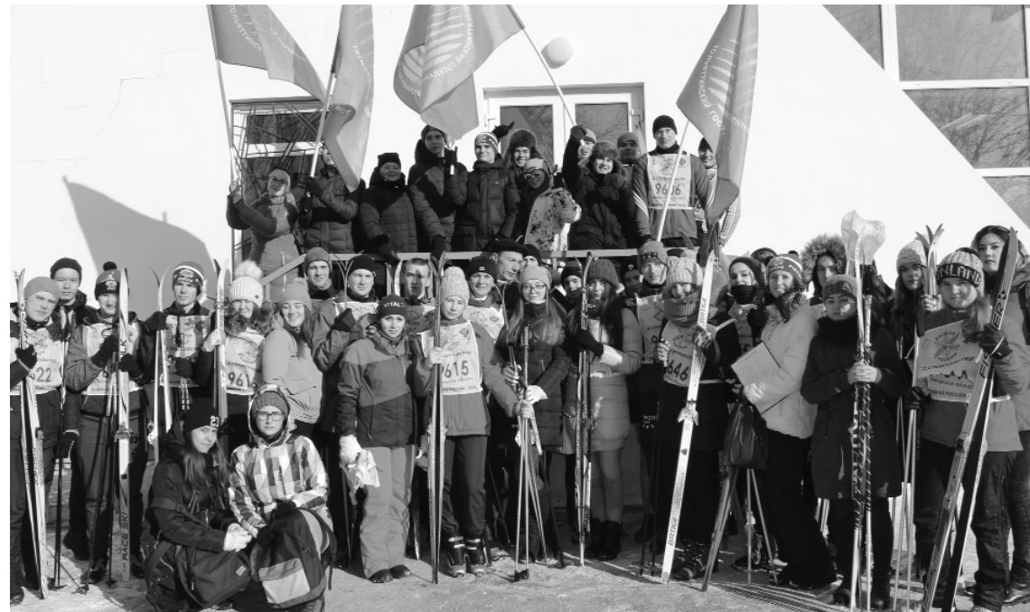
■ Команда ТГУ была самой многочисленной

11 февраля в Тольятти прошёл общегородской день здоровья «Лыжня России — 2018». В нём приняли участие сотрудники предприятий и организаций города, студенты и школьники — всего около 7000 тольяттинцев. Тольяттинский государственный университет (ТГУ) представляли 68 студентов.