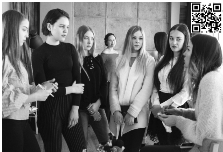
■ Мастер-класс в «Ж STUDIO»