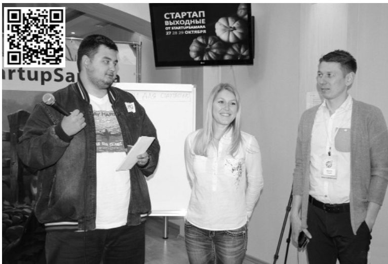
■ Студенты ТГУ получили 2,5 млн рублей на реализацию своих инновационных проектов

В опорном Тольяттинском государственном университете (ТГУ) уже никого не удивить победами студентов в региональном этапе научно-инновационного конкурса УМНИК (Участник молодёжного научно-инновационного конкурса), организованного Фондом содействия развития малых форм предприятий в научно-технической сфере. А вот УМНИК в рамках НТИ — это что-то новенькое. Но студенты опорного вуза региона привыкли быть первооткрывателями: в числе первых приняли участие в новом конкурсе. И не прогадали: поддержано пять проектов, а сумма общего финансирования увеличилась до 2 500 000 рублей.