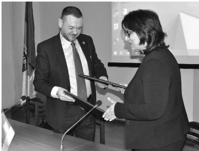
■ Обмен договорами о совместной деятельности прошел под аплодисменты участников расширенного заседания учёного совета Ереванского университета им. Брюсова

Уже на следующий день в Министерстве образования и науки Республики Армения