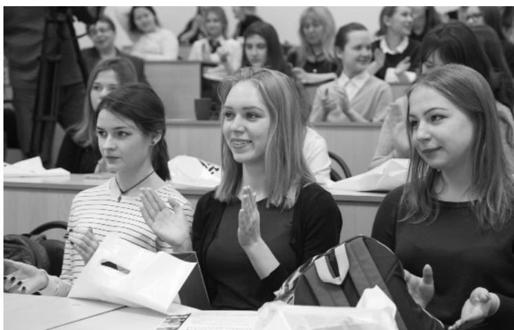
■ Есть шанс — дерзайте!

Первичная журналистская организация опорного Тольяттинского государственного университета при Самарской областной организации Союза журналистов России и Центр гуманитарных технологий и медиакоммуникаций ТГУ, в который входит кафедра «Журналистика», приглашает молодых авторов в возрасте от 15 лет до 21 года к участию в IX городском конкурсе юных журналистов «Тольятти — город молодых». В этом году конкурсантов ожидают дополнительные номинации и специальные призы от партнёров.