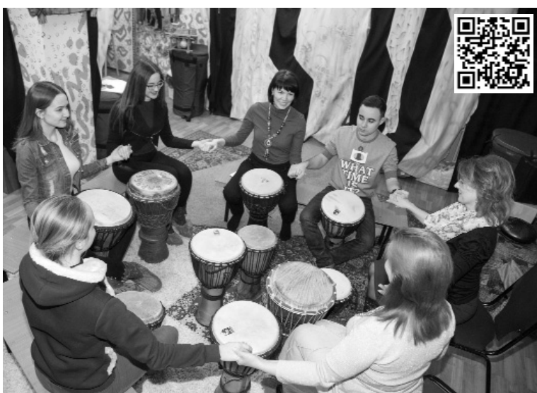
■ Мы — одна команда!

С древности известно о магической силе музыки. Она может активизировать человека, заставить смеяться или, наоборот, грустить. Но музыка ещё и мощное лечебное средство, способное глубоко воздействовать на физическое и психическое состояние человека. И доказать это взялись участники опытно-экспериментального, обучающего проекта «Активная музыкотерапия с использованием барабанов мира», который реализуется в Тольяттинском государственном университете с ноября 2017 года на кафедре теоретической и прикладной психологии.