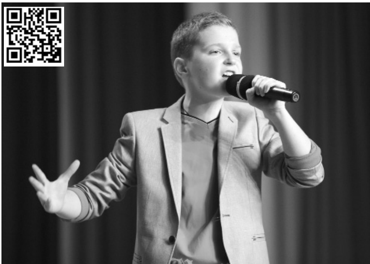
■ Юный Карузо? Кто знает...

17 февраля в Тольяттинском государственном университете (ТГУ) прошёл гала-концерт II межрегионального конкурса-фестиваля вокального искусства «Чистый звук». Вокалисты в возрасте от 4-х до 60 лет и творческие коллективы из Самары, Жигулёвска, Отрадного, Кинель-Черкассов и Казани приехали в Тольятти, чтобы открыть свои сердца музыке.