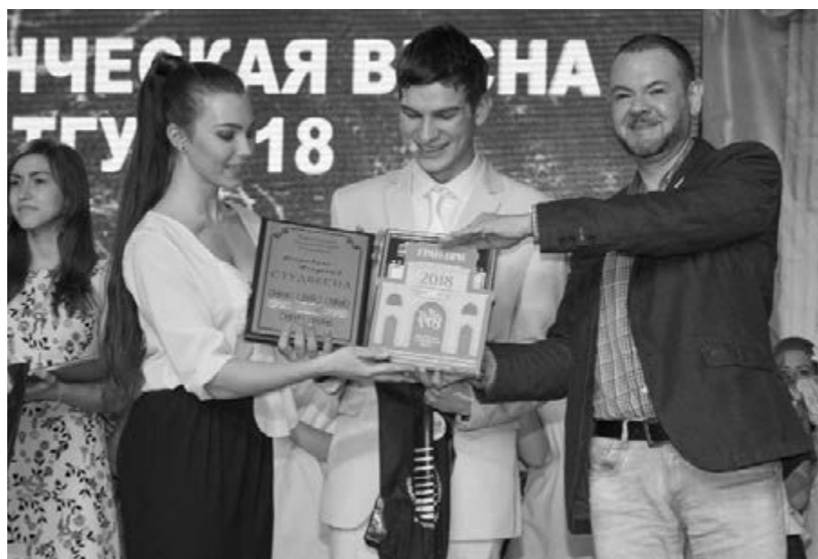
■ Гуманитарный ТГУ — чемпионы «Студвесны-2018»