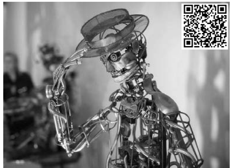
■ Робогостей ТГУ отличают вежливость и дружелюбие

мед. — Мы надеемся, что тольяттинские ребята, вдохновившись современными технологиями, захотят создать собственных роботов и примут участие во всероссийском конкурсе «Робостанция» на сайте проекта «Поколение М». Кстати, больше трети работ, выложенных на данный момент в номинации «Робостанция», созданы ребятами из Самарской области, так что в ближайшие годы наша губерния может прославиться не только благодаря космической промышленности и производству автомобилей, но и благодаря молодым