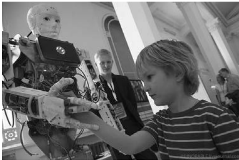
■ Первое знакомство с искусственным разумом

18 и 19 апреля в Тольяттинском государственном университете (ТГУ) пройдёт бесплатная двухдневная выставка робототехники «Робостанция МТС». Мероприятие проводится в опорном вузе в рамках Дня открытых дверей — Welcome Day. Организаторы — всероссийский благотворительный проект «Поколение М» и центр маркетинга ТГУ.