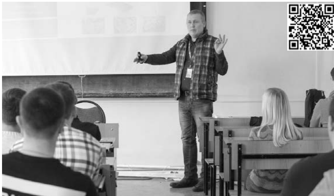
■ Сотрудники АВТОВАЗа «вербуют» студентов ТГУ с 3-го курса

75 выпускников Тольяттинского госуниверситета (ТГУ) в 2019 году могут стать сотрудниками инжинирингового центра ПАО «АВТОВАЗ». Такая возможность предусмотрена в рамках договора о целевой подготовке студентов, подписанного между ТГУ и АВТОВАЗом в июле 2017 года. Уже сейчас студенты, обучающиеся на инженерных направлениях, могут заявить о своём желании работать на автопредприятии.