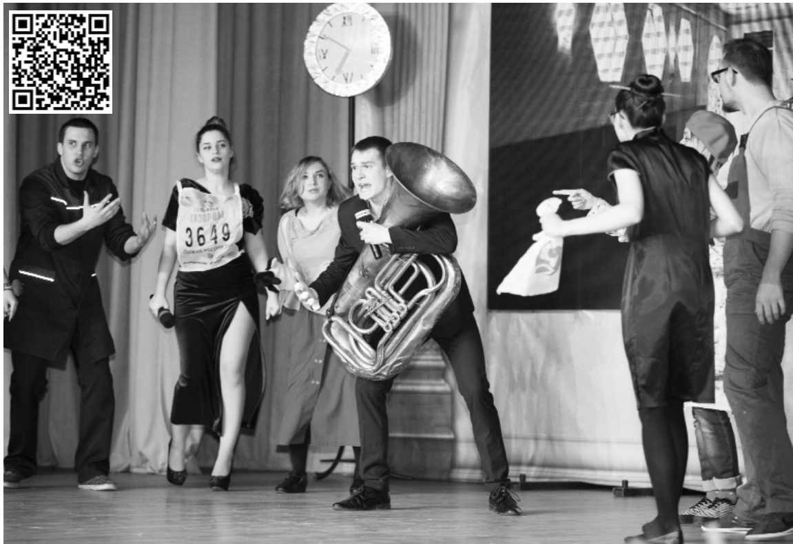
■ Студенты устроили «Образцовый переполох» на сцене опорного ТГУ

1 апреля, в День смеха, природа шутила — Тольятти утопал в сугробах. Студенты Тольяттинского государственного опорного университета (ТГУ) — участники гала-концерта фестиваля студенческого творчества «Студенческая весна — 2018» — напротив, были серьёзными, им было не до смеха. Ребята стремились показать всем зрителям гала-концерта и членам городского и областного жюри фестиваля, что в опорном ТГУ учатся по-настоящему творческие, оригинальные и воодушевлённые «Студвесной» люди. Цель достигнута: областное жюри присвоило двум творческим коллективам ТГУ звание лауреатов, а в Тольятти началась весна.