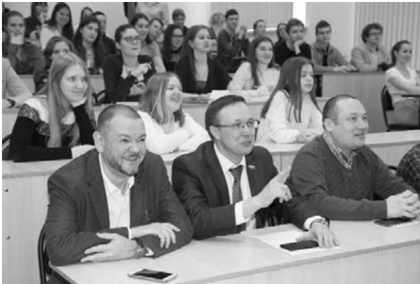
■ Почётные гости конкурса

15 марта в опорном Тольяттинском государственном университете (ТГУ) состоялось награждение участников и победителей IX городского конкурса юных журналистов «Тольятти — город молодых». Ежегодно конкурс открывает новые имена перспективных школьников и студентов, увлечённых журналистикой. Как правило, в будущем они выбирают журналистику как специальность и университет для получения высшего образования в этой области.