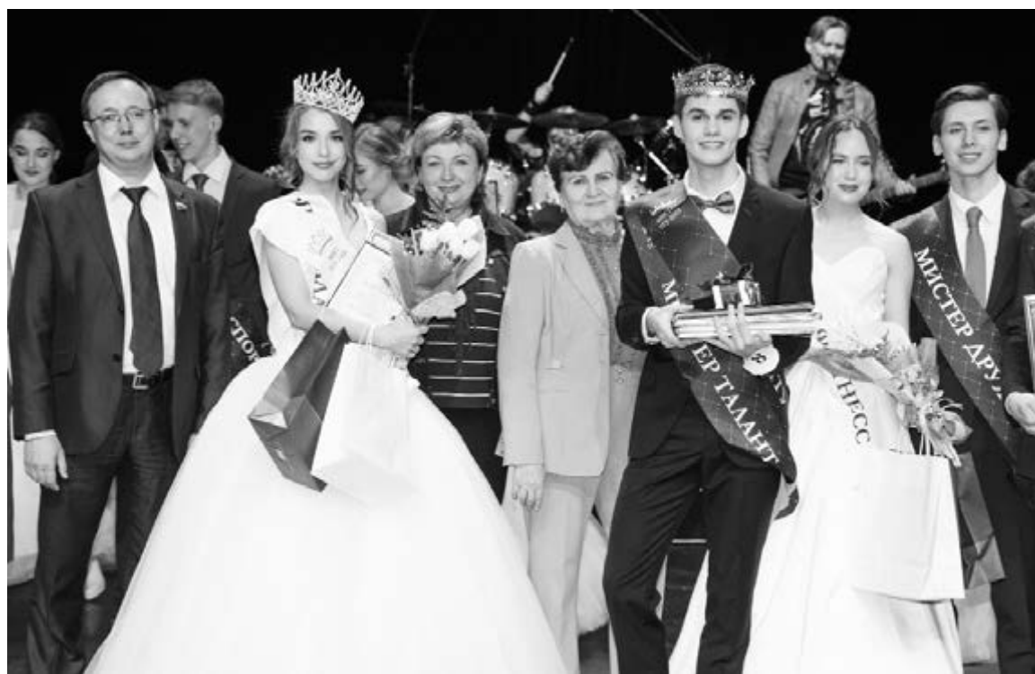
■ Коронация студентов-журналистов

И все участники конкурса были достойны победы. Но всё же жюри пришлось определить только двух лидеров.