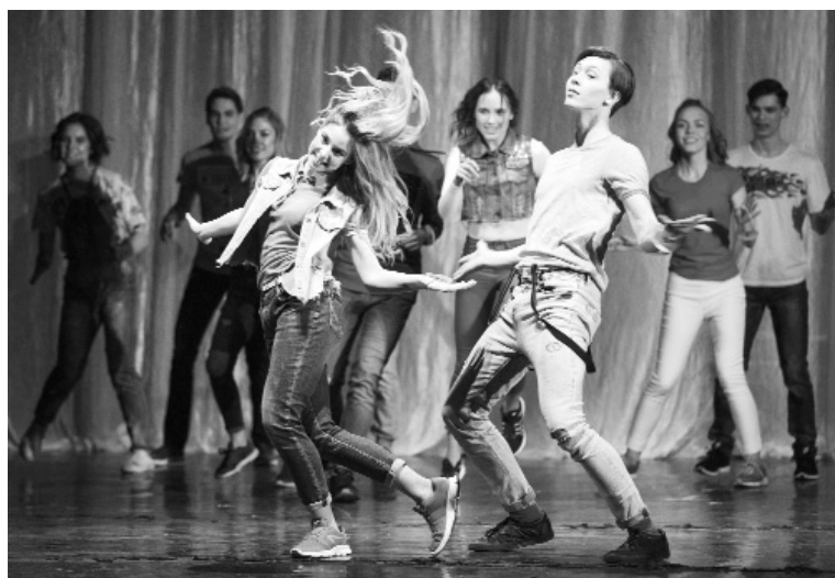
■ Танцевальный батл финалистов

Исполняет мечты и выводит из зоны комфорта