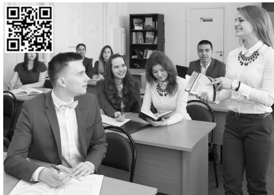
■ Статус сертифицированных специалистов в области управления проектами усилит позиции студентов опорного ТГУ на рынке труда