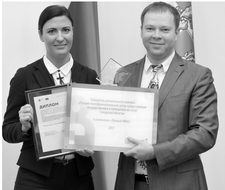
■ МФЦ Тольятти третий год подряд побеждает в региональном этапе конкурса «Лучший многофункциональный центр России»