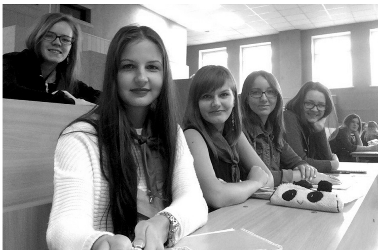
■ Педагогика — для одарённых студентов

В конце октября в городе Саранске на базе Мордовского государственного педагогического института (МГПИ) имени М. Е. Евсевьева проходила Всероссийская студенческая олимпиада по педагогике. Среди участников были студенты кафедры педагогики и методики преподавания Тольяттинского государственного университета.