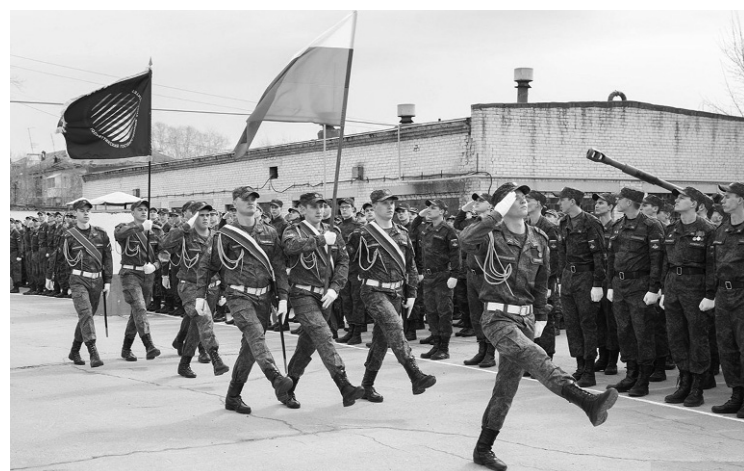
■ За 50 лет военная кафедра ТГУ подготовила более 12 тысяч квалифицированных офицеров запаса

Благодарим всех, кто принял участие в голосовании.