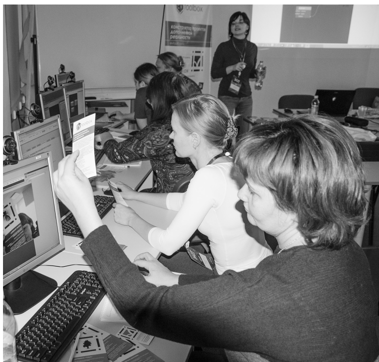
■ На 3D-платформе — свои сценарии!

Начался мастер-класс с объяснения основ и понятий. Дополненная реальность (AR) — это среда с прямым или косвенным дополнением физического мира цифровыми данными в режиме реального времени при помощи компьютерных устройств. В свою очередь виртуальная реальность (VR) — созданный техническими средствами мир (объекты и субъекты), передаваемый человеку через его