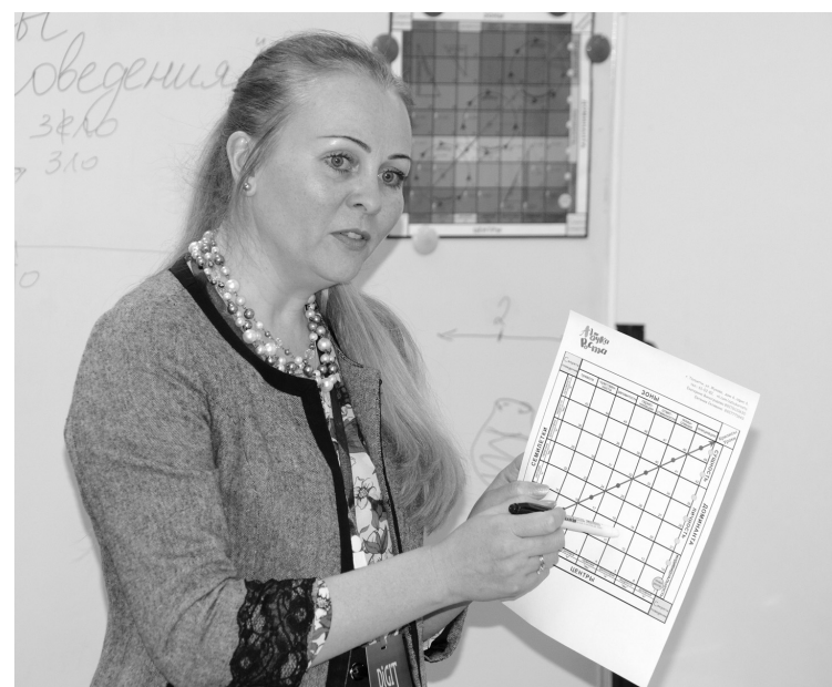
■ В игре — шанс на «проживание» и выход на новый уровень