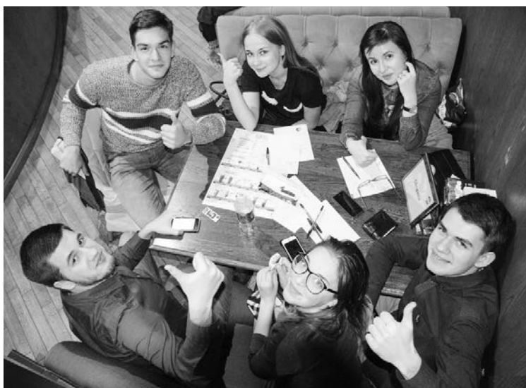
■ В игре важны не только знания, но и везение, и интуиция

— Мне понравилась атмосфера, мы словно все сблизились. В MAISON собрались разные поколения: студенты и выпускники ТГУ. И мы были объединены иг-