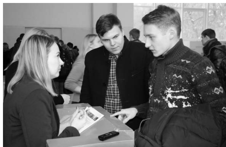
■ С чего начинается карьера в СИБУРе...

Важно: все претенденты проходят интервью с представителем HR-службы и руко-