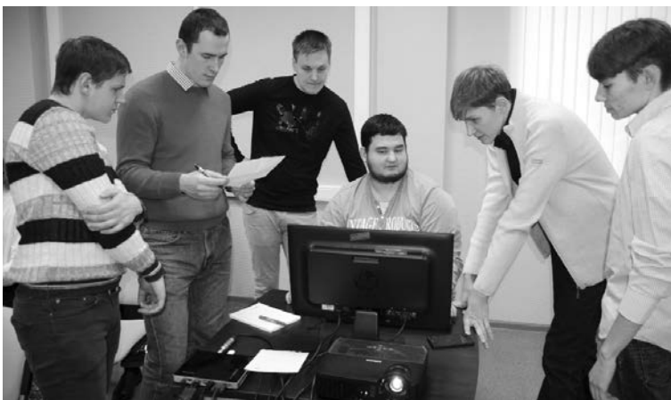
■ Студенты ТГУ на форуме представили 12 оригинальных проектов

В технопарке «Жигулёвская долина» 5 декабря стартовали «Дни открытых инноваций», посвящённые сложному и неоднозначному явлению — цифровой экономике. В рамках «Дней» студенты и специалисты Тольяттинского государственного университета (ТГУ) провели презентацию проектов в сфере цифровизации, участвовали в семинарах и мастер-классах. Опорный ТГУ выступил партнёром конференции и активным участником научного блока.