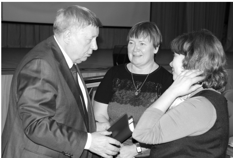
■ ТГУ стал региональной дискуссионной площадкой по вопросам экологической безопасности

П рофессиональная сессия, посвящённая теме «Экологическая безопасность и охрана окружающей среды», состоялась в Тольяттинском государственном университете (ТГУ). Главная её цель — повысить качество подготовки специалистов, сформировать и укрепить деловые и профессиональные контакты между системой образования и органами государственной власти и самоуправления субъектов РФ, и представителями промышленной сферы.