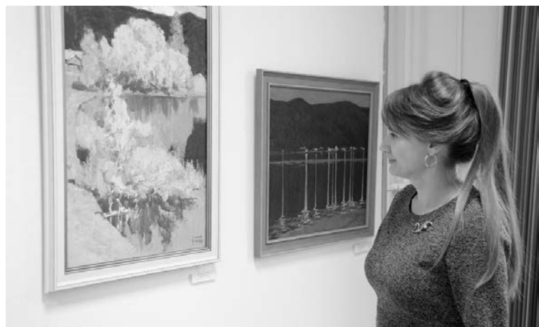
■ Пейзаж — зеркало красоты природы

В Тольяттинском государственном университете (ТГУ) проходит выставка творческих работ преподавателей института изобразительного и декоративно-прикладного искусства (ИИИДПИ). Разнообразие жанров и техник — картина, портрет, пейзаж, натюрморт, батик — настраивают на лирический лад всех посетителей выставки.