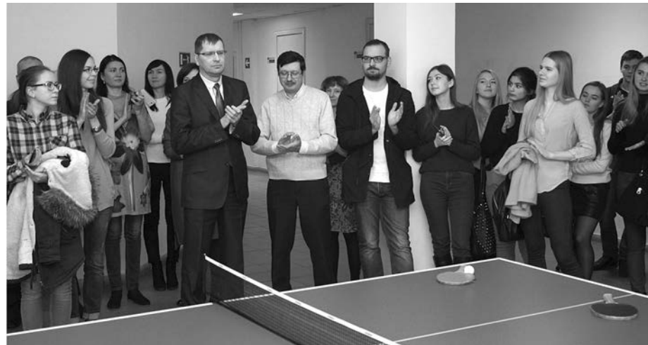
■ Здоровая идея и её успешное воплощение

30 ноября на третьем этаже учебно-лабораторного корпуса Тольяттинского государственного университета (ТГУ) был установлен теннисный стол для игры в пинг-понг. Это событие — результат воплощения в жизнь идеи студентов-первокурсников, которая возникла у них на неделе проектной деятельности в начале учебного года. Именно эта вроде бы простая идея нашла поддержку у руководителей четырёх институтов ТГУ.