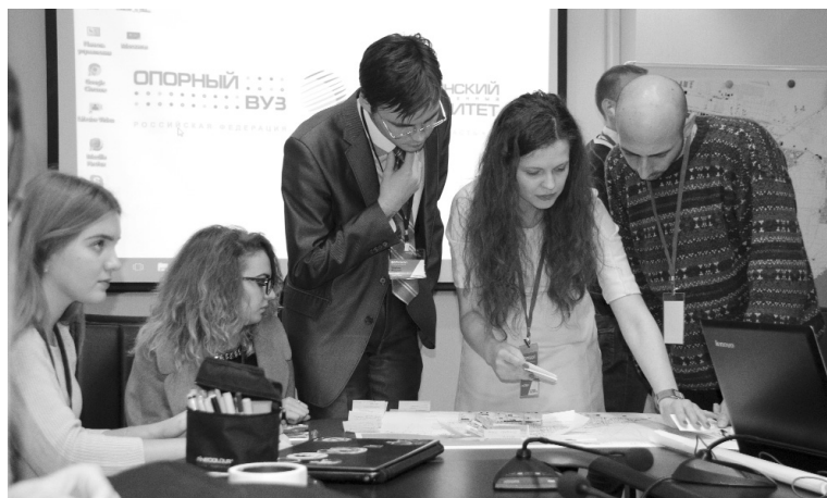
■ Каждый проект обсуждается детально

— Нам важно видеть инициативу от бизнеса. В то же время при проектировании важно мнение простых горожан. К примеру, одним из