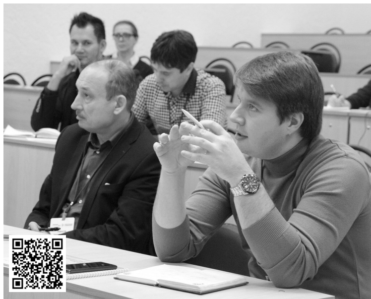
■ «Есть talk» тиражирует свой медиаопыт в опорные вузы

Ещё одним выступлением семинара стал мастер-класс «Создание практической образовательной среды для студентов-журналистов: опыт выпуска многотиражных газет на ба-