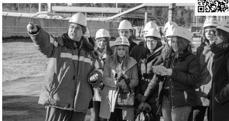
■ Студенты ТГУ знакомятся с потенциальным работодателем

В рамках Всероссийского фестиваля энергосбережения #Вместеярче студенты института машиностроения Тольяттинского государственного университета (ТГУ) побывали на дочернем предприятии Газпрома — в Тольяттинском производственном управлении магистральных газопроводов «Газпром Трансгаз Самара» в селе Пискалы.