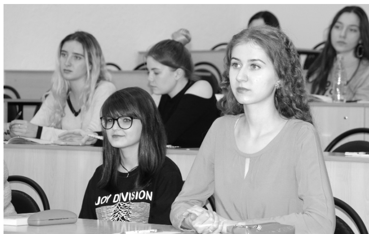
■ Театр начинается с... самопознания