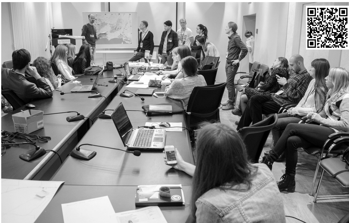
■ Открытая дискуссия с представителями городских сообществ