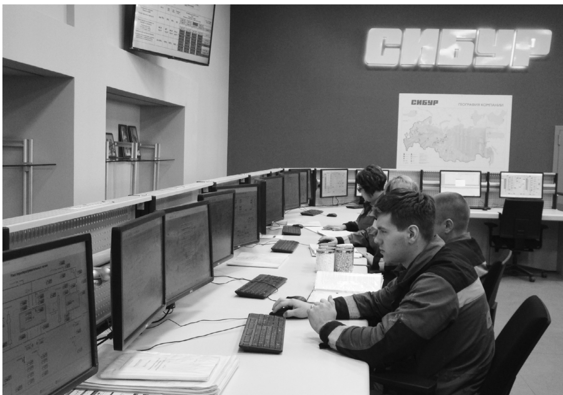
■ Студенты ТГУ осваивают новые современные производства

16 ноября «СИБУР Тольятти» продемонстрировал один из своих инвестиционных проектов — проект по реконструкции производства изопрена, окончание реализации которого ожидается в 2018 году. В ходе общения с прессой был подробно рассмотрен вопрос о трудоустройстве молодых специалистов на предприятие.