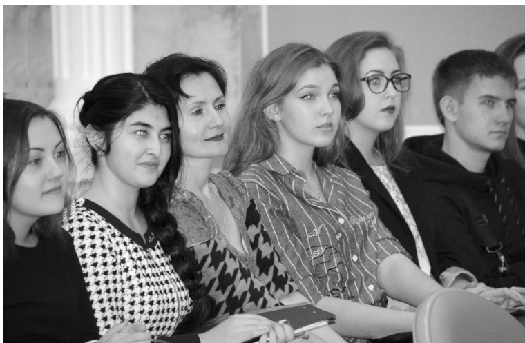
■ Лучшая оценка проектов — внимание аудитории

В Тольяттинском государственном университете (ТГУ) прошёл уже ставший традиционным конкурс экологических проектов Project show Green-City-2017. В нём приняли участие школьники и студенты — представители 48 учебных заведений Самарской области, в том числе и ТГУ. По оценкам организаторов, молодёжь проявляет высокий интерес к экологическим проблемам города, предлагая для их решения нестандартные и креативные идеи.