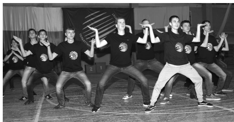
■ ...и будет жить!