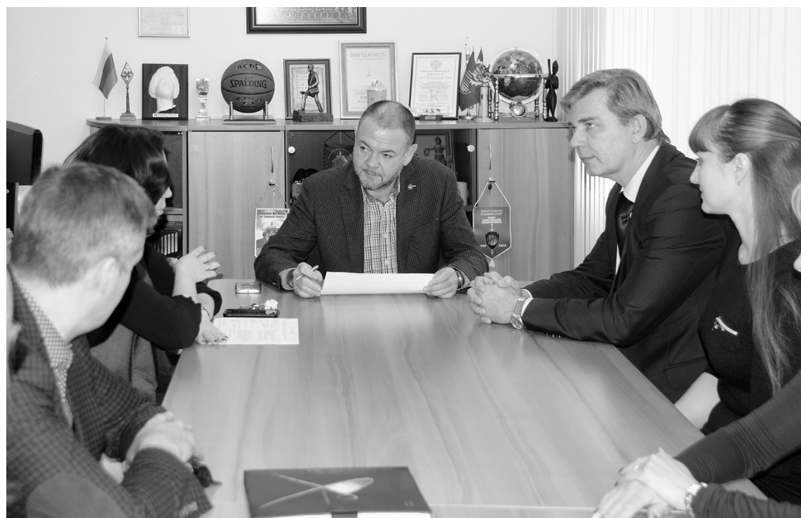
■ Делегация из УлГУ сравнила «Росдистант» с искусственным интеллектом

Н а прошлой неделе Тольяттинский госуниверситет (ТГУ) посетила делегация Ульяновского государственного университета (УлГУ). Коллеги из соседней области перенимали опыт ТГУ в части системы управления вузом, работы объединённого деканата, а также реализации федерального проекта предоставления качественного высшего образования дистанционно — «Росдистант». Это не первое взаимодействие двух вузов, однако минувшая встреча стала основой для выстраивания более тесных партнёрских отношений.