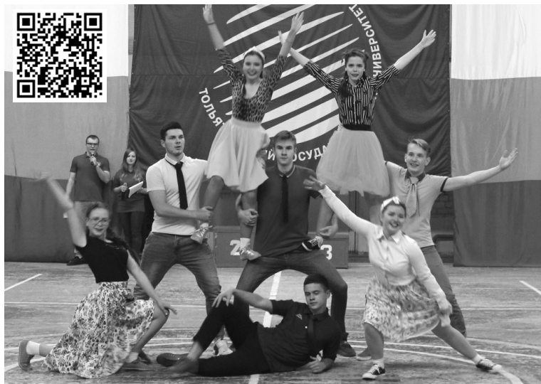
■ Рок-н-ролл жил...

Под весёлую ритмичную музыку участники менялись партнёрами и выполняли сложнейшие поддержки, от которых захватывало дух. Они с лёгкостью крутились колесом и садились на шпагат.