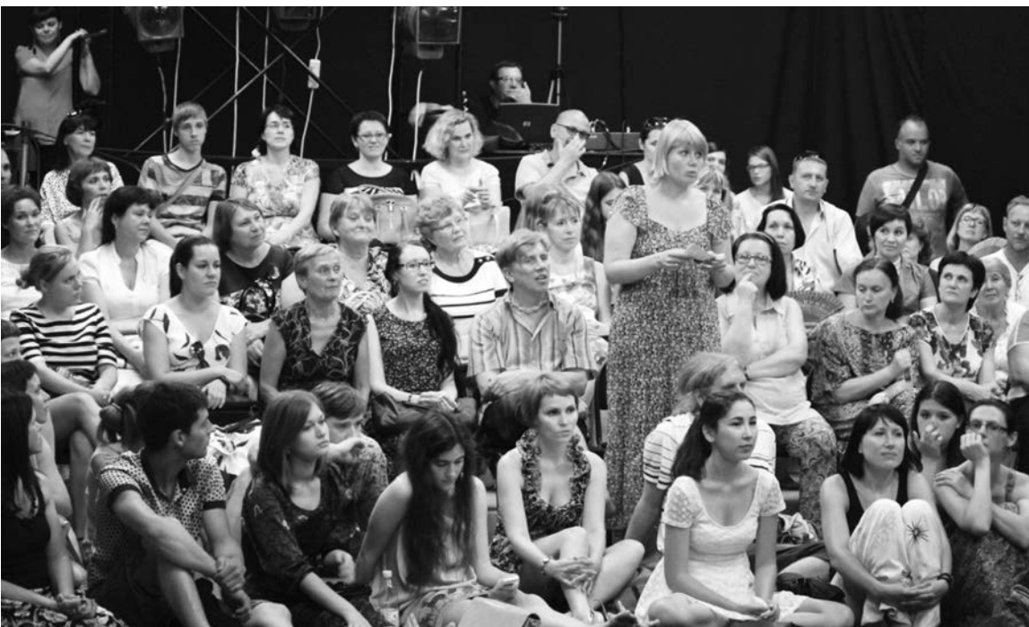
■ Мнение зрителей — это святое

Первый день фестиваля по традиции откроется внеконкурсным спектаклем. 19 июня самарский театр «Город» представит тольяттинской публике драму «Наш класс» по пьесе Тадеуша Слободзянека «Одноклассники. История в XIV уроках». Этот спектакль был рождён на фестивале-лаборатории «Место действия». Его премьера стала заметным событием в театральной жизни губернии. Режиссёр спектак-