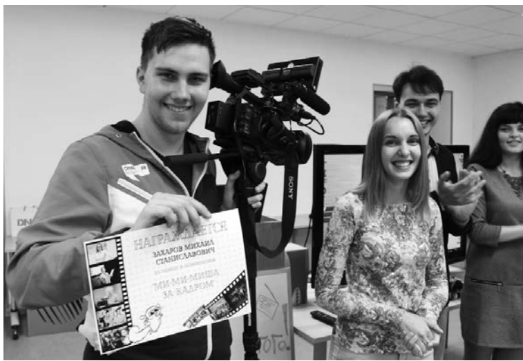
■ Награды нашли героев

Десятый юбилейный телесезон закончился для телевизионщиков ТГУ. Как и принято на «большом телевидении», сотрудники «ТОЛК ТВ» и студенты, на славу потрудившиеся и снимавшие в течение года, собрались в своём новом доме — лектории молодёжного медиахолдинга «Есть Talk» и устроили праздничный капустник. Закрытие телесезона — это повод подвести итоги и от души посмеяться над собой. Ну а тема капустника, закрывающего юбилейный телесезон, была определена как самая что ни на есть горячая — «Этот безумный, безумный, безумный, безумный телесезон!».