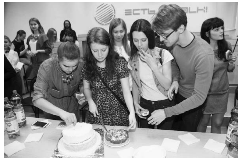
■ ...Всё закончилось сладким пиршеством