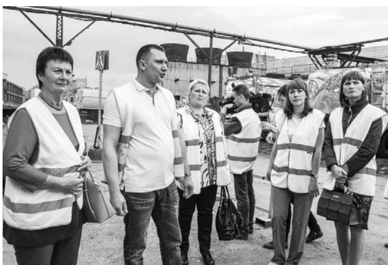
■ Защита окружающей среды — дело общее

Администрация Тольятти и группа компаний «Эковоз» провели 1 июня пресс-тур. Журналистам городских СМИ рассказали об организации раздельного сбора отходов на территории Тольятти. Мероприятие приурочено к проведению в 2017 году Года экологии в России.