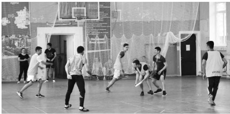
■ Дух игры — позитивный!

Могут ли вообще игры с летающей тарелкой быть интересными? Естественно! В этом смогли убедиться студенты Тольяттинского государственного университета. 24 мая в малом спортивном зале ТГУ состоялся первый турнир в Тольятти по алтимату среди студентов разных институтов.