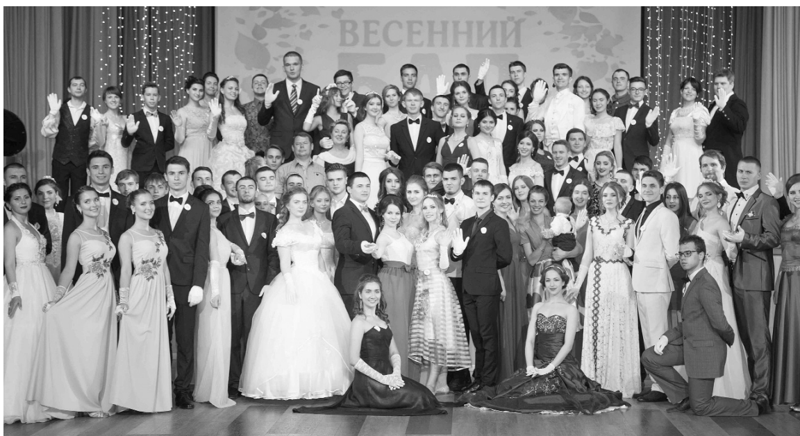
■ Фото на добрую память

В первые в Тольяттинском государственном университете состоялся «Весенний бал». Дамы в шикарных платьях и кавалеры в стильных костюмах собрались 26 мая в актовом зале ТГУ, чтобы воссоздать торжественную атмосферу балов XIX века.