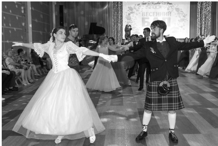
■ Шотландский танец

Участники бала и правда большие молодцы. Всего за ме-