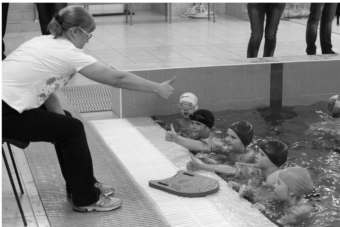
■ «Молодцы! Отлично!»

Дни открытых дверей — с 10 по 13 мая — успешно прошли в бассейне Тольяттинского государственного университета (ТГУ). Открытые уроки плавания посетили более 200 школьников, а в качестве «группы поддержки» выступили их мамы и папы. Организатором Дней стал физкультурно-оздоровительный комплекс (ФОК) ТГУ.