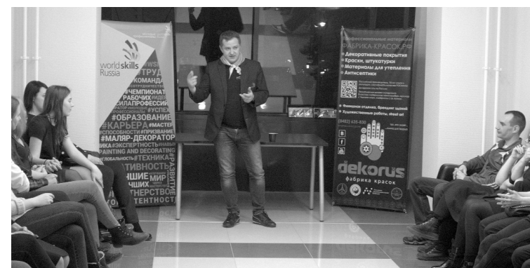
■ «Тренировочный полигон»

18 — 23 августа 2019 года Россия будет принимать 45-й мировой чемпионат WorldSkills. Чемпионат пройдёт в Казани