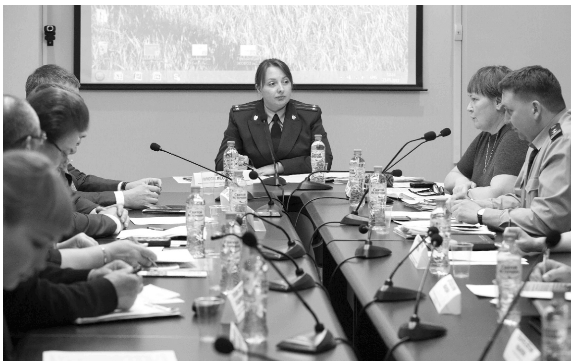
■ Экологические проблемы — во всех аспектах

Ещё в начале XX века великий русский учёный Владимир Вернадский предупреждал: наступит время, когда людям придётся взять на себя ответственность за развитие и человека, и природы. В наши дни экологическая ответственность стала осознанной реальностью. Нюансам законодательства в сфере экологии был посвящён круглый стол Волжской межрегиональной природоохранной прокуратуры по Самарской области, проходивший в Тольяттинском государственном университете (ТГУ) 23 мая. Организатором его выступила кафедра управления промышленной и экологической безопасностью ТГУ.