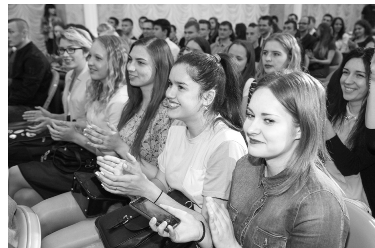
■ Праздник для души

Тольяттинский государственный университет включён в федеральную программу «500 бассейнов». Планируется, что уже в этом году на пересечении улиц Ушакова и Баныкина начнётся строительство нового бассейна на 8 дорожек, который станет первым в Тольятти спортивным объектом, созданным в рамках этой федеральной программы. Отметим, что бассейн ТГУ будет доступен гражданам с ограниченными возможностями здоровья (маломобильным группам населения)