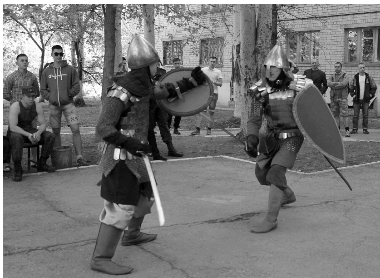
■ Сражение богатырей

ся. Песни, представления, конкурсы и пляски — такое гулянье могло растянуться аж на несколько месяцев. И хотя у хозяев этого вечера было всего несколько часов, гостей развлекали на славу.