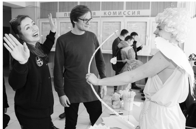
■ Купидон целится в сердца студентов

Праздник праздником, а в университете идти всё равно пришлось — на пары. На большую перемене нам пообещали сюрприз: профком студентов и аспирантов ТГУ будет ждать всех в главном корпусе. Приходить, конечно, лучше парочками. Почему бы и нет? Беру симпатичного светлого парня из института энергетики и электротехники, иду с ним на праздник.