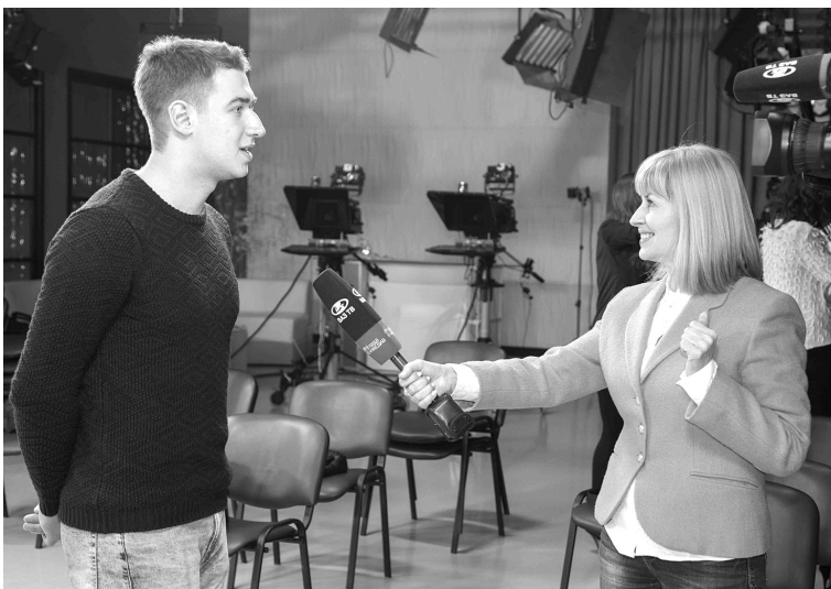
■ Первое интервью «Мистера»

К онкурсанты «Мистер и Мисс ТГУ — 2017» посетили 14 февраля «родину» тольяттинского городского телевидения — телекомпанию «Лада-Медиа». Встретили гостей с оператором, так на «Лада-Медиа» решили «убить двух зайцев»: и экскурсию провести, и сюжет для программы новостей снять.