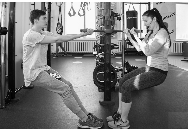
■ Хорошая физическая форма важна для конкурсантов

П оследние недели перед финалом конкурса «Мистер и Мисс ТГУ — 2017» — всегда самые насыщенные на события. Финалисты активно готовятся к главному событию, которое состоится 2 марта. При этом они не забывают об учёбе и встречах со своими наставниками.