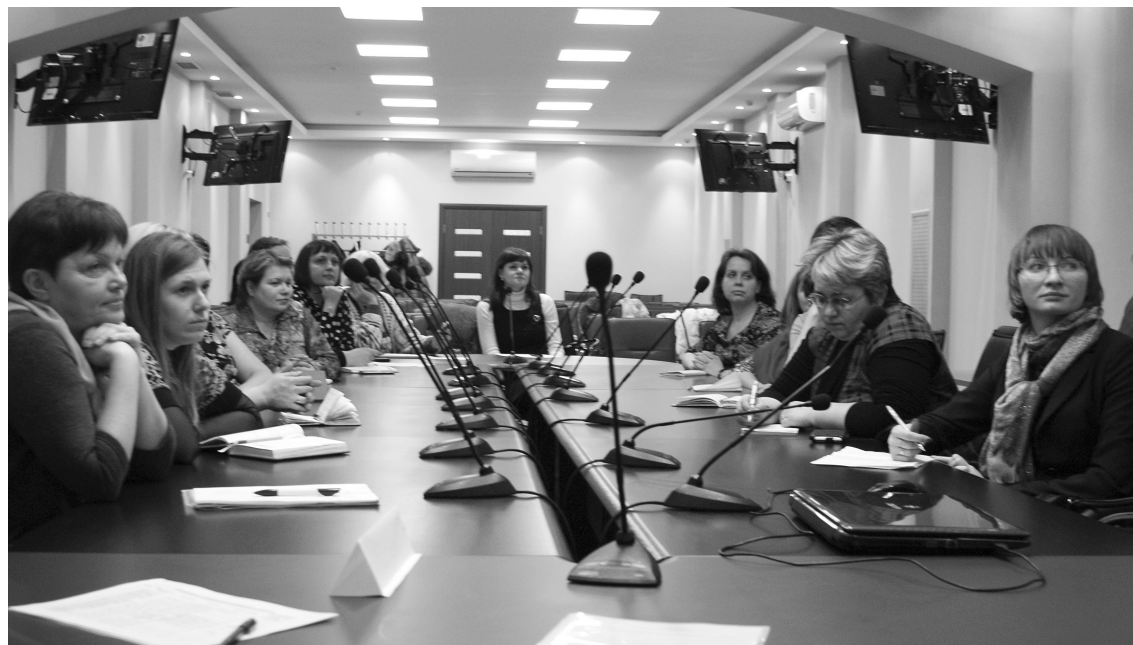
■ Аргументы «за ТГУ» прозвучали убедительно

В Тольяттинском государственном институте 15 февраля состоялся семинар для учителей информатики городских школ. Принимал гостей институт математики, физики и информационных технологий (ИМФИТ) ТГУ.