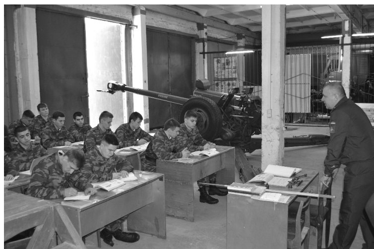
■ Военная тактика — наука сложная