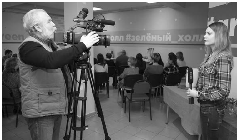
■ Рабочие будни сотрудников «Толк ТВ»

«Просвещение» — это национальный образовательный