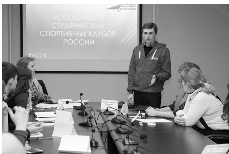
■ Студенческие спортивные клубы Тольятти приглашают вступить в АССК России