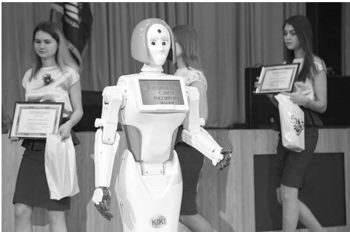
■ Робот Кики как символ научного прогресса