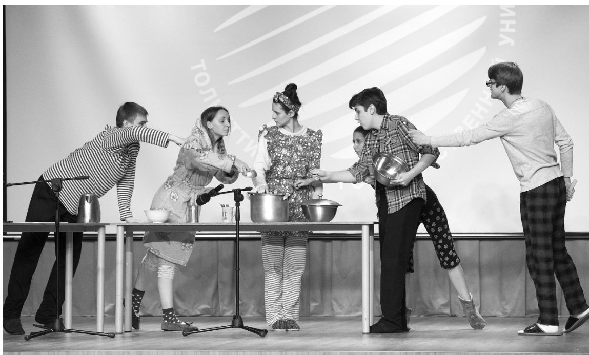
■ «А вы ноктюрн сыграть смогли бы?..»

Н есколько месяцев мы с нетерпением ждали финального кастинга конкурса «Мистер и Мисс ТГУ — 2017», чтобы наконец-то узнать имена тех, кто поборется за короны. Члены жюри выбрали 14 студентов — 7 девушек и 7 юношей, которым предстоит показать свои таланты и интеллект на финале конкурса 2 марта.