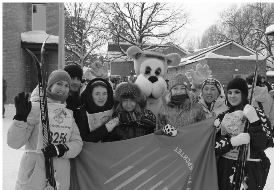
■ Даёшь лыжню!

воздуху и возможности получить заряд бодрости и хорошего настроения.