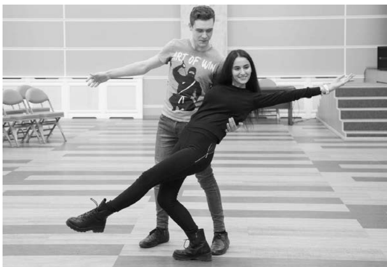
■ Нелёгкая стезя...

Т ерпение и труд всё перетрут — пожалуй, именно эта поговорка должна повторяться как мантра конкурсантами «Мистер и Мисс ТГУ — 2017» каждый день, чтобы не дать себе расслабиться и не упустить из рук желанный трофей. А терпение — это то, что ребятам понадобится больше всего на этом нелёгком пути к короне.