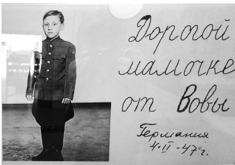
■ Каким он был...

25 января — день рождения поэта, актёра и автора-исполнителя песен Владимира Высоцкого. Человека, который вошёл в историю благодаря своим правдивым стихам и песням, прославившись и в России, и за рубежом. В 1980 году Высоцкого не стало, но память о нём осталась, а творчество по-прежнему пользуется популярностью. Это истинно народный Артист.