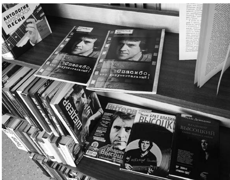
■ ...Таким остался в наших сердцах

Виктор Куликов вспоминает время, когда он ещё и не думал о том, что когда-нибудь откроет центр-музей, посвящённый Владимиру Высоцкому: «В 1970-х годах я смотрел фильмы с участием Высоцкого — «Единственная», «Место встречи изменить нельзя». В школе все мальчишки делали бумажные пистолетики, пытались походить на геро-