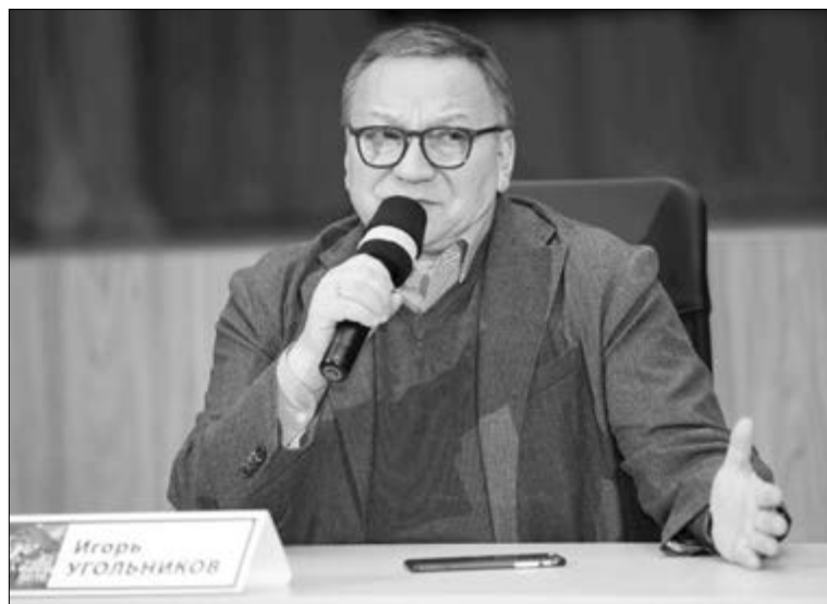
■ Игорь Угольников

Большая часть встреч на «ТЭФИ-Регион» в Тольятти была посвящена направлению «Просветительское и развлекательное телевидение». Мэтры отечественного телеэфира делились профессиональным опытом, рассказывали об истории создания известных передач и фильмов, давали свои советы начинающим тележурналистам. В этом номере мы публикуем материалы о самых ярких мастер-классах, которые прошли в ТГУ в рамках XV юбилейного Всероссийского телевизионного конкурса «ТЭФИ-Регион».