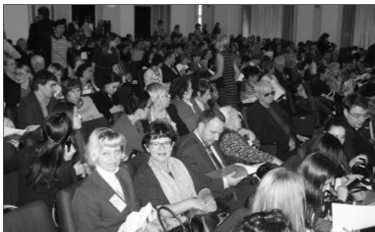
■ Участники V Всероссийского социологического конгресса в Екатеринбурге