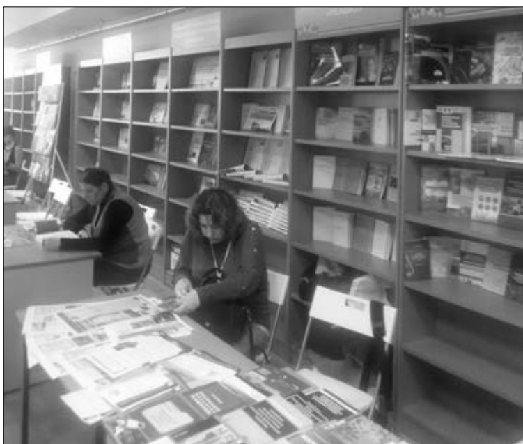
■ Издательство ТГУ привлекало внимание коллег качеством учебных пособий

На заседаниях издательского кластера и круглом столе, который состоялся в последний выставочный день, участники обсуждали вопросы настоящего и будущего издательских комплексов региональных университетов, вели речь о симбиозе науки и книги. Было приятно слышать в наш адрес добрые слова от коллег и от посетителей выставки, оценивших нашу работу по высшему баллу. Думаю, что признание коллег-профессионалов и рядового зрителя — показатель того, что