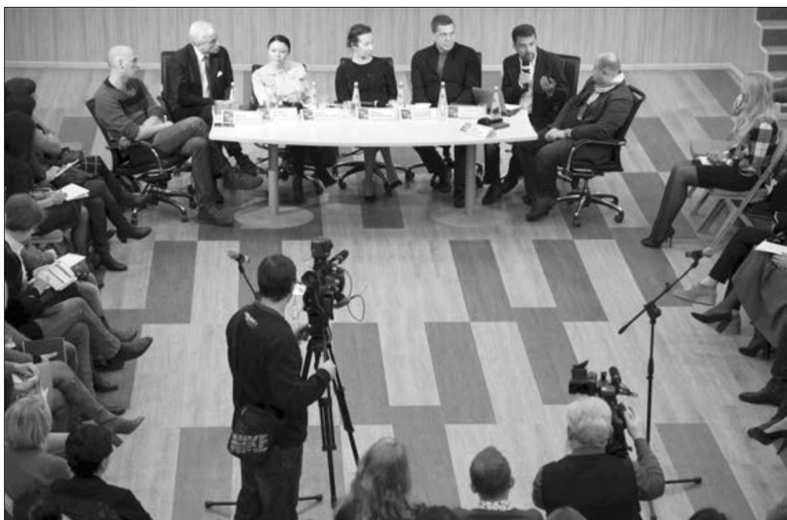
■ «Разбор полётов»

Так, ошибкой для многих участников «ТЭФИ-Регион» стала путаница в номинациях. К примеру, в просветительские программы прислали публицистические и наоборот. Директор дирекции историко-публицистических программ телеканала ОТР Леонид Млечин считает, что в работах не нужно говорить всю суть, нужно недоговаривать, чтобы у зрителя была возможность додумать самому: «Я не за того, кто выказывает свои чувства, я за достоверные факты».