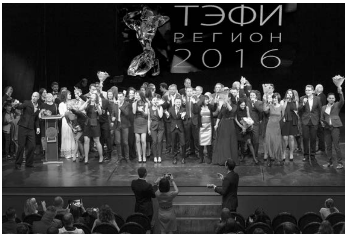
■ Финалисты «ТЭФИ-Регион — 2016» (направление «Просветительское и образовательное телевидение») на сцене театра «Колесо»

2 ноября стали известны имена финалистов XV юбилейного Всероссийского телевизионного конкурса «ТЭФИ-Регион — 2016» по направлению «Просветительское и развлекательное телевидение». Церемония награждения прошла в Тольяттинском драматическом театре «Колесо» им. Глеба Дроздова.