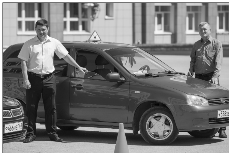
■ Автошкола ТГУ — это профессиональные преподаватели и современные автомобили

С 1 сентября 2016 года вступает в силу новый регламент сдачи экзаменов в ГИБДД, и занятия в автошколе ведутся с учётом предстоящих изменений. В настоящее