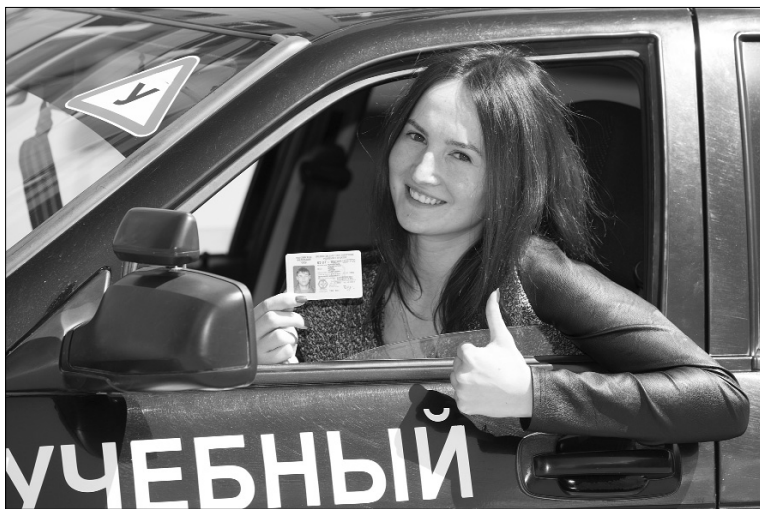
■ Учат на «отлично»!

В автошколе управления дополнительного профессионального образования Тольяттинского государственного университета 30 мая состоялся первый в этом году выпуск группы слушателей курсов профессиональной подготовки водителей транспортных средств категории «В».