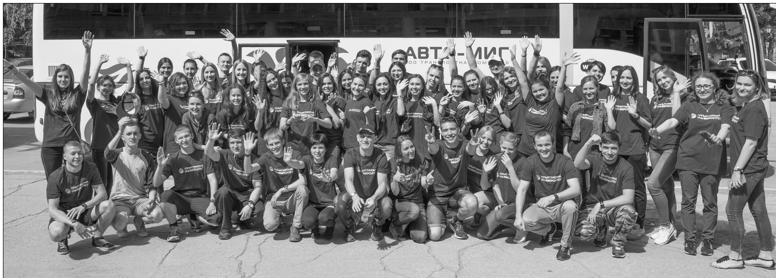
■ Делегация ТГУ — одна из самых многочисленных на форуме