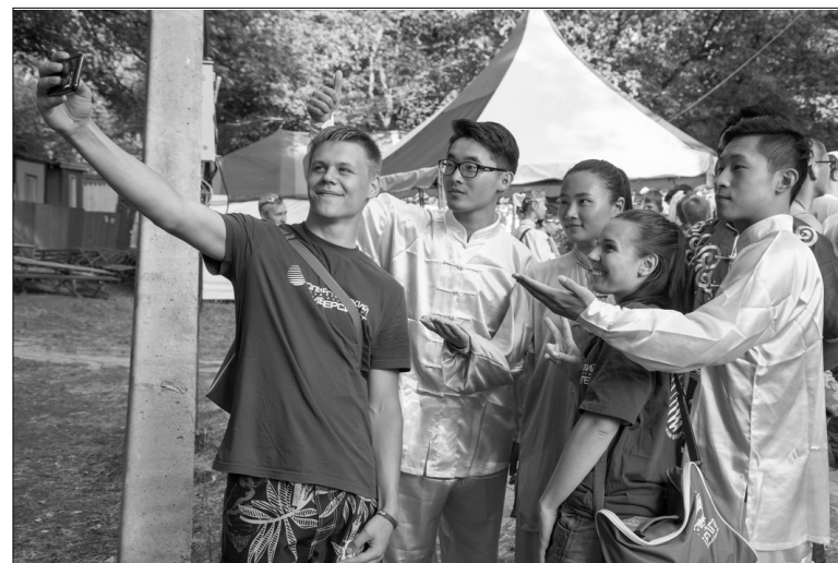
■ «iВолга-2016»: курс на интернационализацию