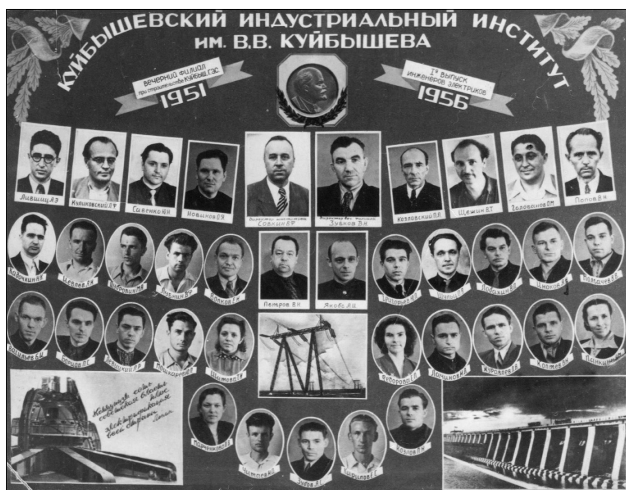
■ Первый выпуск инженеров-электриков (1951 — 1956 гг.)

Для того чтобы осознать, чем отличалось обучение в середине прошлого века от нашего времени, следует вернуться к моменту зарождения высшего образования в городе Ставрополе (впоследствии Тольятти) и начала строительства Куйбышевской ГЭС —