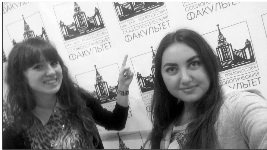
■ Тревел-гранты ТГУ — первый шаг в большую науку

12 апреля состоялось открытие конференции в актовом зале фундаментальной библиотеки МГУ. Полный зал