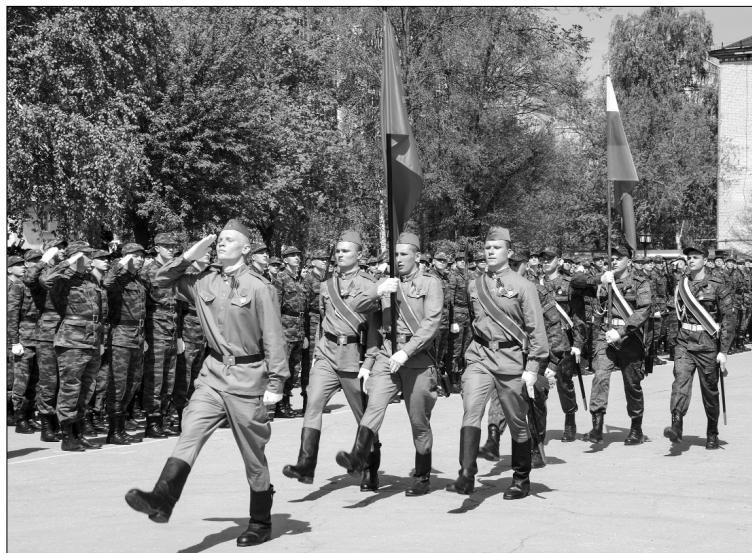
■ Парад курсантов ТГУ в День Победы

В учебном военном центре военная подготовка осуществляется в процессе обучения студента в ТГУ на целевом (бюджетном) месте по специальности «Наземные транспортно-технологические средства». Военно-учётная специальность выпускников УВЦ — «Боевое применение подразделений наземной (самоходной) артиллерии». Обучение проводится два дня в неделю в течение 5 лет. В программу военной подготовки в УВЦ входят учебный сбор (14 суток) и войсковая стажировка (30 суток).