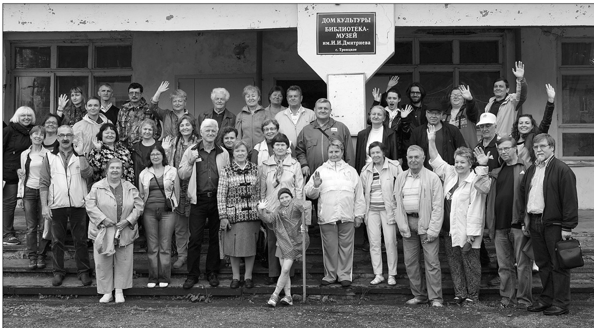
■ Коллективный портрет на фоне Дома культуры

Мы отправились в библиотеку-музей имени И.И. Дмит-