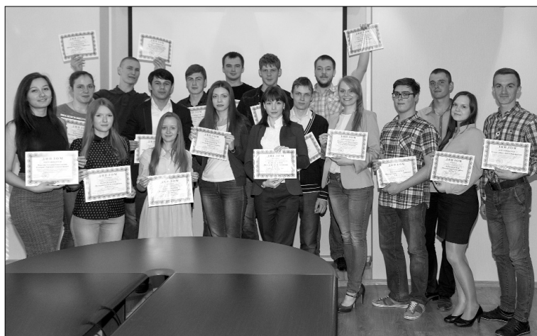
■ Герои студенческой науки

науки в ТГУ». В этом году конференция прошла в апреле. Все желающие, вне зависимости от профиля обучения, представляли свои работы на семинарах и круглых столах в стенах кафедр своих институтов. По результатам конкурса выпускается сборник лучших студенческих работ, а победители получают дипломы и денежные призы.