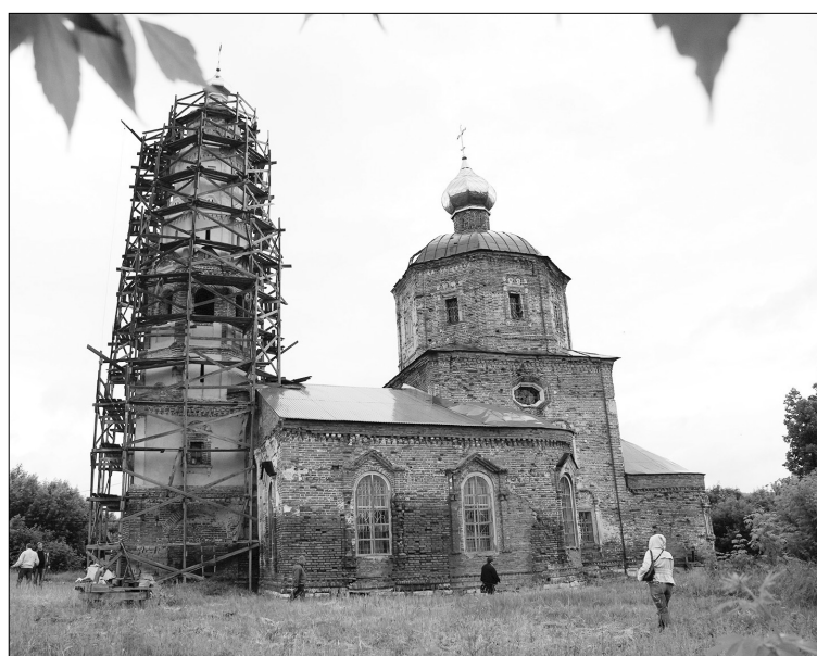
■ Троицкой церкви около трёх веков

риева. В экспозиции представлены портреты, родословная, наградные листы Ивана Ивановича Дмитриева . Здесь есть его книги и книги, в которых рассказывается или упоминается о нём. Очень ценными являются «Симбиряне в жизни и творчестве Пушкина» и «Труды и дни Ивана Дмитриева» (1-й том — хроника, 2-й том — стихотворения и переводы).