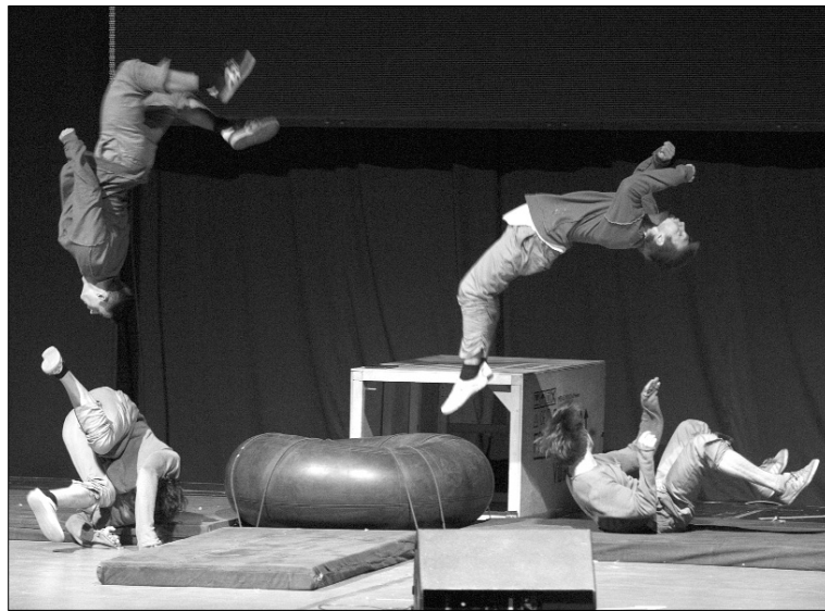
■ Сложный номер — лучший номер

На следующий день двое участников нашего коллектива выступали с «Боди-артом» на площадке оригинального жанра. Оттуда направились на площадку региональных программ, частично стёрли с себя краску после «Боди-арта», чтобы выступить в начале