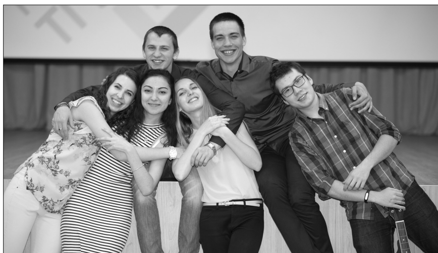
■ Конкурс похож на игру в кругу близких друзей

Отметим, что ТГУ — первый в Самарской области вуз-участник системы добровольной сертификации «Военный регистр». Это не только свидетельствует о высоком уровне развития системы менеджмента качества университета, но и позволяет научным подразделениям вуза претендовать на выполнение государственных оборонных заказов. С мая 2014 года в ТГУ функционирование СМК подтверждено сертификатом соответствия требованиям ГОСТ ISO 9001-2011 и ГОСТ РВ 0015-002-2012.