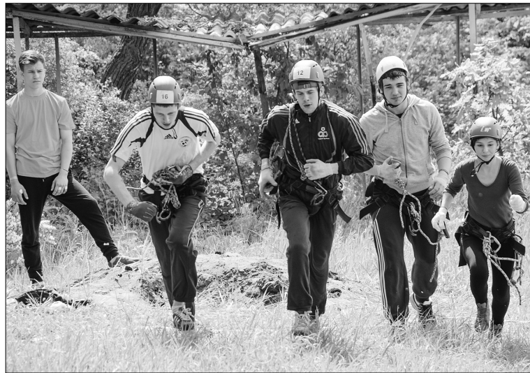
■ Турполоса — преодоление себя

С 20 по 22 мая, уже в четырнадцатый раз, студентов Тольяттинского госуниверситета собрал туристский слёт. Второй год подряд палаточный лагерь ТГУ расположился на территории турбазы «Спартак».