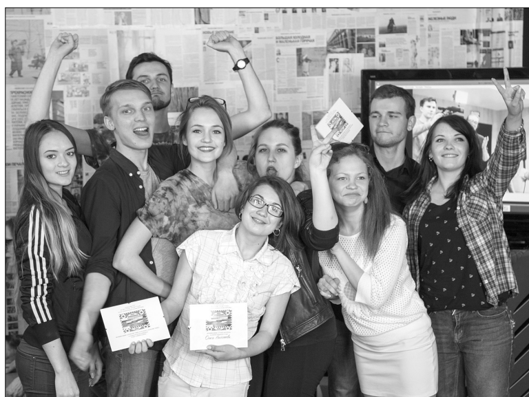
■ «Зажигает» третий курс!

Т елестудия в нашем университете работает уже 10 лет. Конечно, за это время сложились и, можно сказать, уже стали старыми традиции. Одна из них — важная, весёлая и суперэсклюзивная — закрытие телесезона. Всё как на настоящем телевидении, но по-студенчески. Потому как это не просто подведение итогов года, где выбираются лучшие стендапы и отмечаются те студенты, которые много работали над сюжетами, — это своеобразный открытый зачёт в виде капустника.