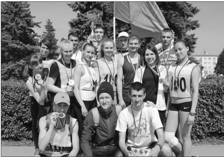
■ Команда легкоатлетов ТГУ — лучшая

9 мая после торжественного митинга и парада в честь 71-й годовщины Победы в Великой Отечественной войне на площади Свободы состоялась традиционная 56-я общегородская легкоатлетическая эстафета. В очередной раз победителем забега спортсменов из тольяттинских вузов стала команда Тольяттинского госуниверситета.