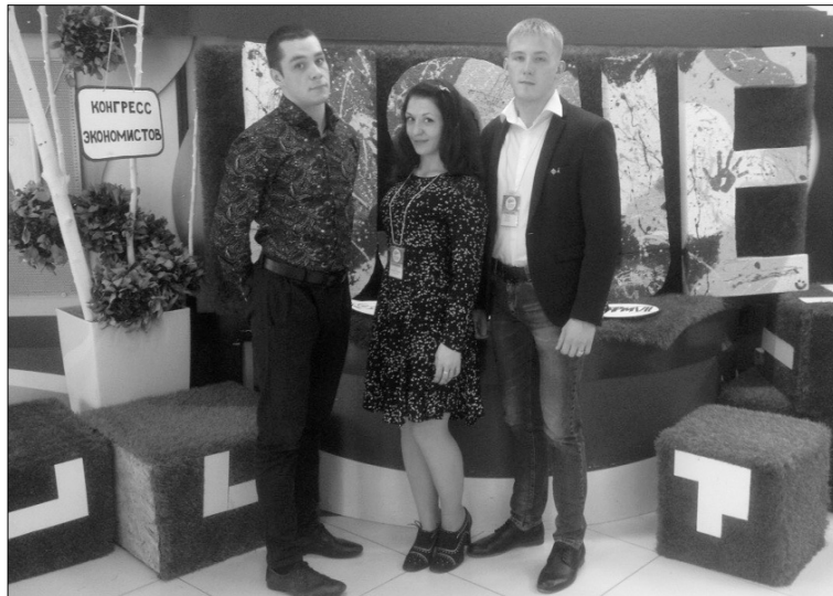
■ Студенты-химики ТГУ — призёры EURASIA-GREEN

В конце апреля в Уральском государственном экономическом университете (УрГЭУ) состоялся VII Евразийский экономический форум «Диалог цивилизаций: путь на Восток», в рамках которого проводился Международный конкурс научно-исследовательских проектов молодых учёных и студентов EURASIA-GREEN. Его призёрами стали студенты Тольяттинского государственного университета.