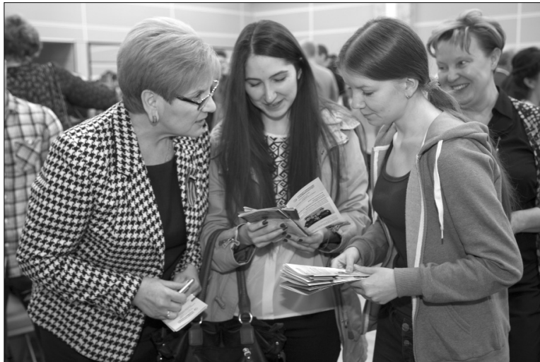
■ Диалог о мотивации студентов

27 апреля в актовом зале Тольяттинского госуниверситета состоялась ярмарка вакансий для студентов и выпускников «День твоей карьеры».