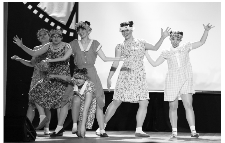
■ «Заломы рук, закаты глаз»

мере и сложные трюки, и философский смысл — «человек сам себе «ставит» границы».