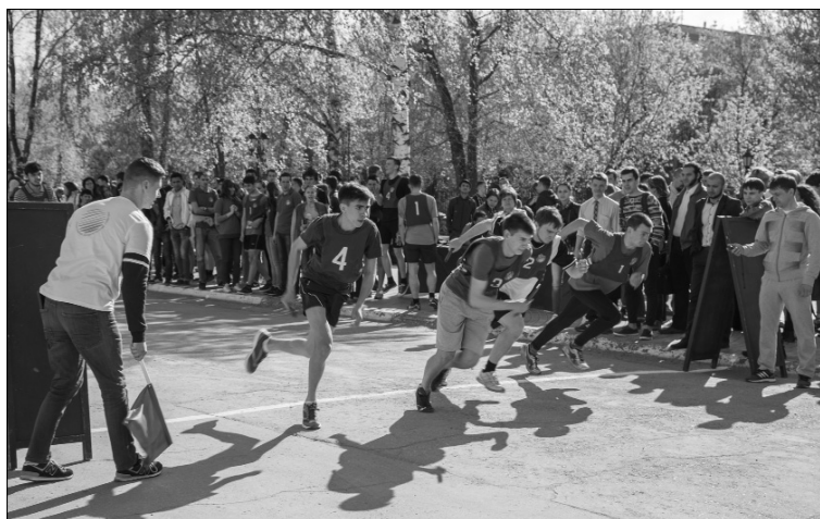
■ Волнующий момент старта

29 апреля на площади перед главным корпусом Тольяттинского государственного университета по традиции прошла легкоатлетическая эстафета заключительного этапа универсиады ТГУ 2015-2016-го учебного года.