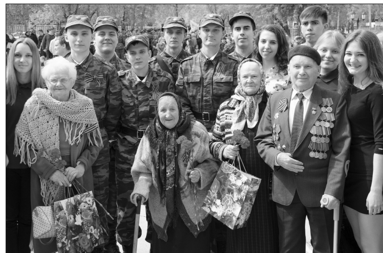
■ День Победы объединяет поколения

Следует помнить, что те, кто разжигает взаимную ненависть, развязывает террористические войны, устраивает локальные конфликты и «цветные» революции, преследуют свои корыстные ин-