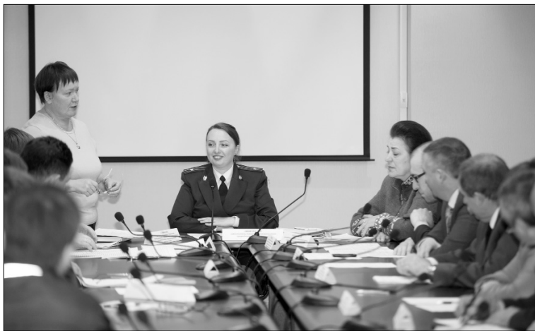
■ Конструктивный диалог

В ходе встречи обсуждалась организация несанкционированных свалок, правила благоустройства города в плане охраны окружающей