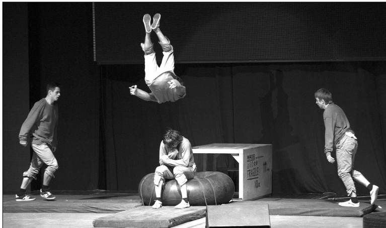
■ «Другая жизнь» команды VioCube

25 апреля в Самаре в МТЛ «Арена» состоялся гала-концерт областного фестиваля студенческого творчества «Самарская студенческая весна — 2016». В нём приняли участие самые яркие и творческие студенты Самары и Тольятти, среди них — ребята из команды ТГУ VioCube. Они показали номер «Другая жизнь» с элементами паркура. Выступление получилось спортивным, глубоким и даже философским. Поддержать ребят приехал целый десант студентов Тольяттинского госуниверситета.