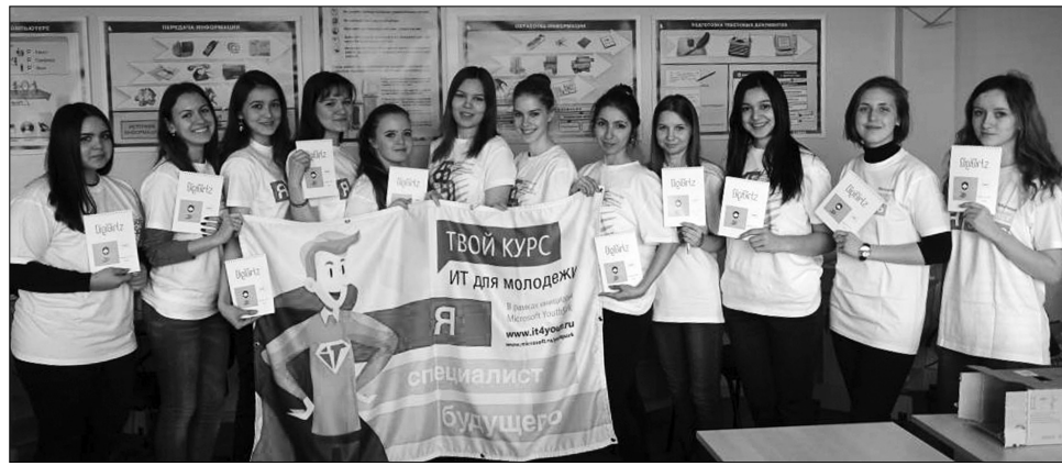
■ Будущие «айтишницы»

С тереотип о том, что компьютеры подвластны только мужчинам, уже не актуален. Центр проекта «Твой курс» при Тольяттинском государственном университете организовал знаковое событие — «День IT-карьеры и технологий для девочек» в рамках первой международной акции #MakeWhat'sNext («Создавай будущее»). Женщины-программисты в тренде — это факт.