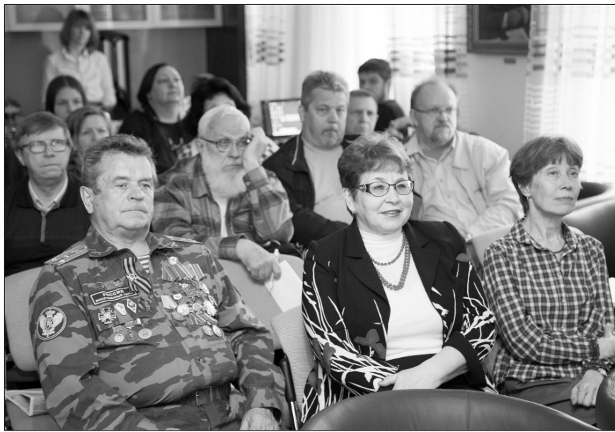
■ Душевная атмосфера в гостиной Дома учёных

Необычное по форме и содержанию заседание состоялось 27 апреля в Доме учёных ТГУ. Оно было посвящено уникальным событиям, повлиявшим на ход истории.