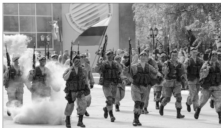
■ Захватывающее выступление спецназа