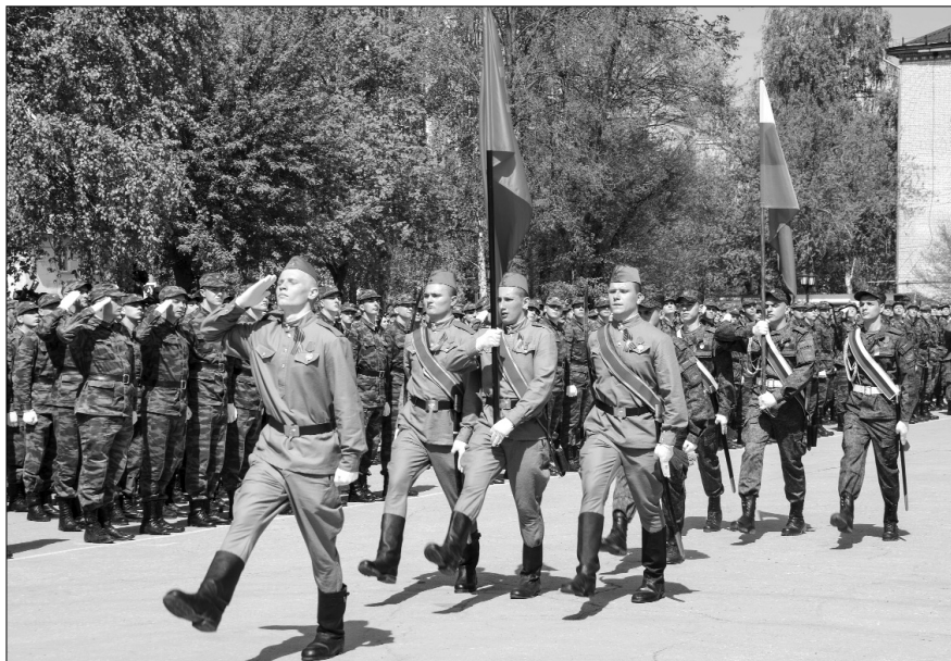
■ Марш курсантов ТГУ