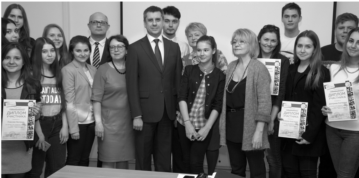
■ В финале — фото на память

26 апреля в ТГУ прошло награждение участников и победителей VII ежегодного городского конкурса юных журналистов «Тольятти — город молодых».