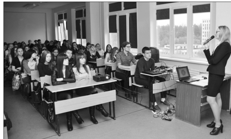
■ Заманчивые перспективы аудиторской деятельности

ной готовности, а также успешно отработать период стажировки. Далее, при утверж-