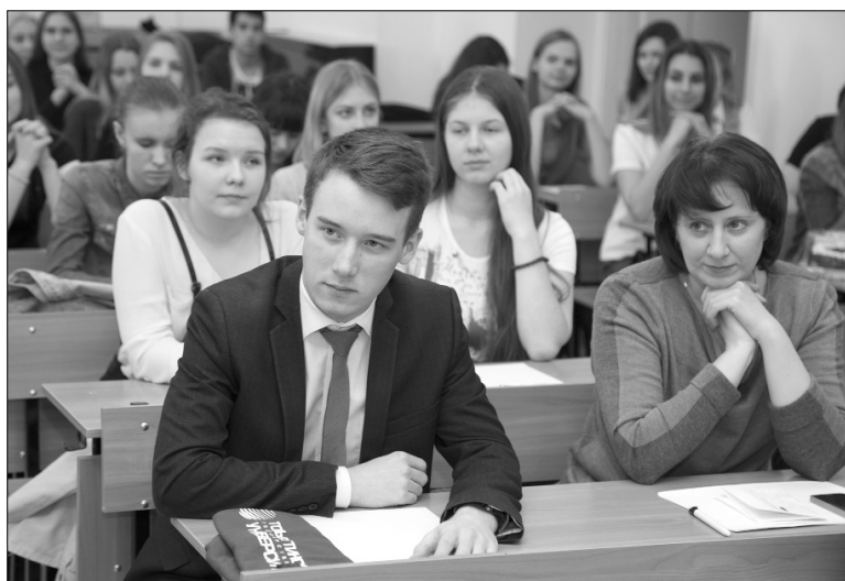
■ Новые лица — новые имена?..