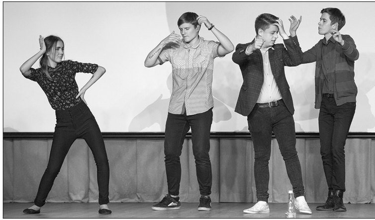
■ Фестивальная сцена требует отдачи

Конкурс-фестиваль «Юмор без границ», состоявшийся в ТГУ 1 апреля, не только зарядил зрителей позитивной энергетикой, но и стал поводом для размышлений о том, как добиться поистине удачного выступления на фестивальной сцене.