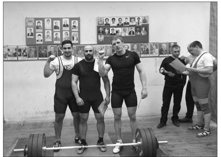
■ Триумфаторы из ТГУ