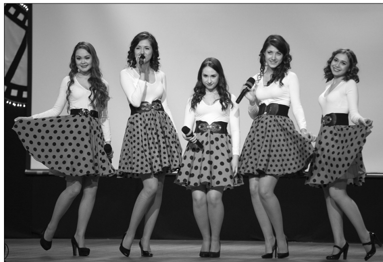
■ Выступление вокального ансамбля ТГУ The Rainbow