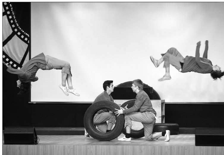
■ На батуте — Vio Cube!