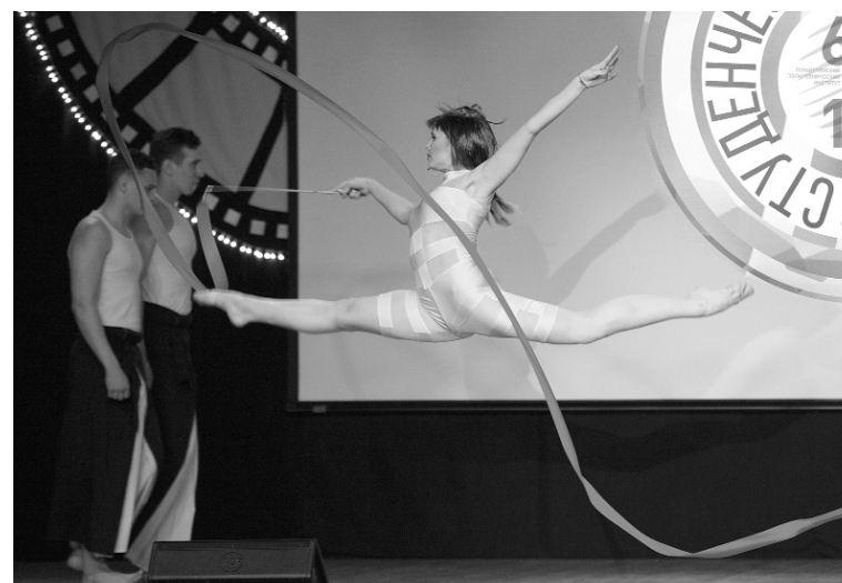
■ Мисс ТГУ в образе Лилу