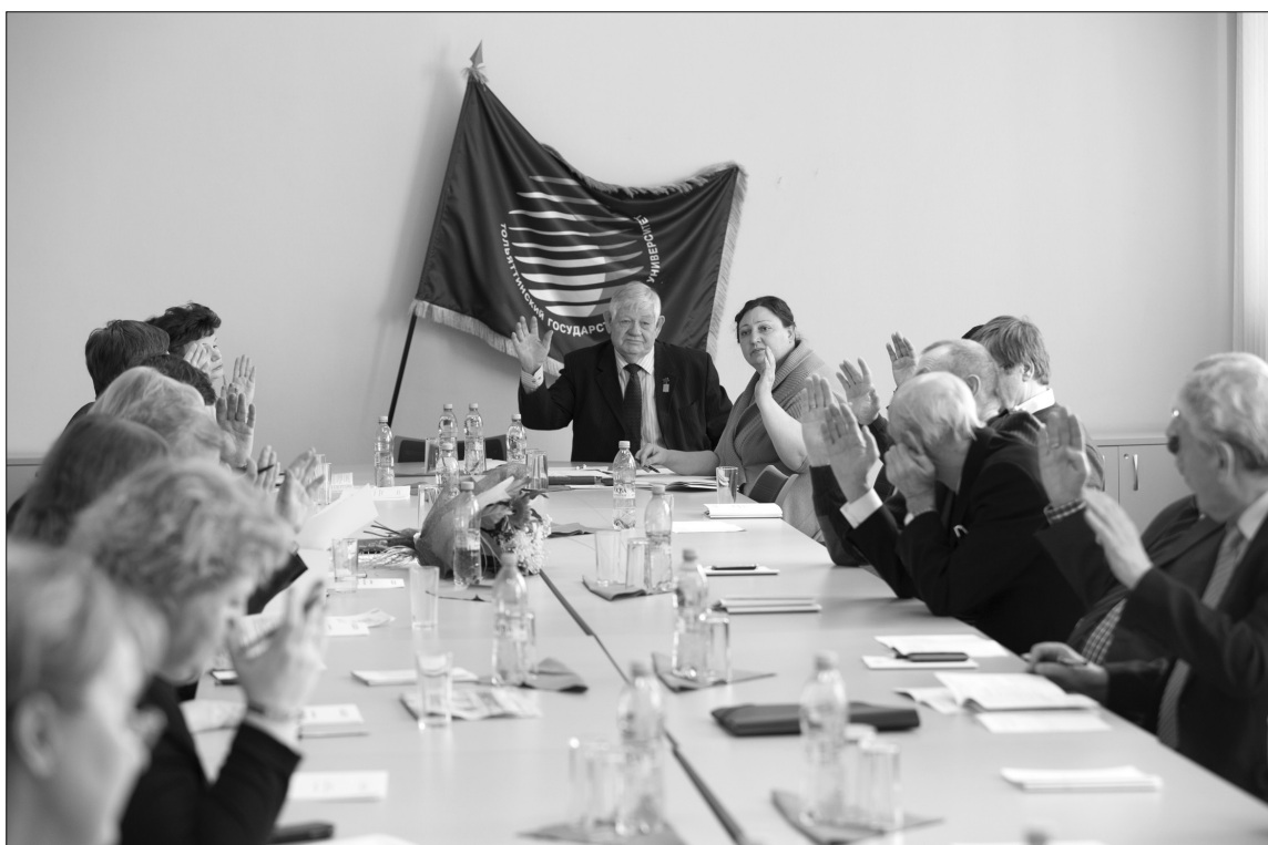
■ Каждый голос — решающий!

Напомним, что на предыдущем заседании Учёного совета от 17 марта ректором ТГУ было поручено разработать приказ «Об исполнении плана антикризисных мероприятий по оптимизации бюджета ТГУ на 2016 год». В связи