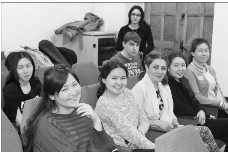
■ Хорошая встреча — хорошие улыбки!

Эту весну девять студенток и один студент из Западно-Казахстанского государственного университета (ЗКГУ) встречали в Тольятти. На полтора месяца их домом стало общежитие № 1 ТГУ. Будущие химики, менеджеры, лингвисты и программисты приехали опробовать российское образование, наладить связи и найти новых друзей.