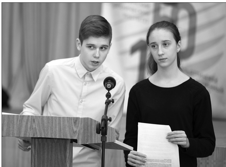
■ Творческое представление проекта...

На базе Тольяттинского государственного университета состоялся первый (заочный) этап XXIII Конгресса молодых исследователей «Шаг в будущее», который является частью федеральной программы «Одарённые дети».