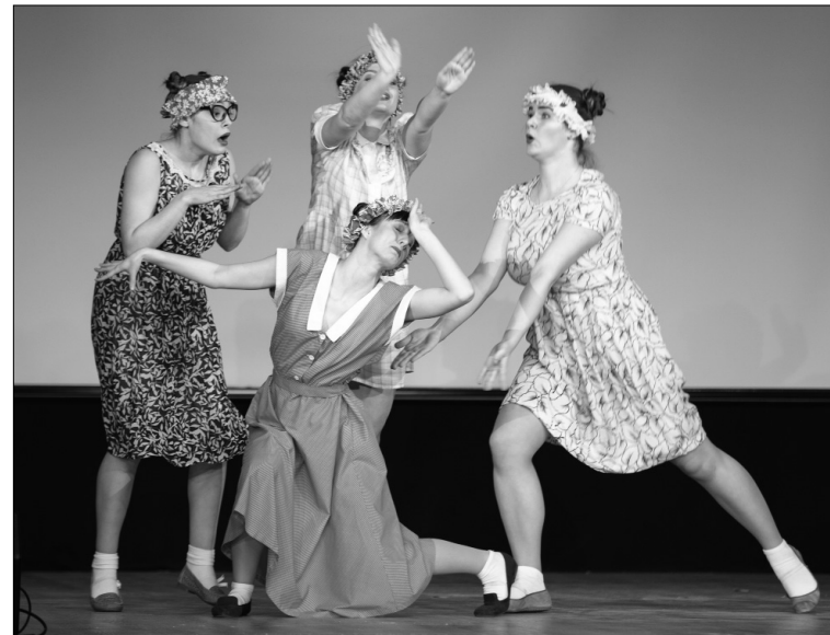
■ «Заломы рук, закаты глаз»

— В этом году мы заканчиваем университет, в «Студен-