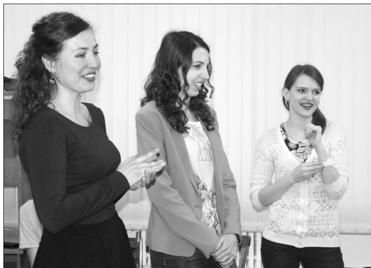
■ Красавицы профкома ТГУ — само гостеприимство

минут. Разница, скажем так, ощутимая, потому что и количество занятий у них не превышает трёх-четырёх пар в день. Длинных обеденных перерывов нет, а вместо знакомой нам шаурмы — кебаб. Штука, говорят, один на один на шаурму похожая, но якобы теплее, вкуснее и сочнее. Ну, на это мы не обижаемся, вкусы у всех свои.