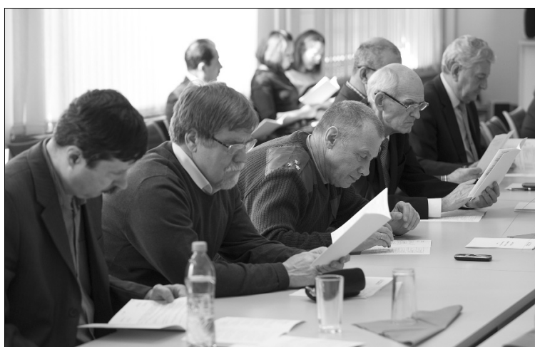
■ Информация к размышлению

Однако во время обсуждения данного предложения на Учёном совете профессор, завкафедрой «Управление промышленной и экологичес-