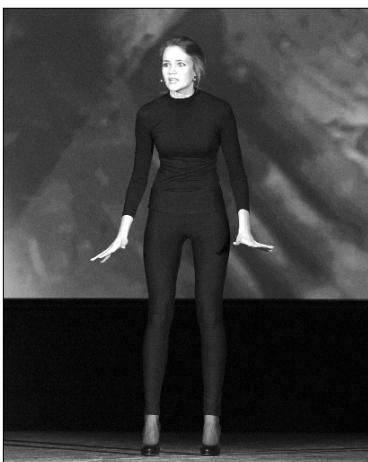
■ «Монолог камеры»

«Заломы рук, закаты глаз» — полюбившийся номер был встречен бурными аплодисментами. Задор девчонок, их смех заряжали позитивом так, что каждый сидящий в зале невольно начинал повторять название их танцевального номера.