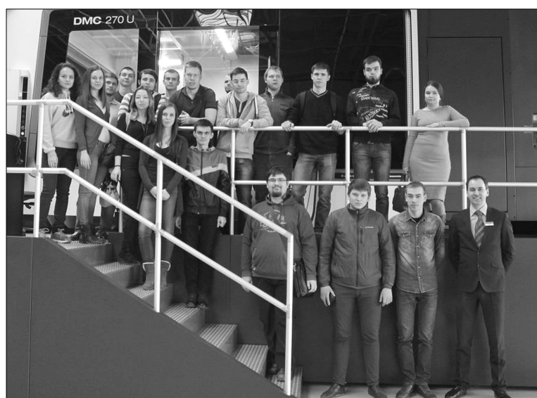
■ Экскурсия в Ульяновске. Фото на память

В конце марта студенты Института машиностроения ТГУ в рамках практикоориентированного обучения посетили станкостроительный завод DMG MORI в Ульяновске. Концерн является лидером мирового станкостроения и высоких технологий.