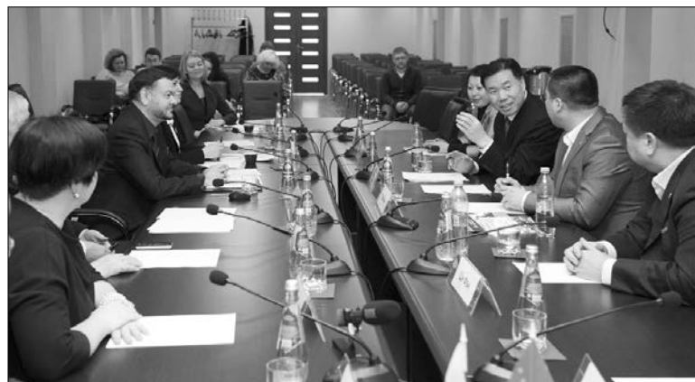
■ Встреча прошла на позитивной волне

— Я очень рад, что приехал из далёкого Китая к вам в город и в университет для решения множества рабочих вопросов и реализации планов. Особенно нас интересует обмен студентами и преподавателями. Ещё одной важной целью является дальнейшее сотрудничество наших вузов по направлению «Журналистика». Если всё получится, то студенты ТГУ смогут приехать к нам на стажировку и изучение китайского языка, а наши студенты — к вам для изучения русского языка. В целом программу обмена студентами решено сделать потому, что ваш вуз — это хорошая образовательная площадка с современным оборудованием и достойными преподавателями. Студенты Хэйхэского университета, я уверен, захотят учиться здесь.