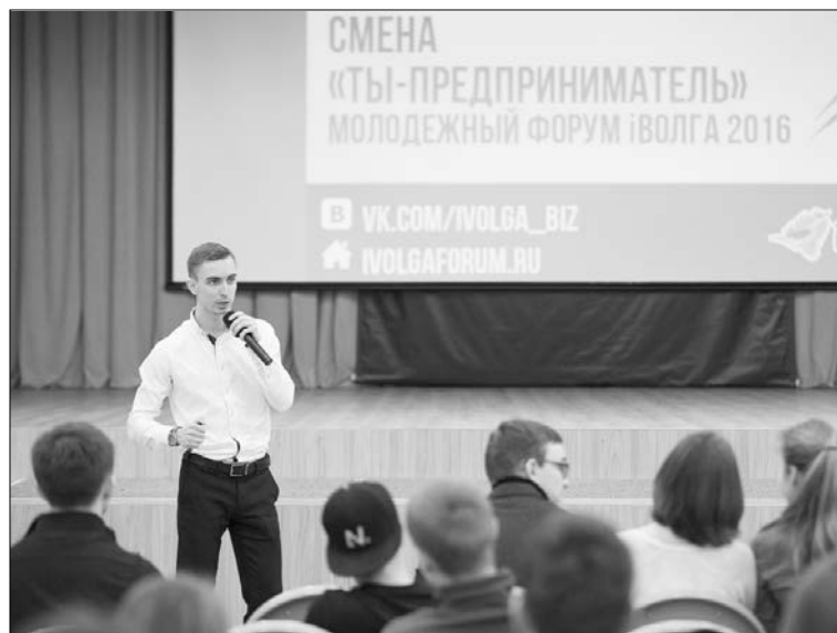
■ Презентация форума

Одну из молодых смен форума «Культурный БУМ!», сквозная идея которой —