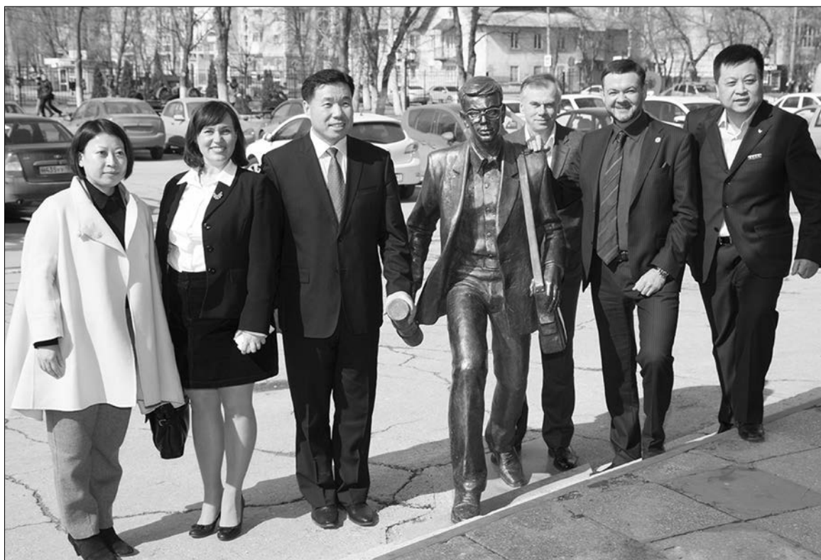
■ Университетский «Шурик» стирает границы государств

Рабочую программу пребывания руководства Уни-