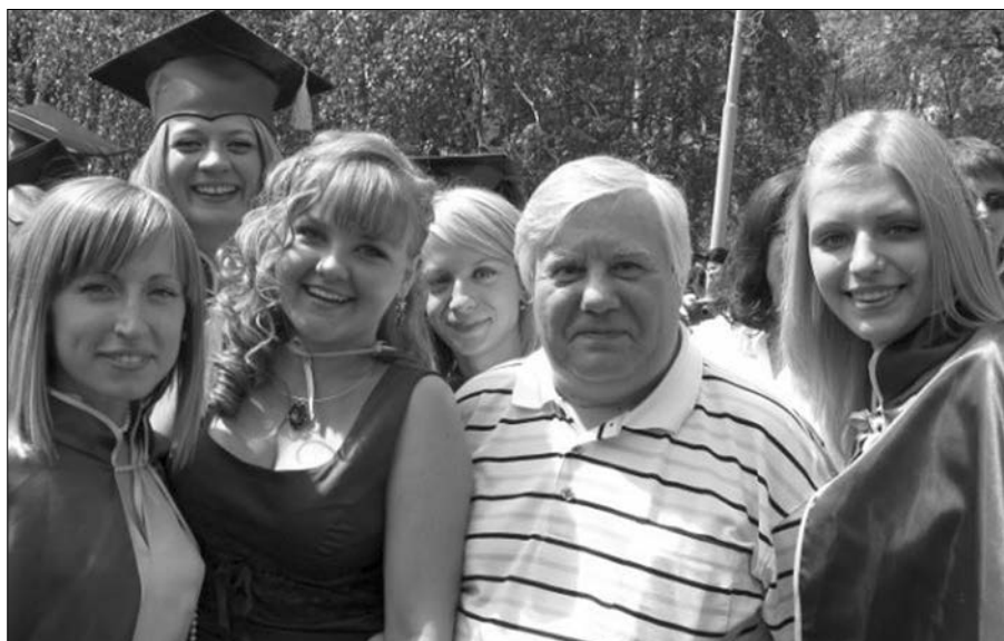
■ Учитель и ученицы на выпускном

— Даже затрудняюсь сказать... Вспомнил! Коллекционирую колокольчики! Причём это хобби мне привили мои коллеги, которые ездили на стажировку в другие страны. Привозят их мне в качестве сувениров. У нас со студентами при выпуске бывает последний звонок. А я был деканом, и поскольку именно я должен был давать последний звонок, у меня скопилась целая серия колокольчиков. Действительно, хобби! Кроме того, основное своё время я провожу за чтением книг. У меня большая домашняя библиотека. Постоянно пополняю её новинками в области языкознания. Это всё-таки сфера моих профессиональных интересов.