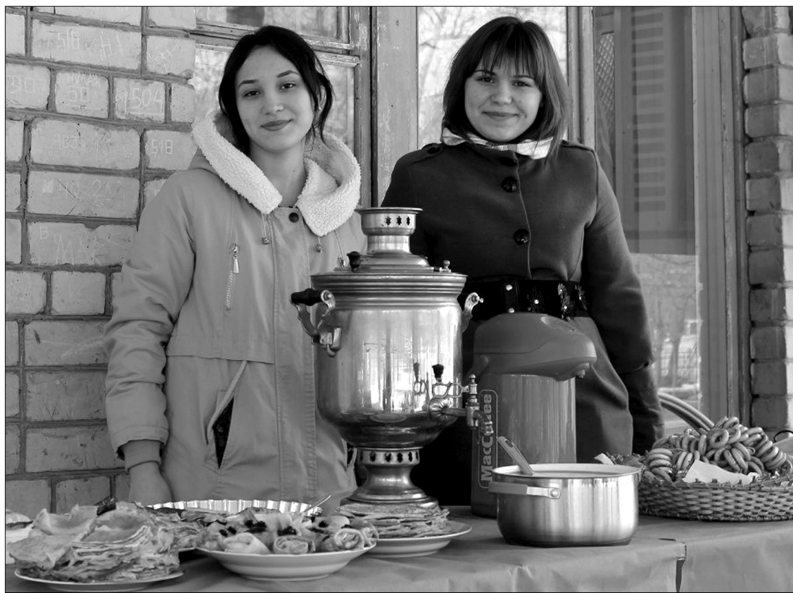
■ Знатное угощение — да ещё с самоваром!

Очень ярко и весело завершили масленичную неделю студенты Тольяттинского государственного университета. Чтобы весна скорее взяла в свои объятия замёрзшую за зиму землю и растопила снежные завалы, студенческий совет общежитий ТГУ совместно с Профкомом студентов и аспирантов ТГУ превратили площадку перед общежитием № 2 в самую настоящую площадку для народных гуляний.