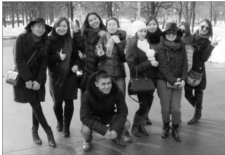
■ Студенты из Казахстана на экскурсии

Десять студентов из Западно-Казахстанского государственного университета им. Махамбета Утемисова (г. Уральск) прибыли в Тольяттинский государственный университет для учёбы по обмену. Это первый опыт обмена студентами-бакалаврами с Казахстаном. Ранее в программе по обмену принимали участие только студенты-магистры.