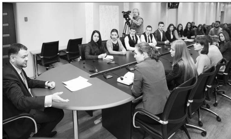
■ Январь 2015-го. На встрече с ректором ТГУ студенты заявили о своих решительных действиях в защиту имиджа города

Поэтому целью данного социологического исследования