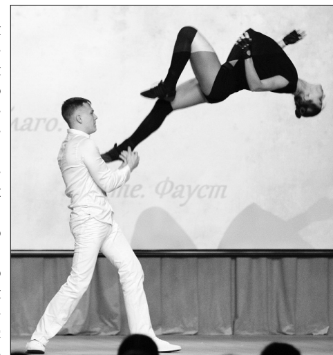
■ Феерический танец