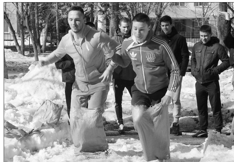
■ Этот трудный бег в мешках...