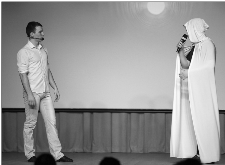
■ Жизнь после жизни

Студенты Института машиностроения (ИнМаш) ТГУ были уверены: в современном мире можно купить всё. Или нет? Например, счастье, любовь и жизнь, в конце концов?! Именно о её ценности ребята и размышляли на сцене в своей концертной программе фестиваля «Студенческая весна — 2016», чередуя творческие номера и театральные зарисовки.