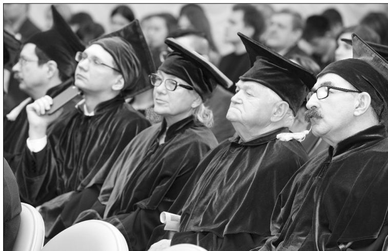
■ Vivat Academia! Vivant professores!

— Служение науке всегда было призванием, а в последнее время это стало ещё и профессией. От этого, я думаю, ответственность учёных