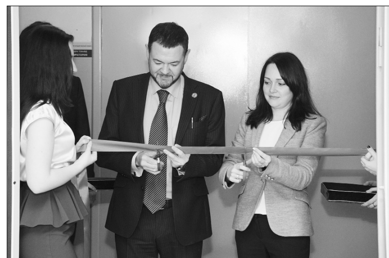
■ В добрый путь — за новыми знаниями