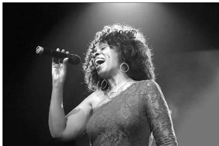
■ Мэла Уолдрон

19 февраля в 19.00 впервые на сцене Тольяттинской филармонии выступят американская джазовая дива Мэла Уолдрон (вокал, фортепиано) и джаз-оркестр филармонии под управлением Валерия Мурзова .