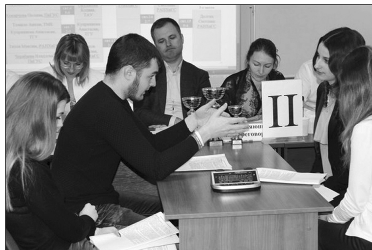
■ Поединок за первое место