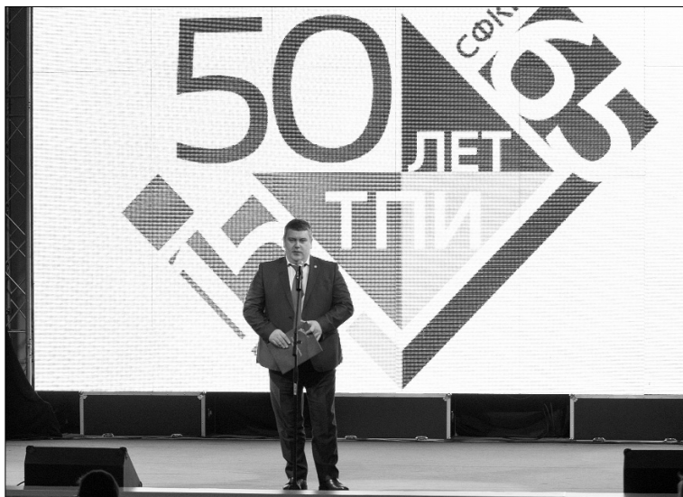
■ Вице-губернатор Дмитрий Овчинников зачитывает поздравление от губернатора Самарской области Николая Меркушкина

Примечательно, что на получении ТГУ статуса опорного вуза в предстоящем году сделал акцент и губернатор Самарской области, председатель Попечительского совета ТГУ Николай Иванович Меркушкин. В своём поздравительном адресе он отметил: «Сегодня перед нами стоит важнейшая задача