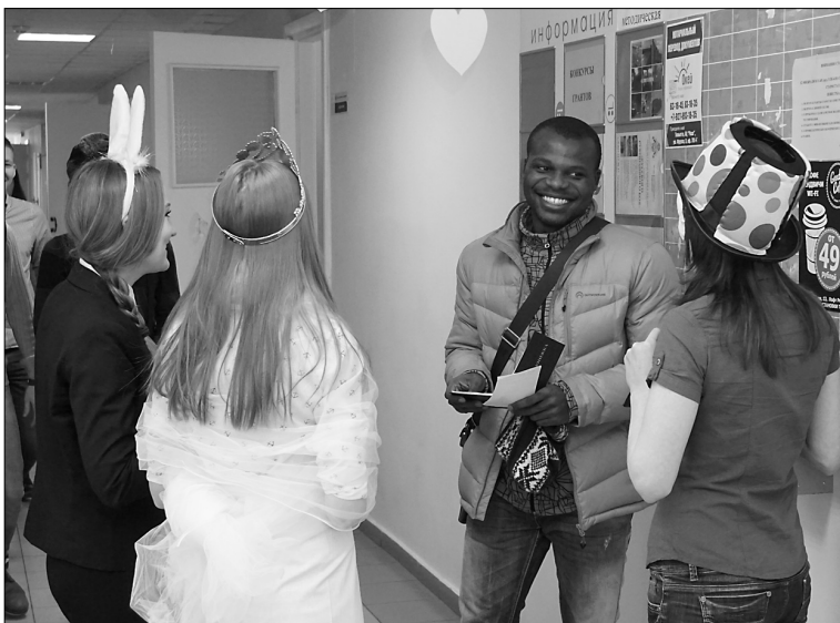
■ 13 февраля возможны любые сюрпризы

«Стена признаний» уже с четверга стала заполняться надписями-откровениями самого разного характера. И адресные признания в любви, и слова народной мудрости, и строчки из песен и стихов. К сожалению, не всегда «признания» носили позитивный характер, но всё было выска-