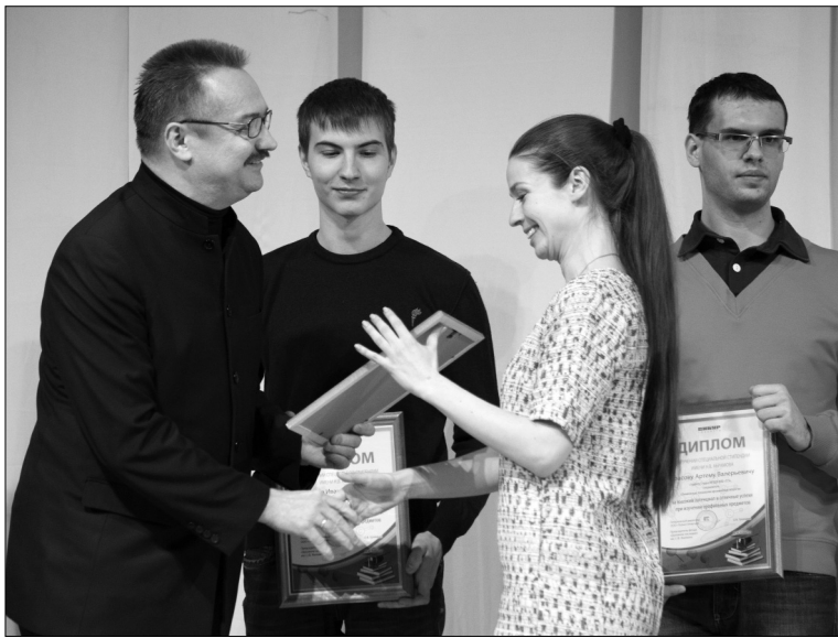
■ Церемония награждения преподавателей ТГУ