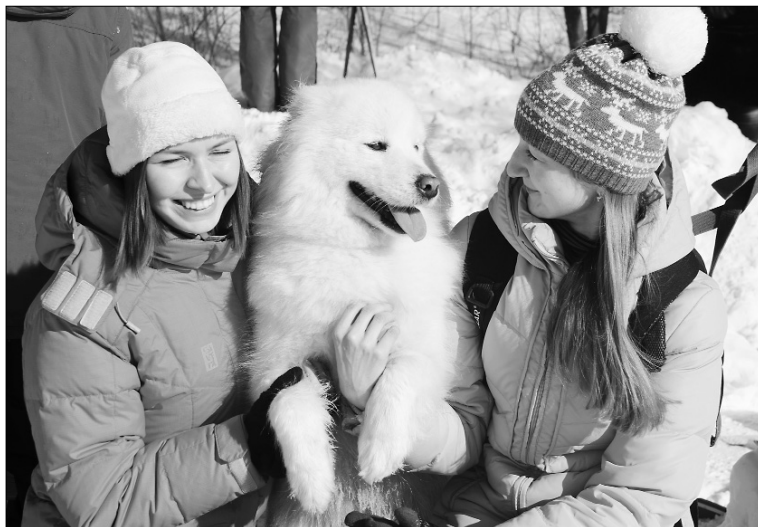
■ Самые обаятельные и привлекательные

Программа фестиваля была насыщенная: скиджоринг, упряжки по две, три-четыре,