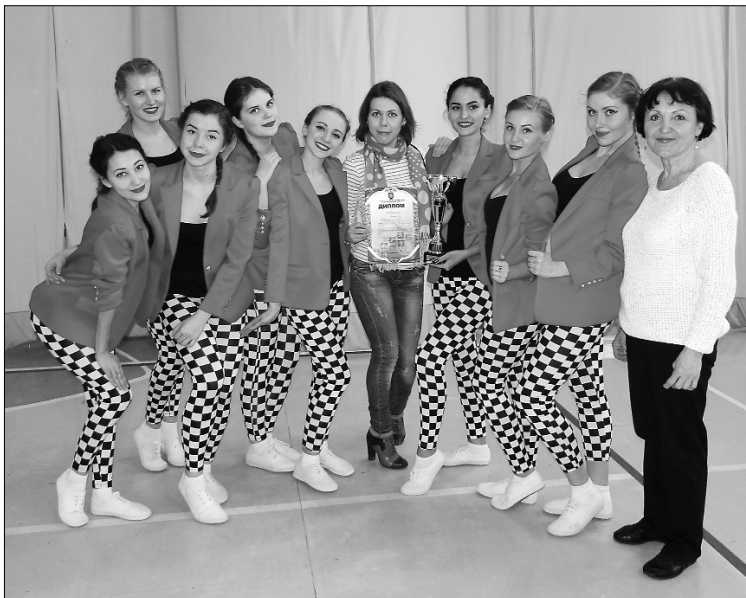
■ Сборная ТГУ по аэробике