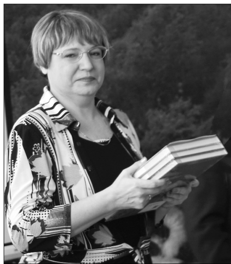
■ Заслуженный приз — трёхтомный определитель птиц

«Большой год» — конкурс фотоохотников, которые соревнуются в том, кто сумеет за год сфотографировать больше диких видов птиц. Движение любителей-орни-