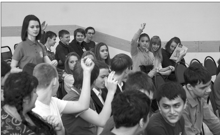
■ Что ты знаешь о профессии?

В первую неделю февраля прошла завершающая «Ярмарка гуманитарно-педагогических профессий». А всего их было три — в каждом районе г.о. Тольятти: школа № 89, гимназии № 9 и № 39. В общей сложности их участниками стали более двухсот старшеклассников, выбирающих вуз для поступления.