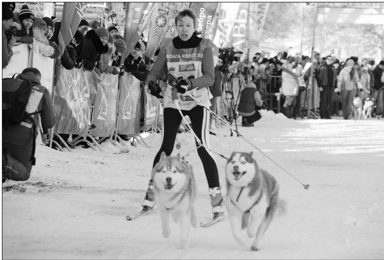
■ На дистанции

Т олько к середине февраля осознаешь, как быстро пролетела зима. В последние деньки хочется поймать побольше этих снежных впечатлений, побегать на воздухе. Чтобы день не прошёл даром, я решила попробовать себя в качестве волонтера на фестивале ездового спорта «Волга Квест-2015». Там никогда не бывает скучно и найдётся работа для каждого.