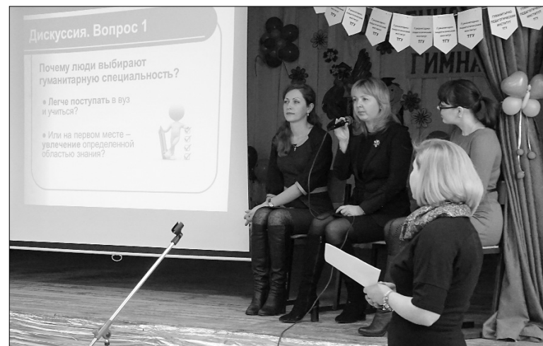
■ Подиум — дискуссия