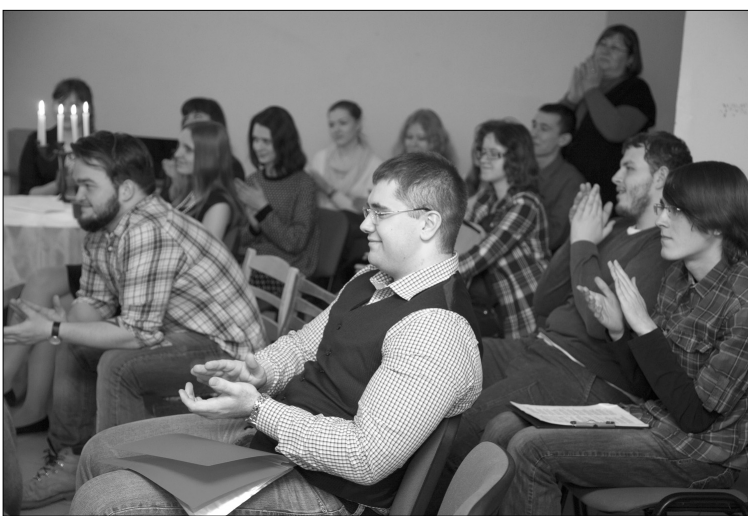
■ ...и юные таланты