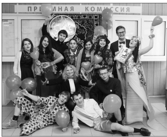
■ Фото «на фоне ковра»

Празднование Дня святого Валентина прошло 13 февраля в Тольяттинском государственном университете. Объединённый совет обучающихся при поддержке Профкома студентов и аспирантов ТГУ организовал торжественную программу под названием «Сказочный день влюблённых».